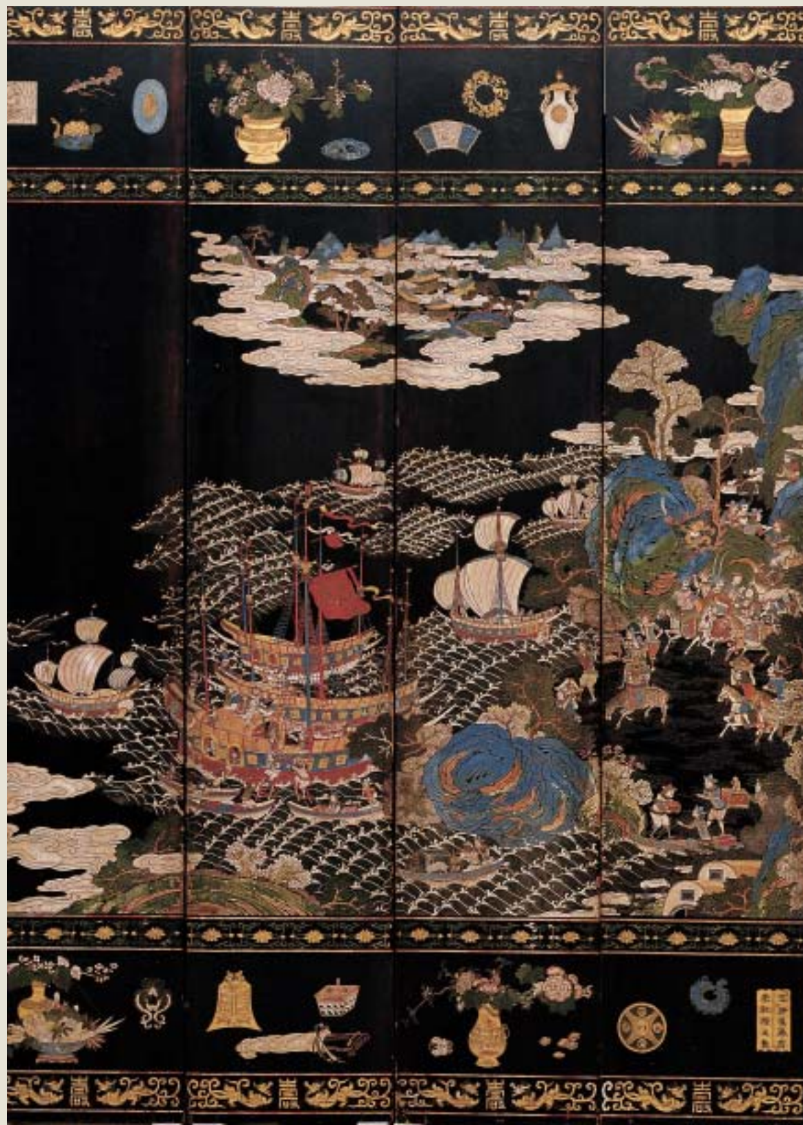
清初 海景人物圖款彩黑漆屏風 尺寸：二七三·五×六〇〇×六公分 收藏者：丹麥民族博物館

這是一件製作精緻而題材罕見的屏風。根據僅見的彩色正片所示（註一），視其造型風格應是清初（十七~十八世紀）製品。技法以款彩為主兼採用描飾（註二）。款彩屏風在十七、十八世紀時十分受到歐洲人喜愛。歐洲人自康熙二十三年（一六八四）海禁開放後，積極進行與中國貿易，大量將中國瓷器、漆器、茶和絲綢運往歐洲。當時歐洲盛行在住宅中設置「中國房間」，就如台灣前數年流行的和式屋，屏風因此經常被採用為中國房間的主要裝飾（註三）。 十七世紀前後，成箱的屏風大都是經由荷蘭、英國、法國設在印度東部的克羅曼多海岸的東印度公司銷歐洲大陸的，歐洲人也就以「克羅曼多漆屏風」為此物的稱名，迄今不改（註四）。 本件十二牒屏風，飾通景彩畫。四周以博古圖和雙龍壽字紋裝飾邊框。本幅展視自右而左，繪飾曲水環山，山間有一大宅院，這可能是意指某一處海濱儲集貨物之地。眾人由此上下，往來如織，負戴於途，牽著獅子，趕著駱駝，肩扛老虎籠子，有滿盛瓜果的牛車，也有立在馬背表演的人；第七牒中景處，有大象背上馱一組小樂隊，緊隨著馬隊，中有一人身著紅色披風，二女眷隨侍在側，各抱嬰兒，左邊