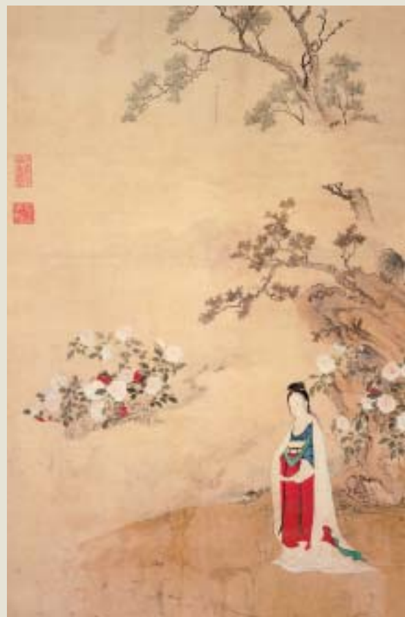
明 仇氏（杜陵內史） 畫唐人詩意圖 國立故宮博物院藏

揮。這些女性的處境與心聲，透過一些優秀藝術品的詮釋，才幸運地博得同情與關注。 故宮藏品中，以女性為描繪對象，或者由女性所創作的作品，數量相當可觀，不僅從藝術鑑賞的角度看，頗多精良的一時之選，即便就內容分析，其所涉及的題材，和能夠反映的層面，也十分廣泛。本次故宮策劃「群芳譜——女性的形象與才藝」特展，其目的，除了向觀眾介紹展品本身所含有的藝術美感，另一方面，更期待能夠藉著以下三個分項主題，具體勾勒出中国古代婦女的豐富面向，進而探討，並且詮釋與女性攸關的課題。 主題一，名為「婦容」。女人天性愛美，加上「為悅己者容」（語見《戰國策》）思維的