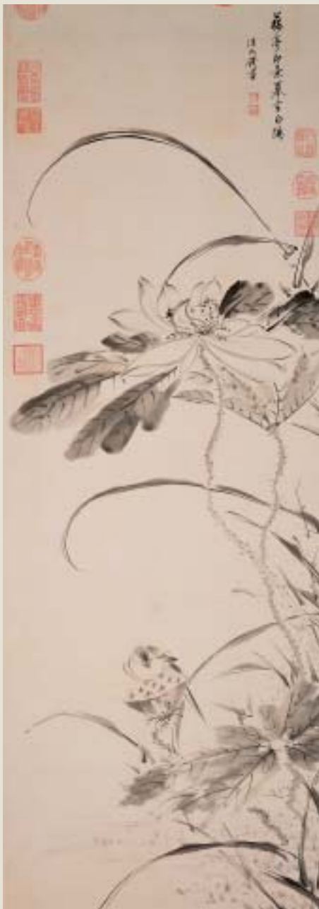
清 陳書 畫荷花 國立故宮博物院藏

展覽期間，承蒙公共電視台襄贊，將同時假本院多媒體展示室，以「世紀女性——台灣第一」為題，輪流播映介紹當代傑出女性的錄影短片。另外在五月十四日，亦計畫舉辦為期一天的學術研討會，會中將發表八篇論文，廣邀海內外從事女性相關研究的學者專家，共同參與盛會。相信上述古今交相輝映的系列展演活動，必定是年度中一次女性議題最亮麗的發聲！