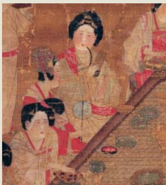
唐人 宮樂圖 局部 國立故宮博物院藏

揮。這些女性的處境與心聲，透過一些優秀藝術品的詮釋，才幸運地博得同情與關注。 故宮藏品中，以女性為描繪對象，或者由女性所創作的作品，數量相當可觀，不僅從藝術鑑賞的角度看，頗多精良的一時之選，即便就內容分析，其所涉及的題材，和能夠反映的層面，也十分廣泛。本次故宮策劃「群芳譜——女性的形象與才藝」特展，其目的，除了向觀眾介紹展品本身所含有的藝術美感，另一方面，更期待能夠藉著以下三個分項主題，具體勾勒出中国古代婦女的豐富面向，進而探討，並且詮釋與女性攸關的課題。 主題一，名為「婦容」。女人天性愛美，加上「為悅己者容」（語見《戰國策》）思維的