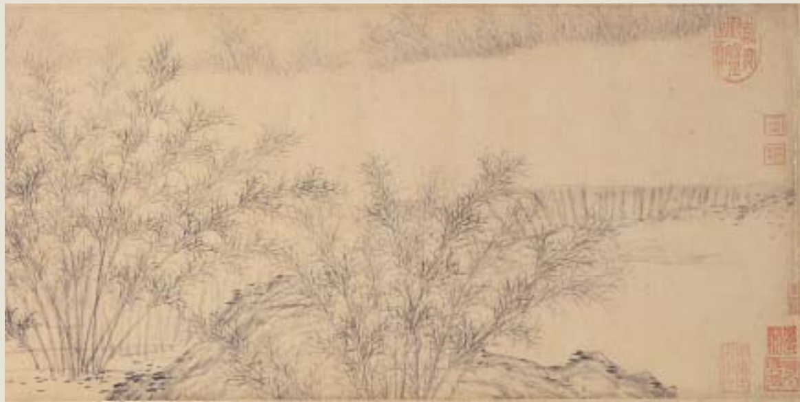
元人（傳管道昇） 煙雨叢竹 局部 國立故宮博物院藏