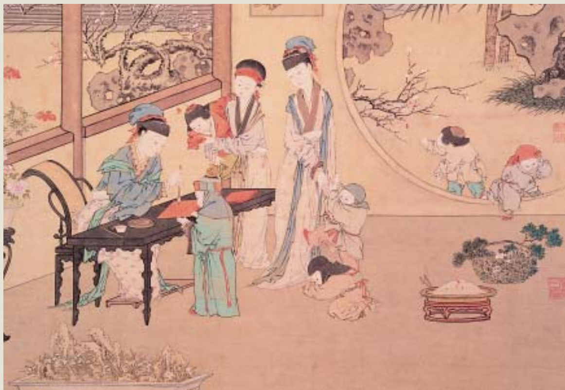
清 金廷標 曹大家授書圖 局部 國立故宮博物院藏

天下，男女各居其半。女性在綿延數千年的文化進程中，自有其不容漠視的地位與貢獻。而談到以女性為表現主題的藝術作品，也確實與整個人類文明的發展史，同等地源遠流長、品類豐富。祇不過，在一般人的刻板印象中，聽到「女性的藝術」，總習慣把它與美人畫，或者美女雕像聯想在一塊兒。事實上，女性藝術所包含的內容，又何止如此狹隘？誠如現實生活中的女性一般，女性藝術既可以描寫為持家、育兒的賢內助、好母親，也可以涵蓋才華洋溢的文藝家，乃至於在政壇上、戰場上不讓鬚眉的女強人。 然而不容諱言，中國數千年的古代社會，基本上仍是一種以男性為主導的環境架構。因此，諸如「男尊女卑」（語出《周易》）、「男主外，女主內」（語見《大易通解》）、「女子以弱為美」（源自班昭《女誡》），與「女子無才便是德」（參見《易酌》）等說法，確實對中國的女性影響深遠，也已發展成多數人根深柢固的觀念。導致極多女性的才藝，終其一生，都無法得到充分的發