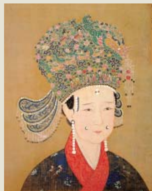
宋人 欽宗皇后像 國立故宮博物院藏

推波助瀾，整裝修容、追求外貌的姣好，遂變成女性生活中的重要環節。不過，美的準繩卻非千古不移的定則。諸如：唐人豐肥，宋人溫雅，明清文弱的流行時尚，透過唐人《宮樂圖》、宋人《繡櫳曉鏡》、仇英（約一四九八—一五五二）《漢宮春曉》、陳洪綬（一五九九—一六五二）《縹香》、溥儒（一八九六—一九六三）《執扇仕女》等作品，適足以反映不同時代女性美的典型，因此添加副標題曰「環肥燕瘦兩俱美」，觀眾賞覽之餘，當可會心一笑。 主題二，命名「婦職」。在男耕女織的傳統社會裏，女性所擔負的職務，主要包括養育兒女、操持家務，乃至兼理養蠶、繅絲、紡紗、織繡、製衣等多重的勞動角色。展品中，李嵩（十二—十三世紀間）《市擔嬰戲》、明人