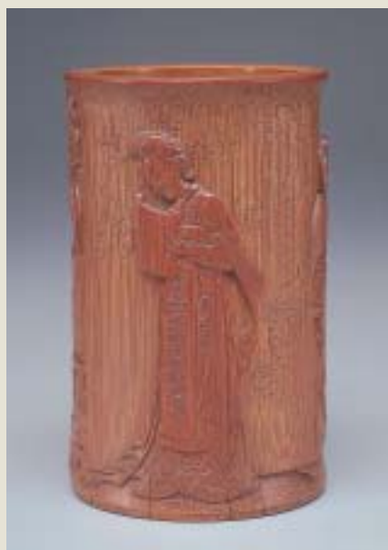
明 朱三松 雕竹窺圖筆筒 國立故宮博物院藏

文倣（一五九五—一六三四）、陳書（一六六〇—一七三六）等，俱屬其中的佼佼者。 至於女性從事詩文創作，成績同樣不遑多讓。譬若唐代的女詩人薛濤（約七五八—八三一）、魚玄機（約八四五—八七〇），宋代的女詞人李清照（約一〇八四—一一五一）、朱淑真（約一一三五—一一八〇）等，筆下莫不情感真摯、意境嫺雅，以女性特有的細膩與婉約，佔居文壇的一席之地。副標題名為「從閨房到書房」，其立意，正是欲從不同的工作場域，來審視歷代女性曾經展露過的才藝。 由於展品類別豐富，總數逾百件之譜，為免有遺珠之憾，遂區分成兩個檔期陳列。前期自四月一日至五月十五日止，後期自五月十七日至六月廿五日止。其中，並包括有〈唐人宮