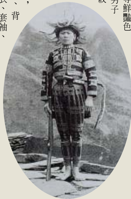
穿著盛裝的排灣族頭目 引自李莎莉1998 《台灣原住民衣飾文化》

紫、黃，及藍等鮮豔色彩，即構成了男子長背心的主要紋飾。 傳統鄒族男子衣服的材料大多以皮革為主。族人將所獵獲的動物，揉製成帽子、背心、披肩、上衣、衣袖、胸飾、後敞褲(或稱綁腿褲)、包狀似鞋子，以及火具袋等皮質衣物。成年男子於接受成年儀禮之後才可戴皮