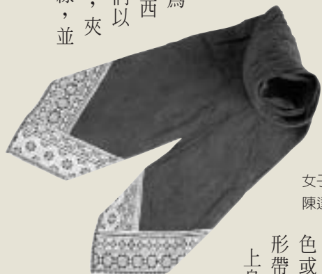
女子頭巾

族素以善於紡織與刺繡著稱，其中尤以位於埔里的巴則海之織物最為精美，刺繡則以西拉雅族為優。他們以苧麻為主要材料，夾織各種顏色的毛線，並