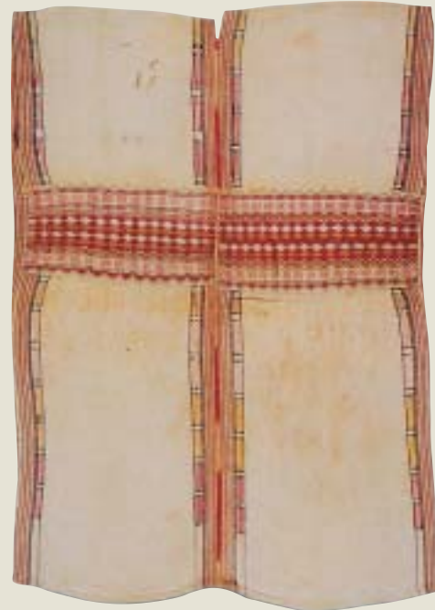
布農族男子長衣 (背面)

與鄒族頗為類似。聞名一時的水沙連達戈紋布，即以樹皮合葛絲，染五色狗毛夾織成毯子。棉布多向漢人取得，因價廉且大量進入，使得傳統的織布技巧衰微，目前已無人知曉過去所使用之移動式水平背帶織布機的操作技術。傳統的服裝如今僅能在公媽籃(即祖靈籃)內看到。公媽籃是邵族人作祭時的重要祈告對象，籃內物品多為過去祖先所遺留下來的衣飾(按，每年農曆八月豐年節之時，每家長輩會斟酌添放新品)(參謝世忠與蘇裕玲一九九八；謝世忠 一九九九)。所見的古老衣服係呈灰黑色，且多處有破洞，可知年代久遠，這些衣飾代表著祖靈的存在，其形制現已不復為族人所穿用。 布農族一般利用獸皮、傳統麻