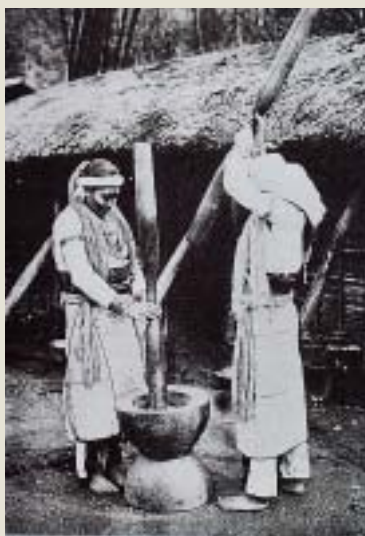
泰雅族太魯閣地區女子服裝 引自李莎莉1998《台灣原住民服飾文化》

紋、八卦圖形紋等，亦有寫實性花紋出現，如鳥、動物，及花草等。婦女們非常懂得使用各種天然物質製造裝飾品，材料以瑪瑙、螺錢、豬牙以及其他珠飾為主。