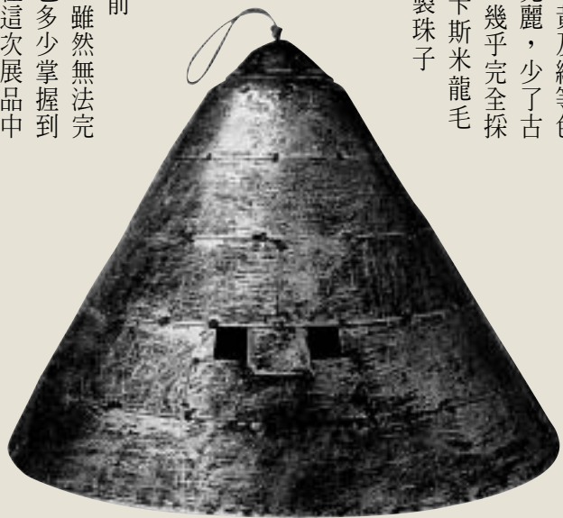
雅美族銀盔

更進一步揣摩三百年前的臺灣原住民生活景象。雖然無法完整的回復歷史原貌，卻也多少掌握到蛛絲馬跡。幸運地，能在這次展品中發現可與平埔族刺繡花紋做一比對的青花荷蘭故事盤盤緣花紋，以及荷蘭銀幣中的獅像造型。原本以麻織布為主的原住民各族群部落，到了十七世紀經由不同文化的接觸，始有刺繡技藝及棉布使用的發展，傳統服飾因此產生了極大的變化，各族群文化相互採借的景況也接續出現。例如，六堆地區客家婦女肚兜上的刺繡花紋、清朝時期臺灣女子三寸金蓮飾褲上的刺