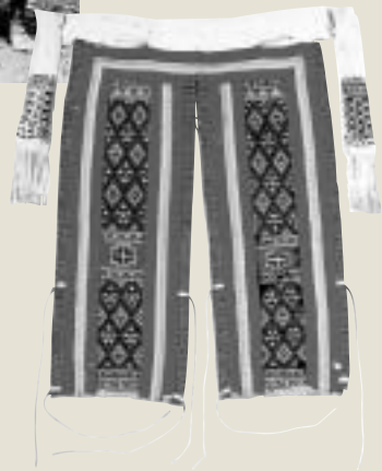
卑南族男子後敞褲 南天書局提供