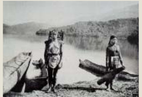
穿著傳統服飾的邵族男女 引自李莎莉1998 《台灣原住民衣飾文化》

埔族)之間而稱為「化番」，其含義似乎為「歸順進化之生番」。部份學者認為他們在語言、社會組織上與布農族有諸多相同之處；而在男子服裝上則