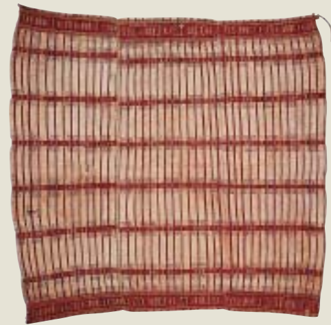
排灣族女子夾織喪巾 台灣民俗北投文物館提供

紫、黃，及藍等鮮豔色彩，即構成了男子長背心的主要紋飾。 傳統鄒族男子衣服的材料大多以皮革為主。族人將所獵獲的動物，揉製成帽子、背心、披肩、上衣、衣袖、胸飾、後敞褲(或稱綁腿褲)、包狀似鞋子，以及火具袋等皮質衣物。成年男子於接受成年儀禮之後才可戴皮