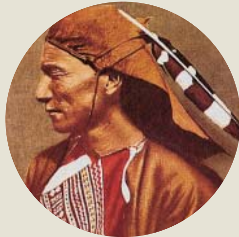
頭戴皮帽的鄒族男子 引自李莎莉1998 《台灣原住民衣飾文化》

布，以及外來的棉布作為衣服的材料。他們與鄒族一樣，擅長揉皮技術，通常係以鹿皮、山羊皮，和山羊皮為主要材質。男子的服飾以長背心最具代表性，居住在南投縣地區的族人服裝較為傳統，不過女子的服裝很早即已受漢人的影響(參徐瀛洲、徐韶仁一九九四)。分布在臺東、高雄地區的男女服裝，有不少仿鄰近魯凱、排灣二族特色的形制。花蓮地區的服裝，大致上與南投地區差不多，唯女子上衣多為天藍色漢式右襟長袖半長衣。傳統的織紋以百步蛇背脊的菱形紋為主，再配以紅、桃紅、橙、