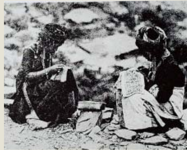
魯凱族女子刺繡情景 引自李莎莉1998《台灣原住民衣飾文化》

帽。盛裝時，帽頂傳統上會插有鷹羽或鷺羽毛一至四支，今則多使用帝雉的羽毛，目的均在彰顯男子的勇敢英武。女子衣服大多以棉布、絲，或綢緞裁製而成。衣服形制有頭巾、長袖短上衣、胸兜、單片式長裙、腰帶，及護腳布等。成年女子平時以黑色頭巾纏頭、兩端多施有直線繡和十字繡花紋，有的則附加上毛線流蘇或絨球。