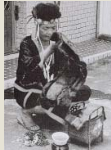
公媽籃內放置邵族祖先遺留下來的服飾

埔族)之間而稱為「化番」，其含義似乎為「歸順進化之生番」。部份學者認為他們在語言、社會組織上與布農族有諸多相同之處；而在男子服裝上則