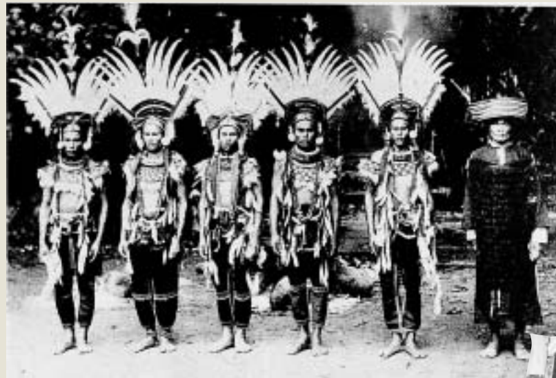
穿著盛裝的阿美族男子與頭目

使用繡框。花紋多以菱形紋飾為主，曲折形紋為輔。緞面繡是魯凱族最精彩的技法，工整細密，極具變化又富規律性。貼飾花紋主要有卷渦形紋、蛇形紋、人頭紋等。無論男、女均以縫綴有小型琉璃珠的