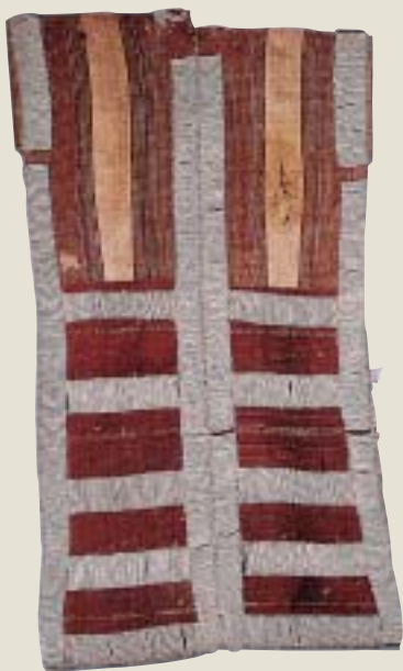
泰雅族貝珠衣