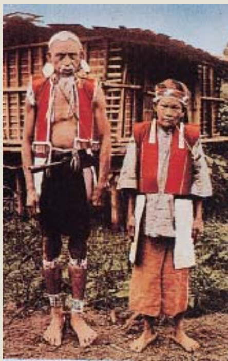
穿著盛裝的賽夏族男女 引自李莎莉1998《台灣原住民服飾文化》

部地區，支群達二十四個之多，傳統上即以織布的精巧來評定婦女的社會地位與才能。今天仍可看到年長婦女保存著舊有的織布機，並教導年輕一輩學習織布的情景。衣服的材料主要是麻、毛及棉線。珠衣和珠裙屬最貴重的禮服，只有頭目、族長或勇士可穿戴。衣服的色彩依地域而不同，除太魯閣地區偏向白色外，其他地區皆屬紅色系統。花紋以橫條紋和幾何圖形為主，其中菱形花紋具有祖靈的眼睛之意，並喜以白鈕釦為飾。