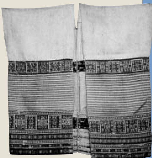
平埔族男子長背心 引自李莎莉1998《台灣原住民服飾文化》

以獸毛、木斛草等作為紋飾。男子上身多著短或長背心，下體圍一前遮片或布裙以護陰，平常則以黑色或藍色棉布縫製成長方形帶狀的頭巾纏頭。女子上身著長袖短上衣，並披一方巾式披肩，下身圍單片或雙片式裙子，小腳再縛以一對護腳布。紋飾多為幾何形花紋，如八瓣花葉形紋、卍形紋、類似雷形