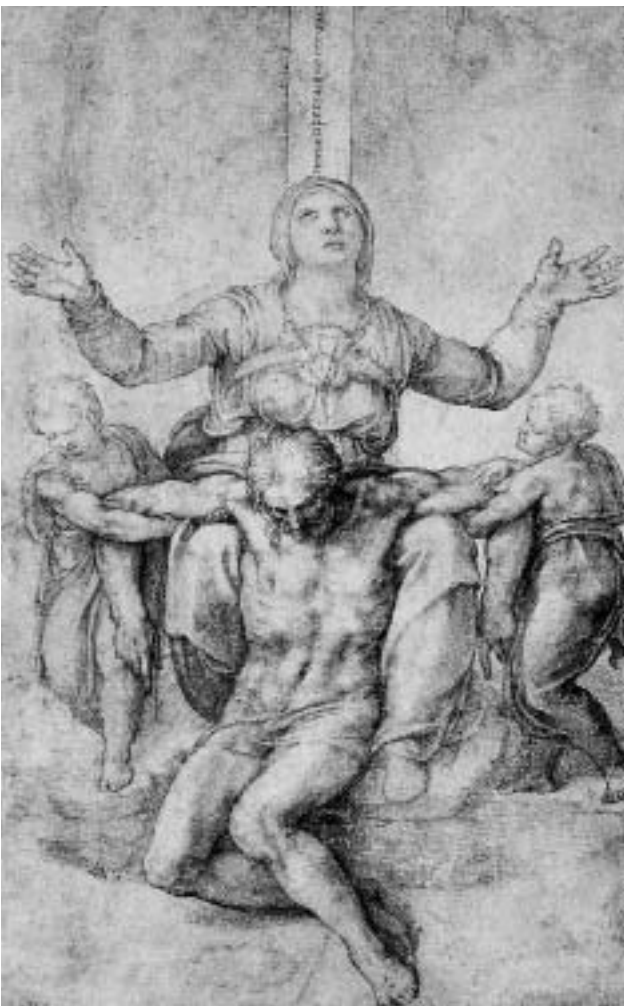
手繪〈高勞娜慈悲像〉，繪基督已亡，躺在聖母懷中，左右有天使各一托著耶穌的雙臂 波斯頓Isabella Stewart Gardner Museum 收藏。