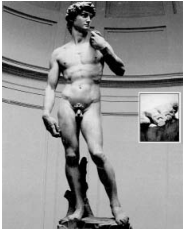
大衛雕像被59歲的狂徒擊碎左腳第二趾，為修補此趾，需花三萬萬里拉（兌換約二十萬美金）。