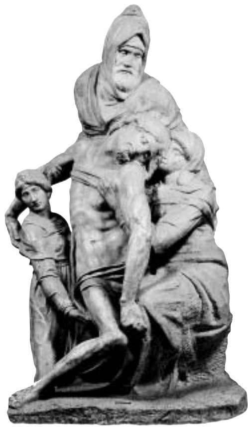
主教座堂聖母慈悲雕像 高226公分，信徒尼哥底母立於基督後， 聖母在右，抹大拉的瑪利亞在左

晚期手繪〈基督被釘十字架〉像，聖母與愛徒約翰站在兩旁 (四一·二×二七·九公分)，為大師六幅〈基督被釘十字架〉之一，約繪於一五五六年，皆為贖罪之作，今為倫敦不列顛博物館收藏。