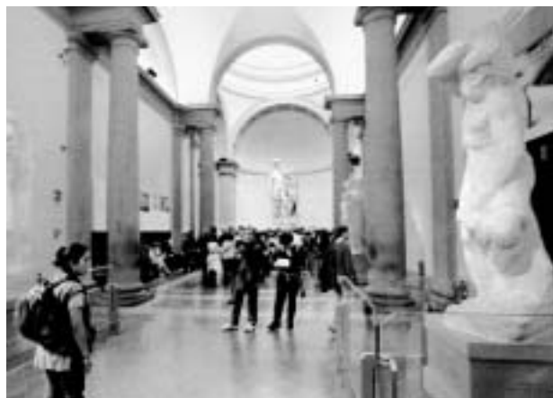
佛羅倫斯學院畫廊內景，觀光客每日眾多，大都聚集在後面，主角大衛巨人則置在最後。前方右即四奴隸之一，其前低矮玻璃間隔清楚可見。