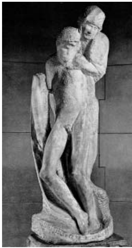
龍達尼尼慈悲雕像 高195公分 米蘭斯富爾載斯高城堡珍藏