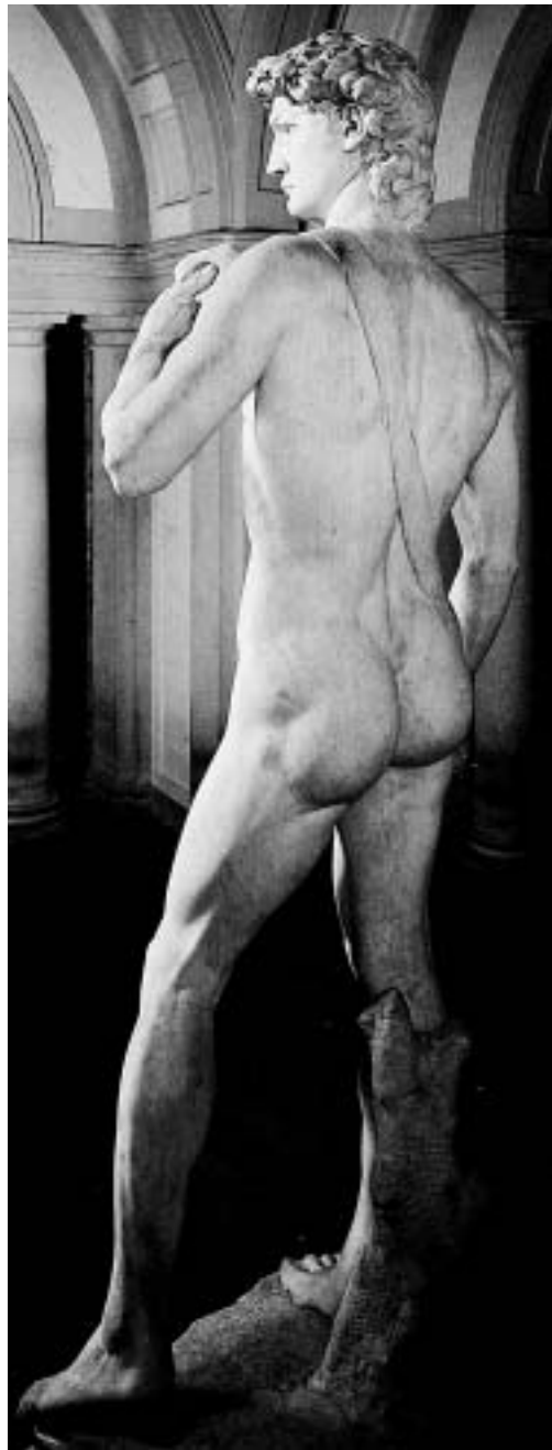
巨人大衛背影（高410公分）