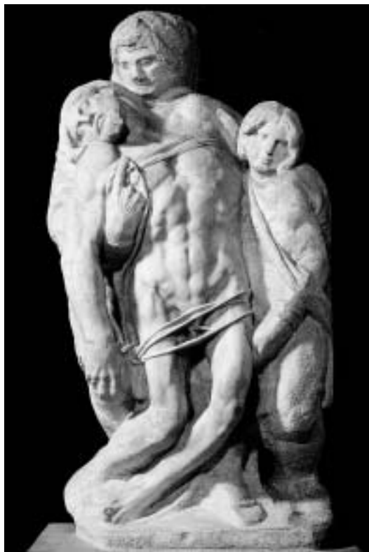
巴勒斯特里納慈悲雕像 高253公分 佛羅倫斯學院畫廊收藏