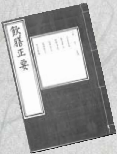
明 景泰七年 飲膳正要 (卷一)