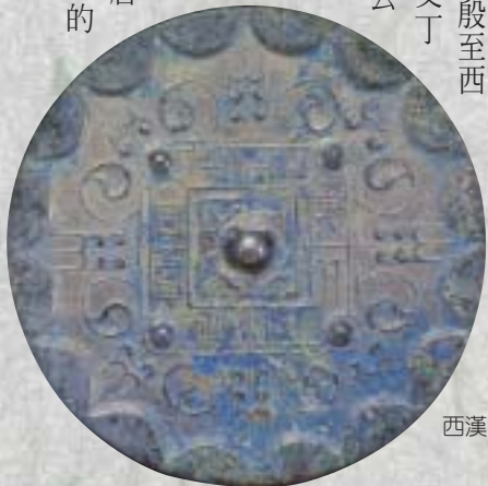
西漢中期 見日之光鏡