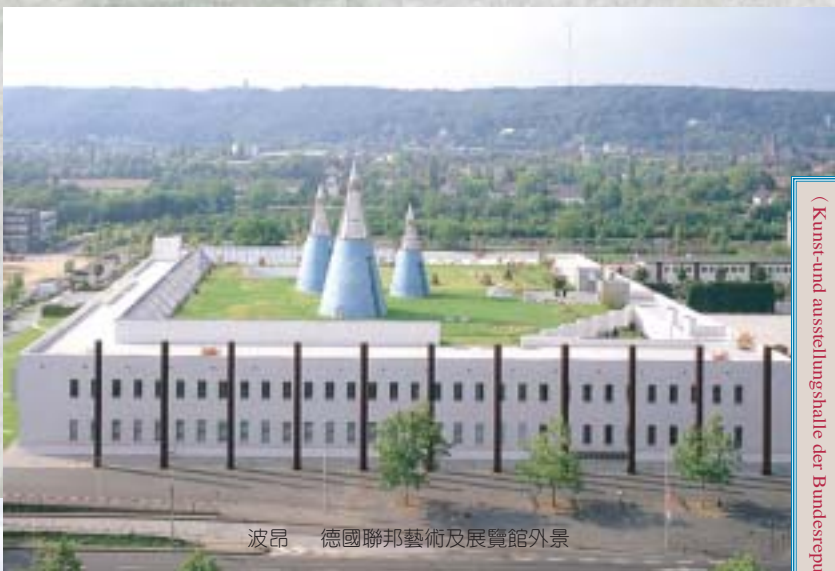
波昂 德國聯邦藝術及展覽館外景

二〇〇三年七月十八日至十月十二日於柏林老博物館 (Altes Museum) 展出 二〇〇三年十一月二十一日至二〇〇四年二月十五日於波昂德國聯邦藝術及展覽館 (Kunst- und Ausstellungshalle der Bundesrepublik Deutschland) 展出