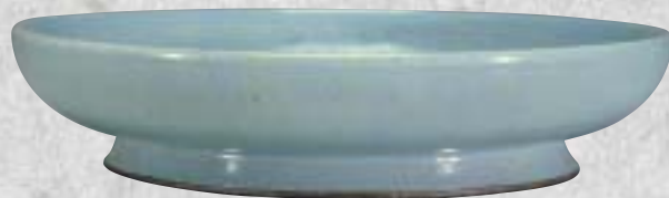
北宋 汝窯 粉青盤

銅爐、銅燈或鏹斗等展品，涵蓋了廟堂禮器與生活實用器。除此之外，唐玄宗所撰寫的〈鶴鵠頌〉，被認為「可能是他傳世僅存的書蹟」；唐代大書家顏真卿的〈劉中使帖〉，內容敘述朝廷討伐安祿山叛亂取得勝利，顏魯公甚感欣慰。兩件書蹟原本都是清宮舊藏，但是〈劉中使帖〉後來流散出宮，近年方由台北故宮價購徵集。