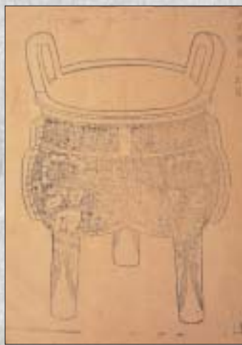
元 宣和博古圖錄 (卷一)

冊頁。至於南宋理學家朱熹所書寫的〈易繫辭〉，歷經元明兩代的名家收藏，於清代乾隆朝入宮，《石渠寶笈·初編》曾著錄，道光年