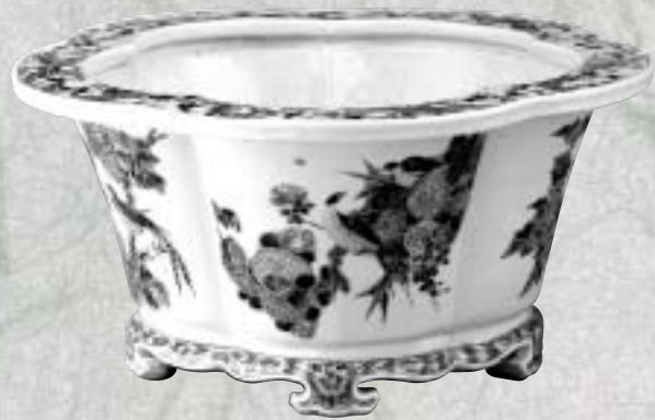
清 康熙 五彩花鳥紋花盆

雖然僅憑藉著台北故宮珍藏的四百件文物，但欲敘述數千年的藝術文化長流。在為期半年，分別在柏林、波昂兩大城市的展覽中，期望雙方共同攜手回顧過去，同時展望未來。