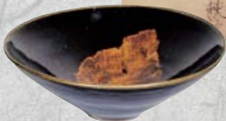
南宋 吉州窯 黑釉木葉紋碗

第二單元包含五代、兩宋與遼金時期的文物，題旨是當時皇室收藏在人文與科技方面的建置。兩宋諸帝雅好收藏，宋徽宗（一一〇一—一二二五）更是其中翹