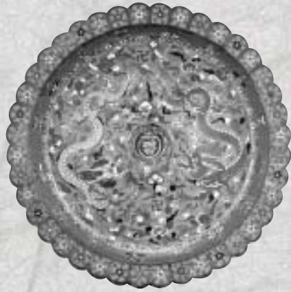
明 萬曆 掐絲珐瑯雙龍盤

的〈「書畫舫」墨〉與〈「百子圖」墨〉，形制一方、一圓，紋飾一簡、一繁，說明明代中晚期之後，工藝上品牌的確立與當時人對於名牌的重視。 清代是「皇室收藏」集大成的時代，清高宗乾隆皇帝可謂舉足輕重。當時皇帝雖然身為天子，往往也是一位藝術鑑賞者，凡是歷朝歷代曾經擅長的技藝，此時莫不戮力恢復。除此之外，更新創不少史無前例的工藝，諸如盜釉中的珐瑯彩，模仿雕漆器、古銅器、竹木器的釉色，利用松花石材的天然色層，巧雕出獨具特色的石硯等等，雖然不算是罄竹難書，卻也不一而足。藏傳佛教的〈藏文甘珠爾經〉與各類法器，來自域外而別具特色的痕都斯坦玉器，西洋傳教士在內廷完成的畫作（最著名者即義大利畫家郎世寧），以及歐洲製作的鐘錶與修妝匣（清宮稱為〈規矩箱〉或〈規矩盒〉等），顯示出清初諸帝對於這些外來文化的興趣。