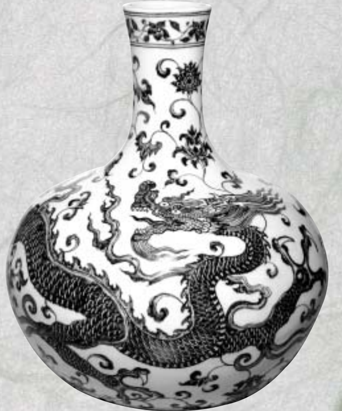
明 永樂 青花龍紋天球瓶

明代歷朝在景德鎮燒造的官窯瓷器，是台北故宮的重要珍藏，明初果園廠的雕漆器，則是明代御府漆器的精華，不但都在展覽之列，而且在質與量方面都佔有一定的比例。明成祖永樂朝御器廠的〈青花龍紋天球瓶〉，有四二六·公分高，腹徑達三五·五公分，是這次展覽中最大、最重的瓷器，彌足珍貴；當然，舉世聞名的〈成化 鬥彩雞缸杯〉，也是展品之一員。兩件針刻永樂款的剔紅漆器（〈剔紅牡丹圓盒〉與〈剔紅山水人物圓盒〉）可供分析明初果園廠「廠器」的工藝。其中〈剔紅人物圓盒〉