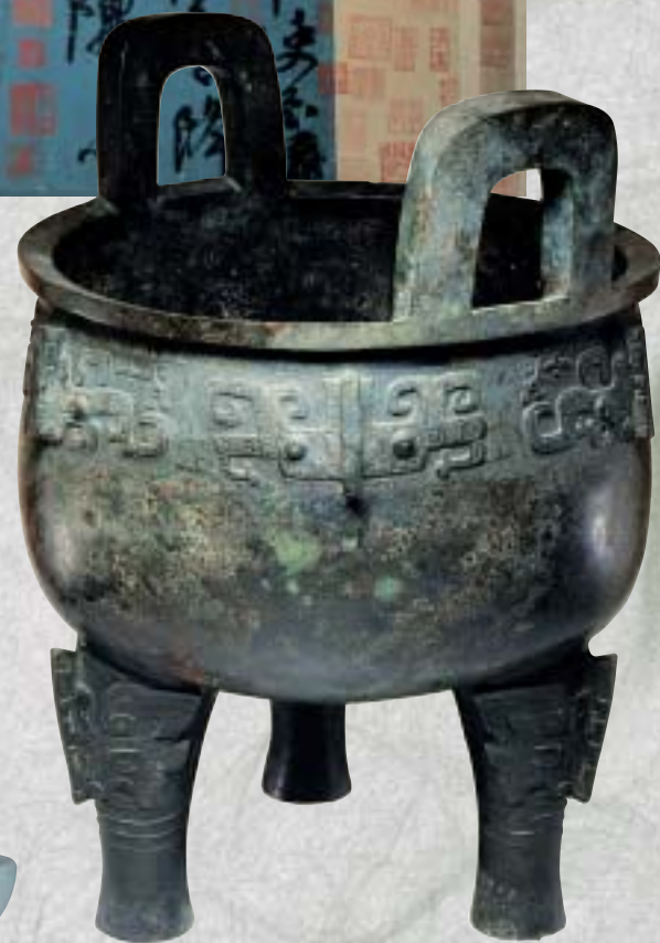
商後期 引作文父丁鼎