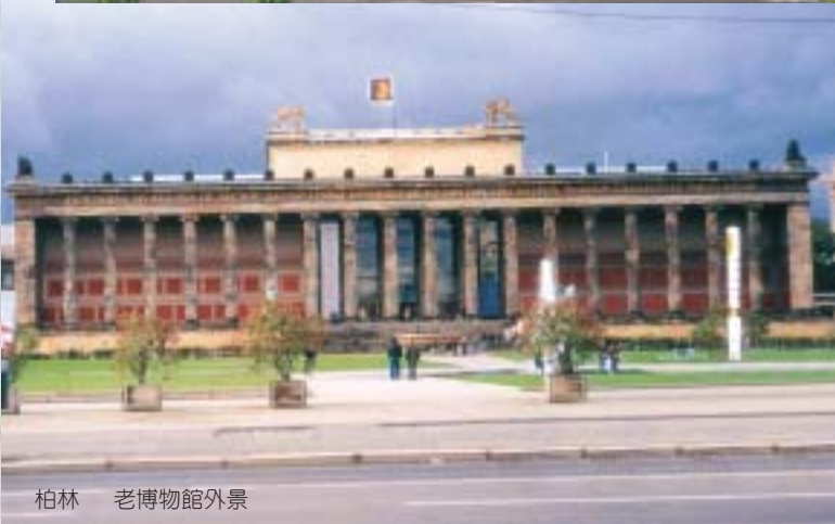
柏林 老博物館外景