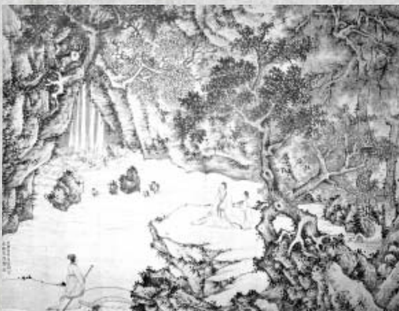
明 文徵明 絕壑高閑

元初的藝壇主盟——趙孟頫（一二五四～一三二二）除了提倡復古主義外，他也認為「書畫本來同」，故而提出「石如飛白木如籀，寫竹還應八法通」的論點，展品中他所畫的〈窠木竹石〉可充分印證他的看法。此外，藉著元四家（黃公望、倪瓚、吳鎮、王蒙）和其他著