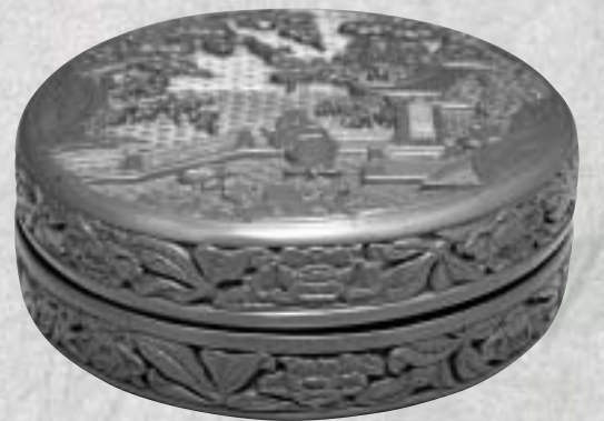
明 永樂 剔紅山水人物圓盒

底部近足緣內側有一刀刻填金楷款：「大明宣德年製」，但在填金字下清晰可見有「大明永樂年製」針刻楷款，已被人用黑漆鬆掩後再刀刻宣德款，印證了明代劉侗、于奕正在《帝京景物略》書中記載：果園廠漆匠將原來永樂針刻款改為宣德款後進呈的故實。 明代中、晚期的工藝層面擴大，展品中的〈萬曆 掐絲珐瑯雙龍盤〉，有「大明萬曆年造」掐絲楷款，是台北故宮唯一一件有萬曆掐絲款的珐瑯器。晚明程君房與葉玄卿各自墨店出品