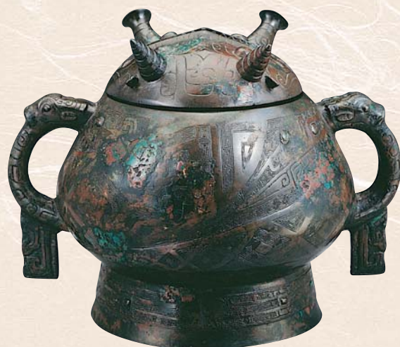
西周早期 雙龍紋簋