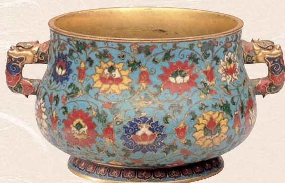
明 招絲珞珈番蓮紋龍耳爐