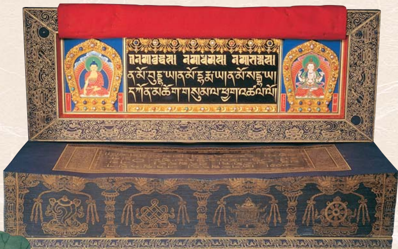
清 康熙 藏文甘珠爾經 (ra 函)