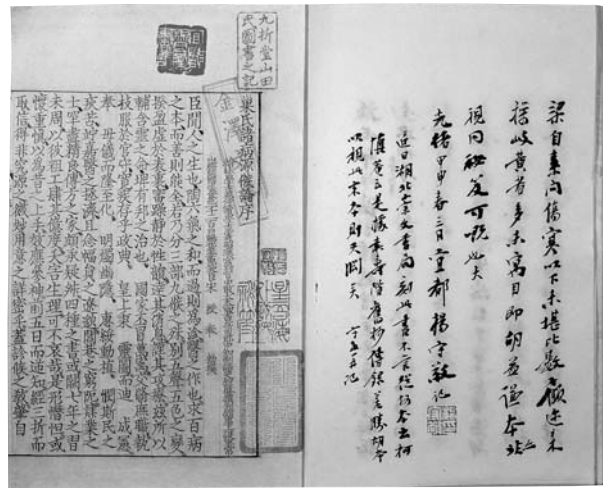
巢氏諸病源候論五十卷 隋巢元方等奉敕撰 日本影宋鈔本

隋大業（六〇五—六一七）中的太醫巢元方，編纂了歷來醫家對病源的探討和病症的描述，詳細而準確，如「消渴症」，雖然最早在《內經素問》中就已經有了對症狀的描述，但此書更進一步認識到，此症容易併發癰疽和水腫，且多因好食甘美而肥所致，此即今天所謂的糖尿病。另外，對腎結石或輸尿管結石的描述也相當真確，巢氏稱為石淋，為之前諸書所未見。狐臭一症亦然，民國二十六年，文史學者陳寅恪發表〈狐臭與胡臭〉一文，認為巢元方所謂「有如野狐之氣」者，多少與胡人血統有關，與巢氏時代相當的孫思邈，更直呼為「胡臭」，反映了魏晉以來數百年民族通婚的影響。（註三）全書約有一千七百餘種證候，是現存第一部論述病因證候學的專書。