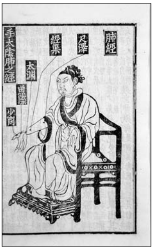
新刊補注銅人腧穴鍼灸圖經五卷 北宋王惟一撰 清覆元刊本

其實按史書的記載，扁鵲原名秦越人，據說曾得異人的秘方和奇藥，擁有能透視人體的特異功能，醫術神奇而高明；當時人所以叫他扁鵲，是因為扁鵲原是古代傳說中的醫神，人面鳥身，山東微山縣出土的畫像石就有這樣一塊，上刻人面鳥身的神人，手拿著針為人治病。