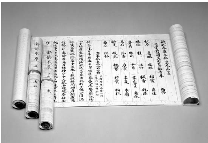
新修本草 唐李勣等奉敕撰 日本影古鈔本

雖然史書上說：「神農嘗百草，始有醫藥」，其實任何藥物，皆是前賢用自己的身體去試驗累積而得。他們把採集來的藥物依產地、生長形態、可用部位、性味功能等等紀錄下來，甚至繪圖，經代代累積，形成今日所見各種藥物書籍。文獻上最早著錄的