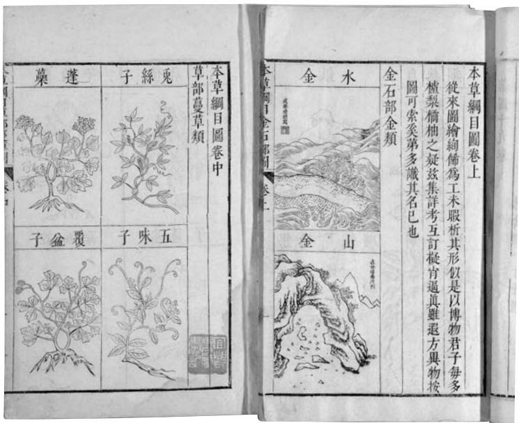
本草綱目卷五十二 明李時珍撰 明崇禎十三年（1640）武林錢蔚起刊本

藥物書籍是《神農本草經》，雖然原書早已亡佚，但從梁陶弘景的集注，知原書收錄的藥物有三六五種，而且也做了分類。若與馬王堆漢墓出土的「五十二病方」所用藥物比較，會發現雷同的僅百餘種，顯示當時所用的藥物其實相當繁多。