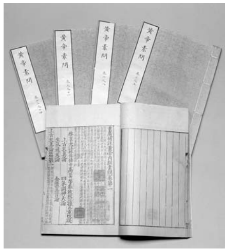
重廣補注黃帝內經素問二十四卷 唐王 冰注 明嘉靖二十九年（1550）武陵顧從德覆宋刊本

前舉《八十一難經》，不知何人所撰，但其理論基礎卻清楚的指向《黃帝內經》，這是現存最古老的一部醫學理論專書，大約完成於東漢之際（約西元二世紀）。由於書中假託黃帝與他的臣子岐伯、雷公等人的對話，故稱做《黃帝內經》。內容相當豐富，從基本理論、病情描述、診斷治療，一直到針灸、養生皆有，主要概括為《素問》和《靈樞》兩部份，其中強調人體整體性結構以及人與自然密切相關的概念，到今天仍在臨床實踐上具有相當的影響力。