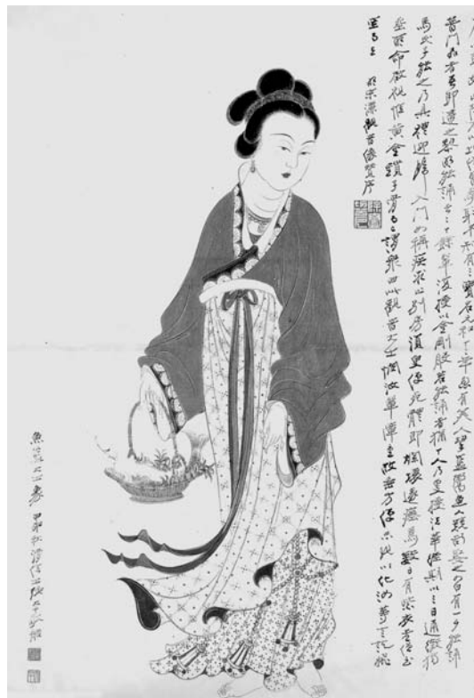
圖九 民國 張大千 魚籃大士像 採自《中國近現代名家畫集—張大千》天津人民美術出版社

由於白衣觀音的形象和氣質，與觀音淚水幻化的白度母頗有相類之處，所以被認為是從白度母得來的靈感。但持不同看法的學者表示：白衣觀音深入地流傳於閨閣之中，宗教的