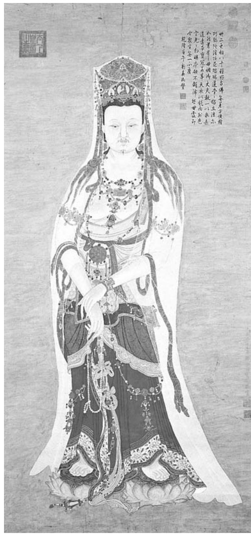
圖三 明 丁雲鵬 莊嚴大士瑞像 國立故宮博物院藏 (丁雲鵬畫中的觀音是壯碩的鬚眉男子，充滿異域色彩。)

體，這種中性的觀音，在雕塑和繪畫中也經常可以看到。 另一幅落款為丁雲鵬的〈畫莊嚴大士像〉（圖二）根據考據可能是仿作。圖中的觀音是身軀壯碩的鬚眉男子，手持唵珠，雙足各踏一朵蓮花。半裸上身，披掛著許多色彩繽紛的瓔珞。全身罩著一襲輕紗，既莊嚴又神秘。設色華麗，線條精細有力。這幅大士像，具有男相觀音的典型特徵：整體看來，形像和衣飾並未中國化，仍表現出天竺王子的氣勢。因為是傳自異域的宗教上的神祇，加以神態威嚴，在感覺上比較遙遠。