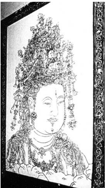
圖一 有一段神秘傳說的男相觀音造像 桂海碑林的男相觀音造像拓本

那觀音的半身造像，是較少見的男性法相。臉上有三眼，蓄著鬚髯，顯得豐腴壯碩。冠飾繁複華麗，披垂著串串瓔珞，流露出異域的風格。陽刻的線條細緻而利落，十分流暢。祂在大約兩人高的石壁上，莊嚴地俯視塵寰。（圖一）