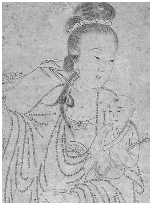
圖一一 明 觀世音菩薩普門品經像 局部 國立故宮博物院藏（送子觀音，是閨閣中的守護神。）

經過了這般曲折的變身歷程，善男子觀音，不但變身爲秀麗溫婉的慈母形象，實質上也成爲世間信徒心靈上的母親。作爲一位母神，既要堅強