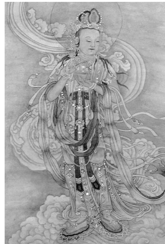
圖四 明 仇英 觀世音菩薩 局部 國立故宮博物院藏 (仇英筆下的觀音，容貌美麗，卻是男性軀體。)

然而，很多人不認同過渡期的說法，因為觀音傳進中土時，就是男相和中性並存的。早期的觀音雕像（圖五）和來自密宗的千手千眼觀音，不少是以中性的法相出現的。 大乘佛教對性別的看法是：「一切諸法無有定相，非男非女：」也就是在佛的世界中，超越了塵世的性別，祂可以隨機顯現男相或女相，所以是亦男亦女，非男非女。而在《法華經·普門品》和《楞嚴經》中，都提到觀音有三十三變化身的願力，爲了弘法，祂可以變換性別和身份。並不需要一個過渡期。