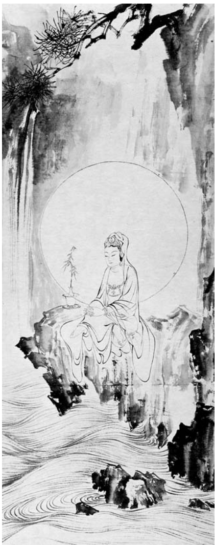
圖八 民國 溥心畬 水月觀音 國立故宮博物院藏

圓月如鏡，蓮花池畔竹影婆娑。觀音閒適地坐在岩石上，通常是左足垂下或盤起，右腳高豎成蹲踞式，右手隨意地搭在膝蓋上，看起來輕鬆自在，神態悠然。這樣淡雅的情景，很