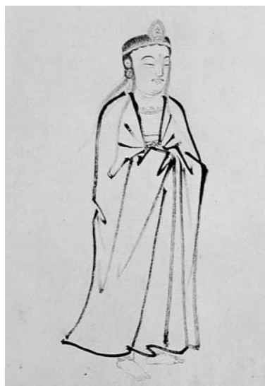
圖二 明 丁雲鵬 大士像 局部 國立故宮博物院藏 (丁雲鵬晚年畫了一冊十六幅觀音大士像。其中八幅為男相，七幅女相，一幅中性，這是十六幅中的四幅。)

音才普遍地以女性形像顯現。自稱為佛弟子的晚明畫家丁雲鵬，七十二歲時畫了一冊十六幅觀音大士像。（圖二）畫法和造型都靈動多變。其中八幅是唇上有髭的善男子；另外八幅，容顏秀麗，已變身為女性造型。但有一幅雖是女子容貌，卻配上男性軀