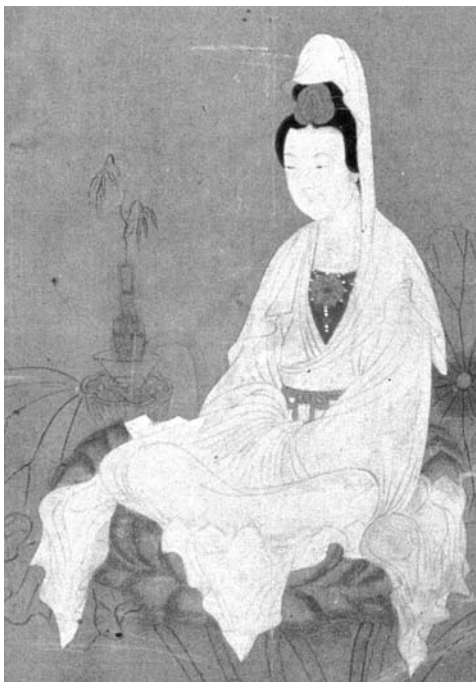
圖一〇 明 仇氏杜陵內史 白衣大士像 局部 國立故宮博物院藏

妙善公主的故事，使中國觀音更為入世。傳說古早時妙莊嚴王的三女兒妙善公主，自小即茹素信佛，長大後父王要為她招駙馬，她卻堅持出家。妙莊嚴王一氣之下，將她逐出王