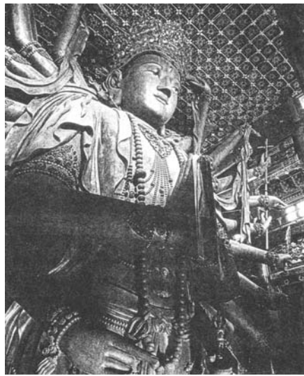
圖六 承德普寧寺大乘之閣的千手千眼木雕觀音 (中國最大的木雕千手千眼觀音。從底座至頂，高二三·七六公尺，法相莊嚴。)

瞪著白森森的眼睛；普樂寺的旭光閣裡，三面十臂的歡喜佛以高難度的姿勢，擁抱著佛母永恆地雙修。 當時大陸旅遊資訊仍然很缺乏，我無法想像大乘之閣裡，中國最大的木雕千手千眼觀音，會帶給我怎樣的驚奇。 一進門只看到巨大的蓮座和懸垂的衣袂。從旁邊的雕花窄門購票步上層層樓梯，朦朧的幽光，隔絕了咫尺外的熙攘人間。轉進了迴廊，乍然抬頭，觀音淡金色的臉逼近眼前，莊嚴平靜的神情，似有若無的微笑，彷彿無限地擴大，十分超現實地籠罩著整個空間。一種微妙的宗教感，把我的心靈帶到明淨空靈的境界。