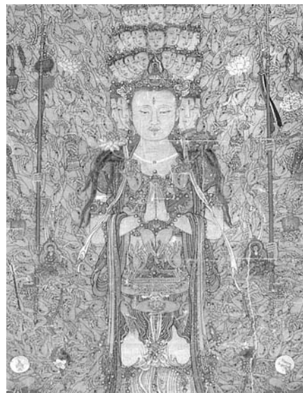
圖七 宋人畫千手千眼觀世音菩薩 局部 國立故宮博物院藏

觀音的容貌如女性般柔美，微微俯首，面部的三眼象徵明察過去、現在和未來。男性的身軀披掛著天竺風味的衣飾。除了胸前合什的雙手，還有四十隻手，手心各有一眼，每隻手分別持著日、月、武器、蓮花、楊柳和法器。四十隻手、眼乘以佛教經義中的二十五有（三界二十五因果報應），正好就是千手千眼。（圖六） 當然，也有些千手千眼觀音造像，以非常精密繁複的手法，把一千隻手和眼全部完整地顯現。（圖七） 千手千眼觀音來自密宗。傳說觀世音初修道時，曾發願要使眾生都解脫生死輪迴，只要有一人無法解脫，他絕不成佛；如果違背了這誓言，頭顱將碎裂成千片。