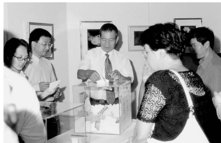
現場來賓自投票箱抽出「好彩頭獎」

亦可得「國之重寶」一冊。另於頒獎典禮當天，邀請現場觀眾自投票箱抽出二百名「好彩頭獎」，每名致贈「造型與美感」一冊，參與摸彩的民眾也獲贈一份精美禮品。其實每件參賽作品，都是作者嘔心之作。惟經過兩萬多名觀眾，公開