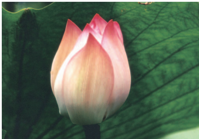
「夏荷」 許銘仁先生作品