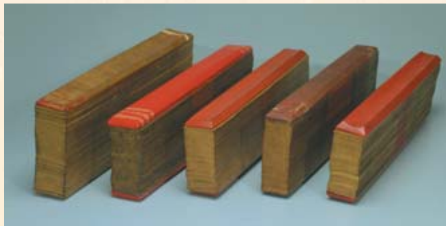
清淨道論讀本 貝葉經

興建分院計畫，就不再只是單純的故宮分身或翻版，而是另具特色，以亞洲文物為發展方向的分院，預定在二〇〇八年興建完成。 發現民間的潛力 當國立故宮博物院積極籌劃南部分院，開始徵選分院地址時，即有學者質疑道：「故宮南部分院將以亞洲文物為主，要發展方向，而不是單純的故宮翻版，這是不錯的理想，但是有足夠的亞洲文物應付開館嗎？是否會造成徒有硬體（建築），而缺乏軟體（展品）？」 這項顧慮，亦是籌備小組曾考慮到的一個問題，因為目前國內公私收藏缺少亞洲文物是個事實，國