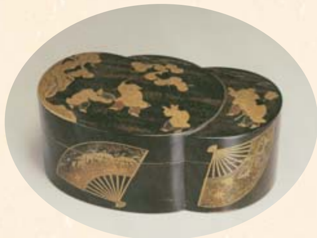
時繪雙桃盒 國立故宮博物院藏