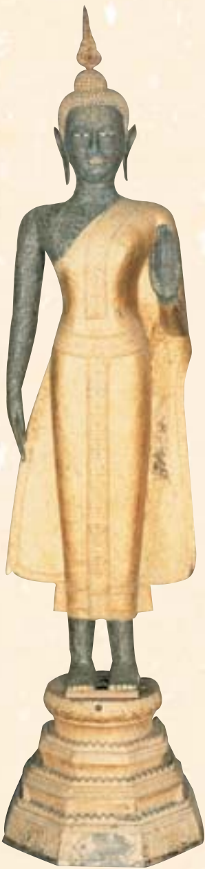
泰國 釋迦牟尼佛像