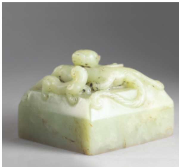
清 乾隆 青玉「五福五代堂古稀天子寶」璽 印面6.2×6.2公分 高4.75公分