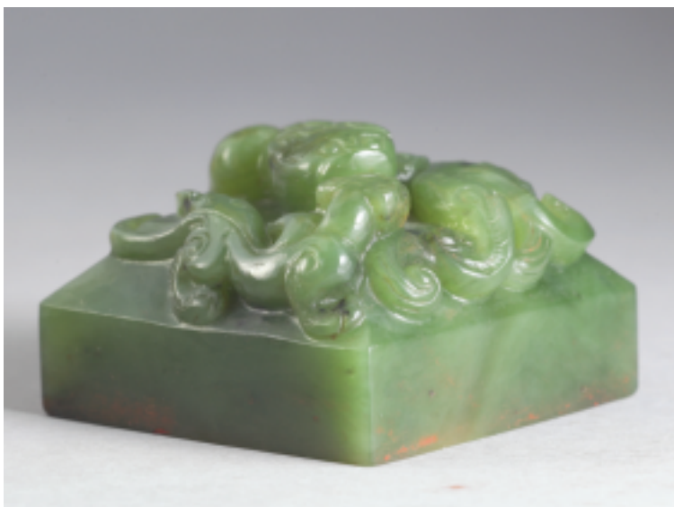
清 乾隆 青玉「八徵耄念之寶」璽 印面6.3×6.3公分 高4.8公分

打開皇帝的百寶箱，有他號令天下的玉璽大章、有他品題書畫的賞玩圖記。同一個句子，重複刻製多枚，放置在各個齋堂、宮殿、行館，供他隨時取用。乾隆皇帝在器物 and 書畫上數不清的「違章建築」，就是這樣「蓋」出來的。