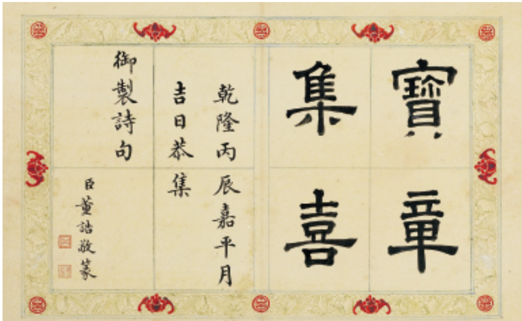
清 乾隆 壽山石「寶章集喜」印譜 題署 單頁18.6x14.6公分