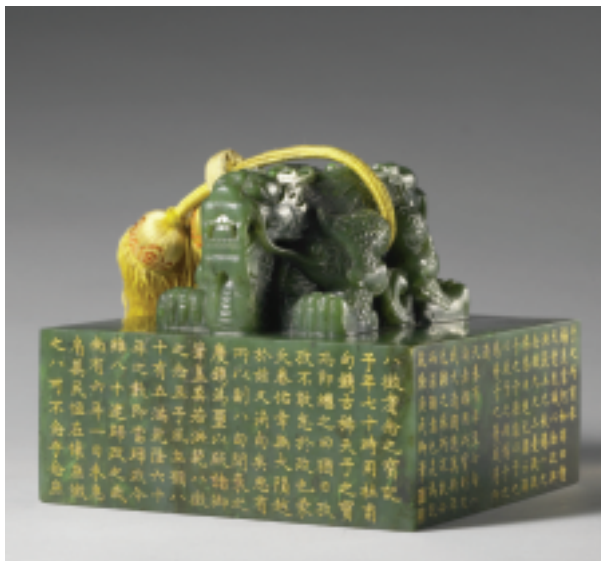
清 乾隆 碧玉「八徵耄念之寶」璽 印面4.15×4.15公分 高3.0公分