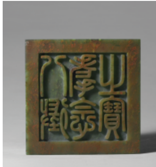
清 乾隆 碧玉「八徵耄念之寶」璽 印面4.15×4.15公分 高3.0公分