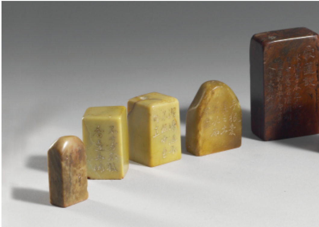
明 文彭刻款 壽山石「愛蓮說」組印十一方

故宮收藏的印章，在展出品之外，還有「金薤留珍」、「避暑山莊」和「守官遺范」等共一千餘方的歷代古銅官私印；有清帝集古玉印「六文蘊古」、「虹文蒼古」、「籀斯秘寶」、「集成契賞」百餘方；有乾隆命篆集刻的「璿璣仙藻」等八十餘印及明代的盜印等。另外，故宮來台後，有許多收藏家和藝術家捐贈的印章，如張大千、溥心畬、王壯為、譚伯羽兄弟等人所捐的近現代篆刻作品數百方，由這些印章，我們可以看出從璽印到流派篆刻的一些演變。謹在此預告「故宮璽印篆刻展」的珍品，一起期待來日有更完整的呈現。