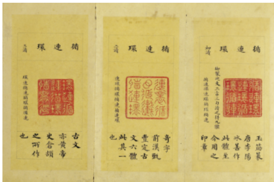
清 乾隆 田黃石「鸞錦雲章·循連環」印譜 單頁23x11公分