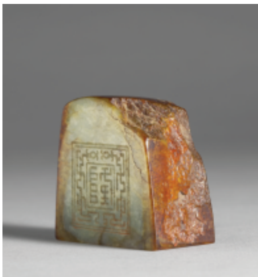
清 乾隆 青玉「五福五代堂古稀天子寶」璽 印面2.7×4.9公分 高4.8公分