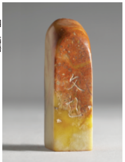
明 文彭刻款 壽山石「愛蓮說」組印十一方之一 印面2.0x2.0公分 高6.4公分