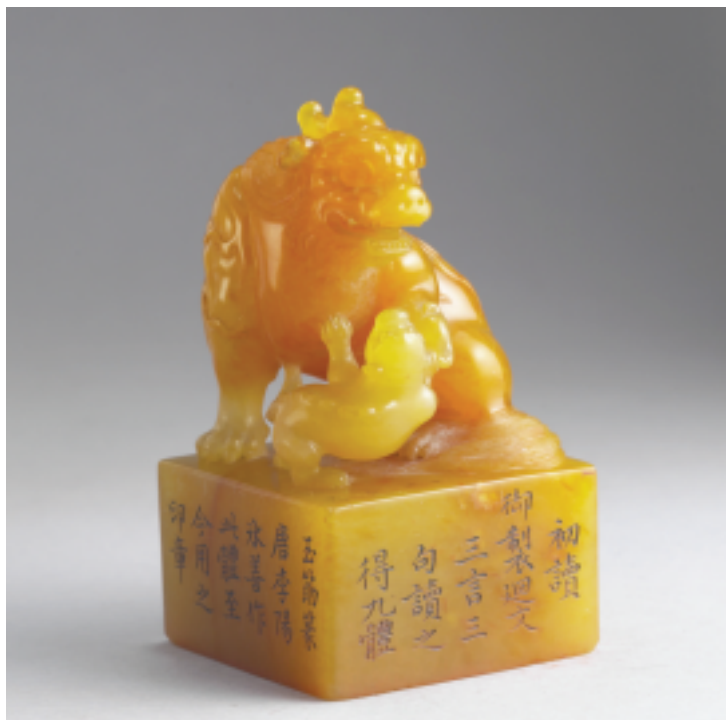
清 乾隆 田黃石「鸞錦雲章·循連環」組印九方之一 印面4.7×4.7公分 高8.3公分