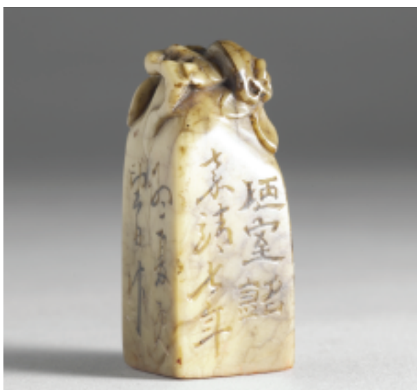
明文彭刻款 壽山石「銘篆兼珍—陋室銘」組印十二方之一 印面2.3x2.3公分高5.6公分

「愛蓮說」和「銘篆兼珍——陋室銘」是皇帝集明人文彭刻款的篆刻作品，明清以來的文人篆刻向以「文彭」、「何震」為開山祖師，名氣當然很大，這兩組套印所刻的文句很美，印文布局的變化也不少，但其邊款和印文線條，卻與傳世僅數方的所謂「文彭印風」不盡相同，由此可見當時慕古風潮下的篆刻風尚，以及清朝皇帝收印的眼光。