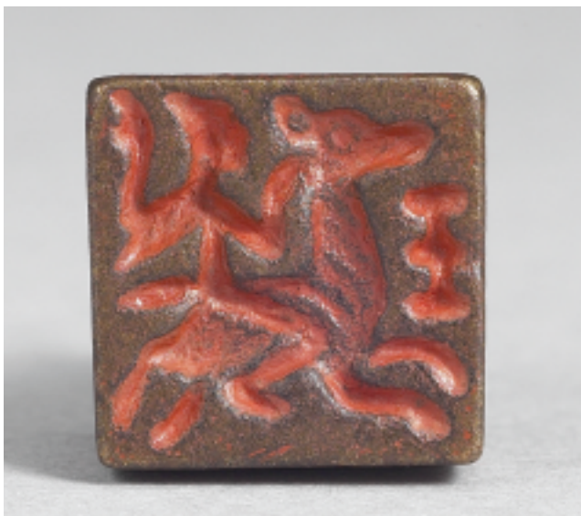
漢 銅印「王」騎馬人物畫像 清 毓慶宮 集歷代古銅印一百枚之一

「寶章集喜」是集乾隆御製詩中有「喜」字的詩句刻成的，印石、印鈕、印文、印篆，與「鴛錦雲章」一樣，也是「四絕」。印譜有「蝠（福）」、「喜」朱紅套色，極為精美，又是一絕。