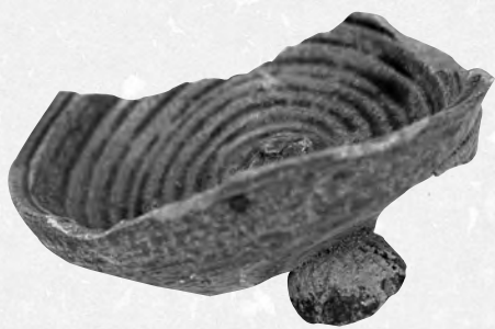
圖三 Y2掘步嶺窯址採集的墊珠窯具黏在疊燒的產品上

種釉色呈褐黑色等產品的出現，是這一時期古窯業的主要特點之一。我們除發現了一些釉層較薄的褐黑色產品以外，還發現了一些釉質較厚呈青綠色、有些部位呈黑褐色的原始瓷產品。筆者在這些產品的底部和邊緣處、或一些結釉較厚的地方，均發現了其釉色已呈青褐或褐黑色的現象。雖然這種釉色變深現象是由於受釉層厚度的變化而變化的，但它除了可以給窯工們以更多的啓發以外，也說明了原始黑釉處在初始時期的萌芽狀態的一種狀況。觀察發現，這一時期的原始瓷釉色已呈現多種顏色，主要有：黃、淡黃、綠、青褐、褐黑等數種，而且在釉層的厚薄上也有了明顯的區分。有些厚釉產品常見有微凸的釉斑狀，可稱為乳濁釉。這無疑說明，當時的窯工已掌握了多種釉料配方技術。但筆者則認為，這些原始瓷釉質釉色呈多樣化的現象，可能也說明了當時窯工對釉料特性的掌握尚不夠全面所致。一些胎質較酥鬆、稍厚，胎色呈灰白、灰黃、且略帶有吸水性的產品，多數在器物的內外均施了釉，但也有少數是內壁不施釉的。這類產品的形狀均不夠規整，從其內壁處可看出是用泥條盤築法成型的。一些胎較堅致、稍薄，胎色呈灰、灰褐、基本不吸水的產品，大多產品也均內外施釉，但也有少數僅在表面施釉的產品。這類產品的器型均比較規整，應已採用拉坯成型法。從時代上分析，前一類產品應早於後一類產品。除此，一些不僅較大而且胎較厚、超過一厘米的碎瓷片的發現，說明當時，還生產一