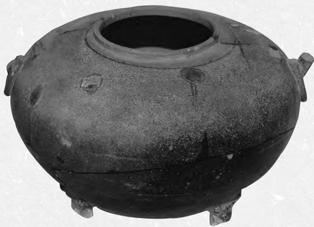
圖二 德清出土的戰國時期原始瓷甌

(二)、在窯具的使用上，主要表現在共同使用一種泥質墊珠及形狀大小相同的小石子墊珠作為疊燒間隔物現象，這些窯具在這一時期的許多窯址中多少均有所發現，部分墊珠的一面向內有一凹穴，直徑為二厘米左右。這種窯具的使用方法，是這一時期窯具類型上較為特殊