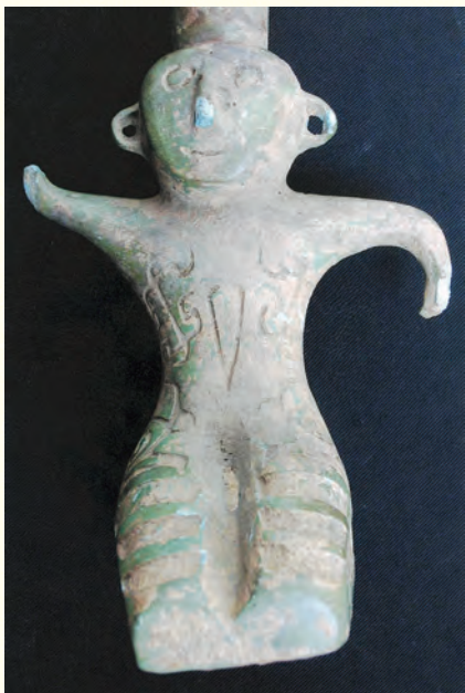
圖五 德清縣龍山出土的青銅器「權杖」杖墩

浙北東苕溪沿線古窯址的分布，除黃梅山窯址以外，其他窯址均分布在德清縣的城關、洛舍、龍山、二都等中部地區。吳興與德清二地春秋時為吳、越二國的交界地，其地理位置十分重要。由於戰爭等方面因素，春秋時期這裡兩國的邊界往往存有諸多不確定的因素。二〇〇三年四月的初春期間，德清縣洛舍龍山一帶出土了一件越文化青銅禮器「權杖」（圖五）。權杖是一種古老的原始權力之象徵，也是一種比較典型的越文化傳統器物。研究表明，這件權杖應是當時越國一部落首領所佩帶的最高級別青銅禮器。經專家鑒定後認為，權杖的時代應在春秋中期左右。這無疑給我們提供了春秋時期這一帶屬越國勢力範圍的有力證據。