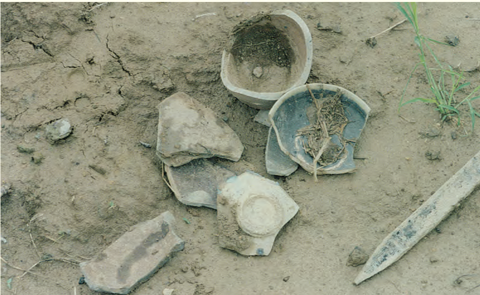
Y40窯址現場發現的碎片狀況 時代：唐