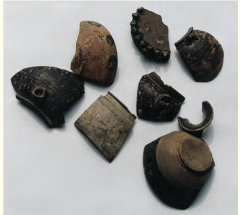
Y30採集到的點彩、褐黑釉等碎片 時代：唐