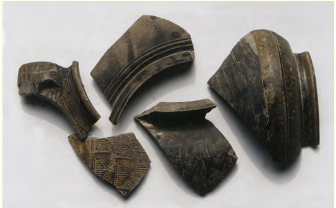
Y14採集到的青、黃褐色釉碎片 時代：東漢