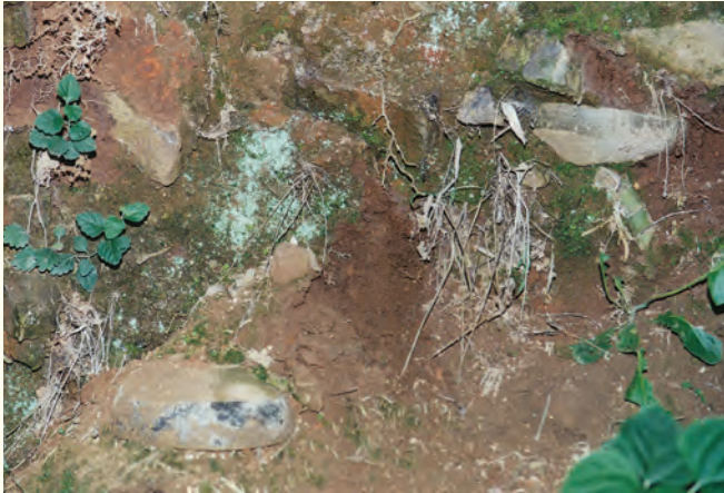
Y32窯床斷面的青、黑釉產品碎片堆積狀況 時代：唐