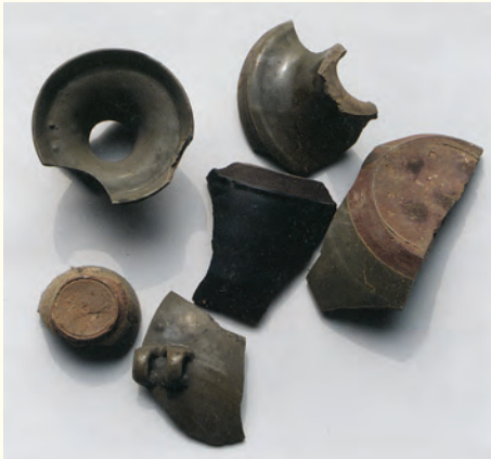
Y21採集到的青釉、黑釉產品碎片 時代：東漢—南朝