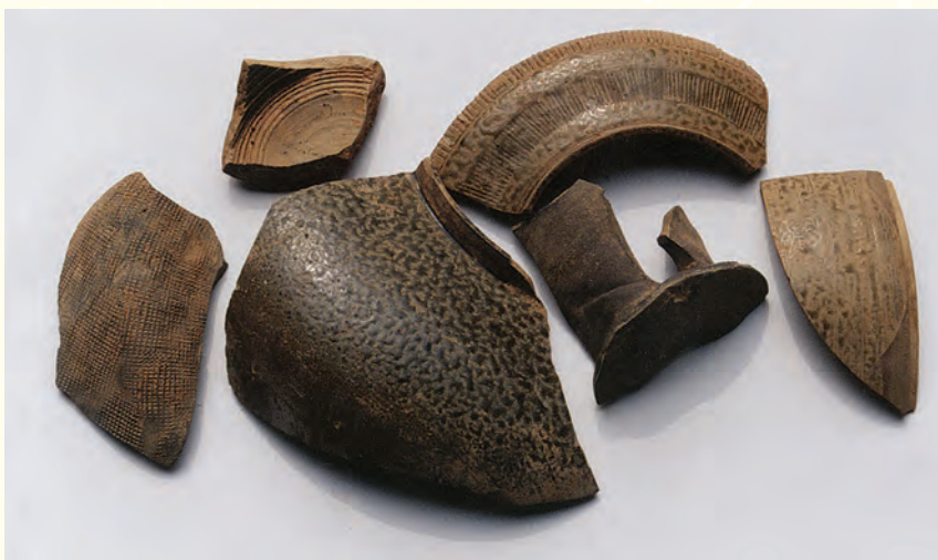
圖九 Y2、Y6窯址採集到的部份褐、黃、青綠、黑等釉色的瓷片 時代西周至春秋戰國