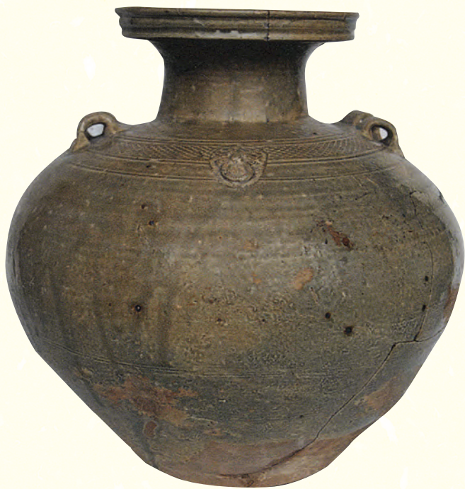
圖四 德清出土的二晉時期青瓷盤口壺

色，如：盤口壺、罐等，其中產品碗等的胎呈深灰色，且非常堅致，敲之能發出清脆的叮噠聲，可見其燒成溫度是很高的。產品中碗的器型，外底凸出呈一假圈足，這很明顯和前期漢六朝、及早期的原始瓷碗的器型很接近。這一時期產品的器型主要有：雞首壺、盤口壺、敞口壺、碗、碟、罐、盤、高足盤等。在施釉方面，這一時期的產品一般內外均施半截釉且不及底的為多數，有的將釉僅施在器物的內處口沿一節，以產品碗最為明顯。釉色方面，青釉器釉色呈青略帶黃、黑釉器色黑如漆且釉層較厚，光澤度較好，顯示了東晉至南北朝時期的地方移風。在青釉器產品中還出現了一種黑褐色點彩裝飾。在窯具的品種方面，隋唐時期的八座窯址，竟有七座均採用了和早期Y1黃梅山、Y2掘步嶺等原始瓷窯址相同的墊珠窯具。Y 28窯墩山窯址已經浙江省文物考古研究所發掘，結果發現有四條龍窯疊壓在一起，最寬的一條竟然達到了四米，其延續時間之長、產量之大應是可想而知的。同時發現了許多墊珠形窯具。這些久別重逢的類型和使用方法相同的墊珠形窯具，雖然它們在時間上已相隔甚遠，但不難看出之間應是一種地方傳統的淵源關係。不難想像當初許多被廢棄了的前期窯址，其堆積比起現在來自然會豐厚得多，這些便可以給窯工們以更多的啓發，另外還可以通過世代窯工們的言傳身教。其他的窯具主要發現有：筒形墊座、圈足形墊座、孟形墊座、墊餅等。這一時期的產品，如碗等的胎尚比較厚