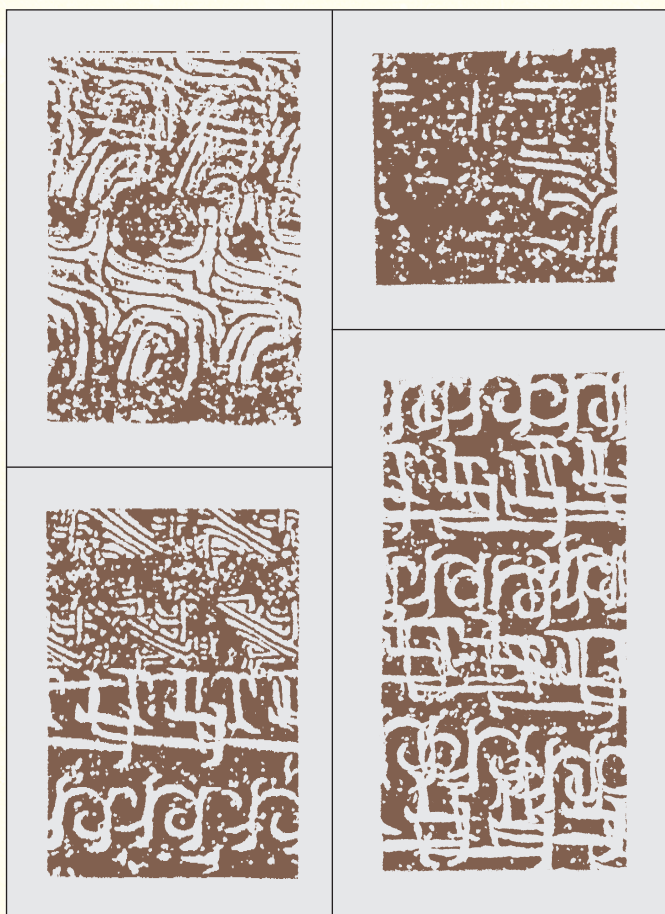
圖六 德清縣皇墳堆出土的部份原始瓷器紋飾拓片