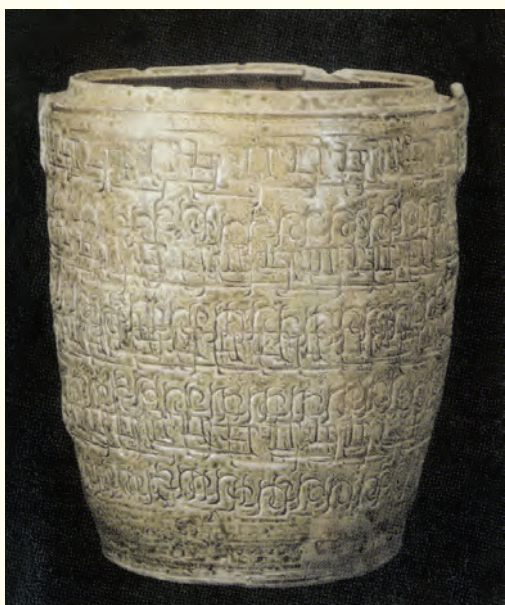
圖八 「皇墳堆」出土的原始青瓷筒腹罐

得略為落後。因此，可以將這批器物的時代確定在上限為西周、下至春秋時期（註一一）。綜上所述，「皇墳堆」出土的這批器物應是本地窯址所產無疑。根據前幾次的普查資料記錄，本文在介紹和描述原始瓷窯址遺存時，將一些胎較厚且較大、表面飾有雲紋等的原始瓷產品稱為「甬鐘類」器物可能有別，它們可能是一種和「皇墳堆」出土器物大致相同的產品類型，或可以稱作筒形器、筒腹罐等。（圖七、圖八）