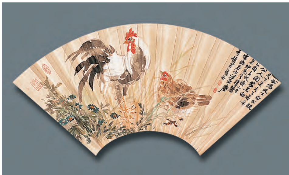
民國 汪亞塵 雙雞及徵仲詩 扇面