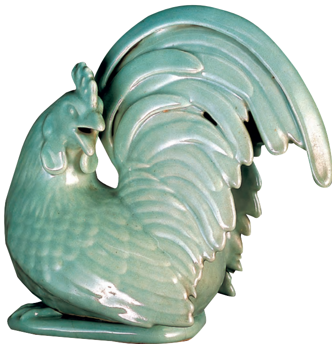
清 景德鎮仿龍泉青瓷雞形香薰