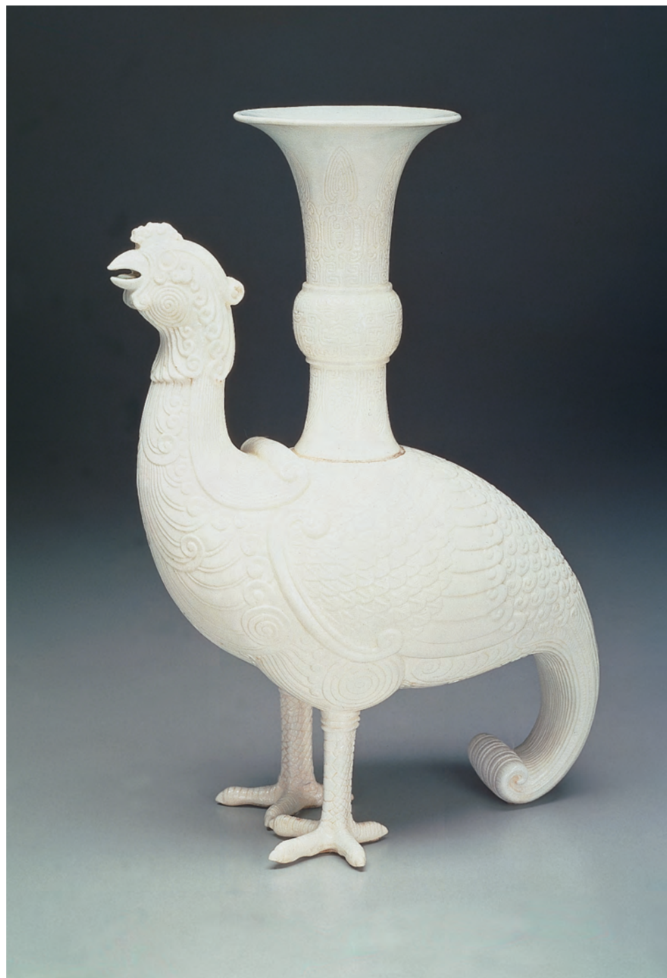
明晚期 景德鎮 瑩白天雞尊