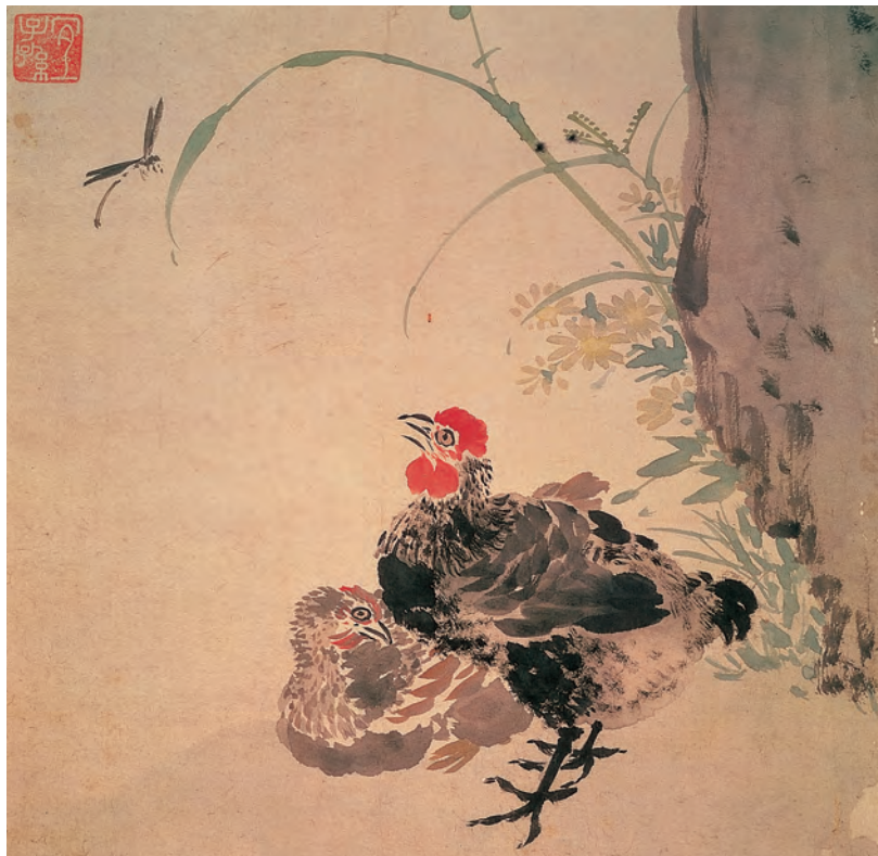
明 陸治 雙雞圖 軸