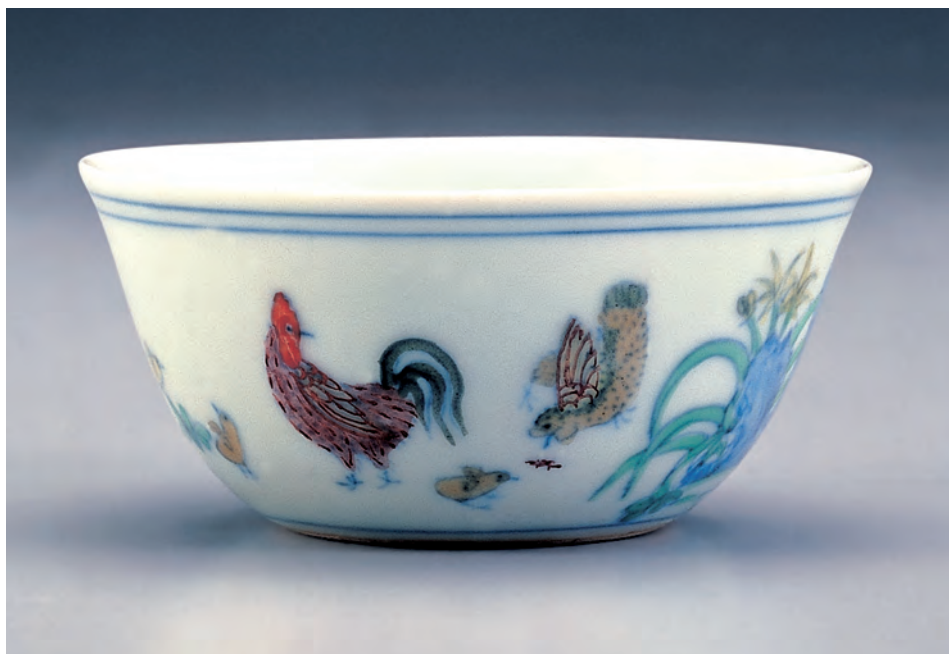
明 成化 鬥彩雞缸盃