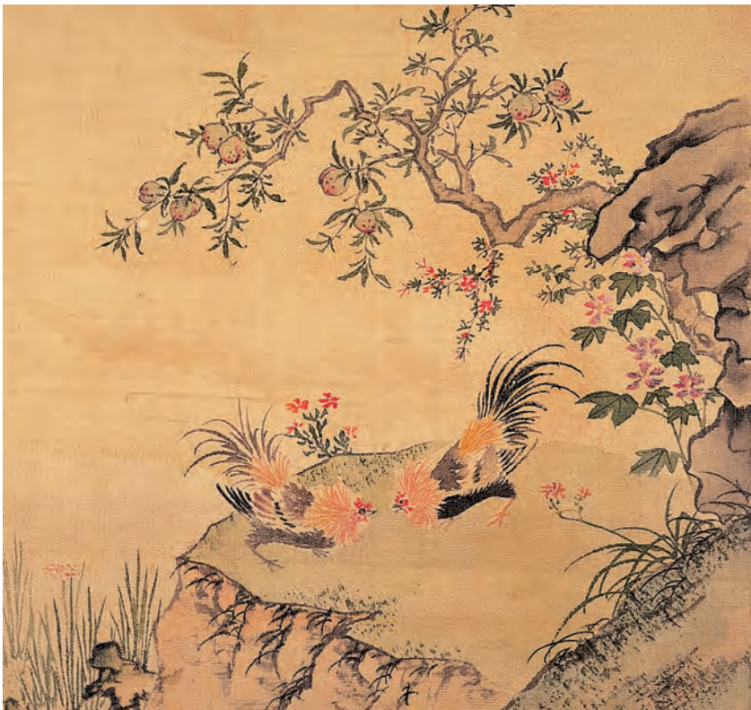
明 周之冕 榴實雙雞 冊