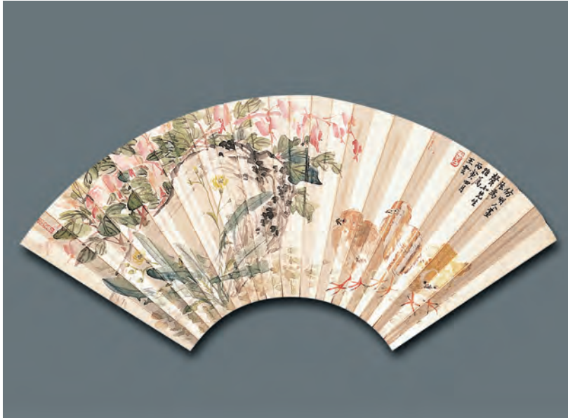
民國 王雲 花鳥 扇面