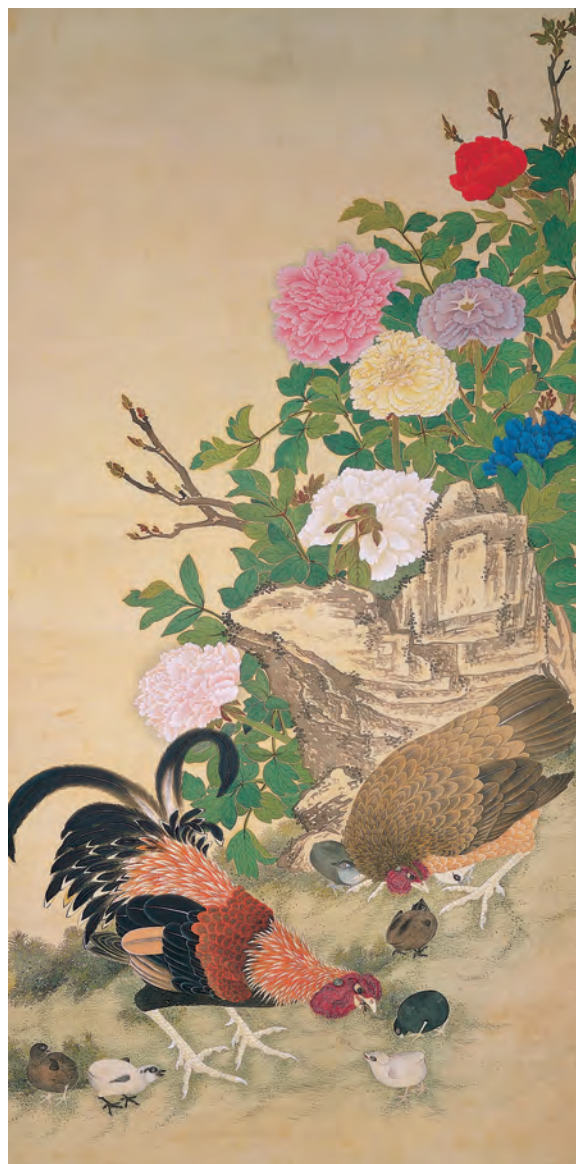
無名氏畫富貴吉慶圖 軸