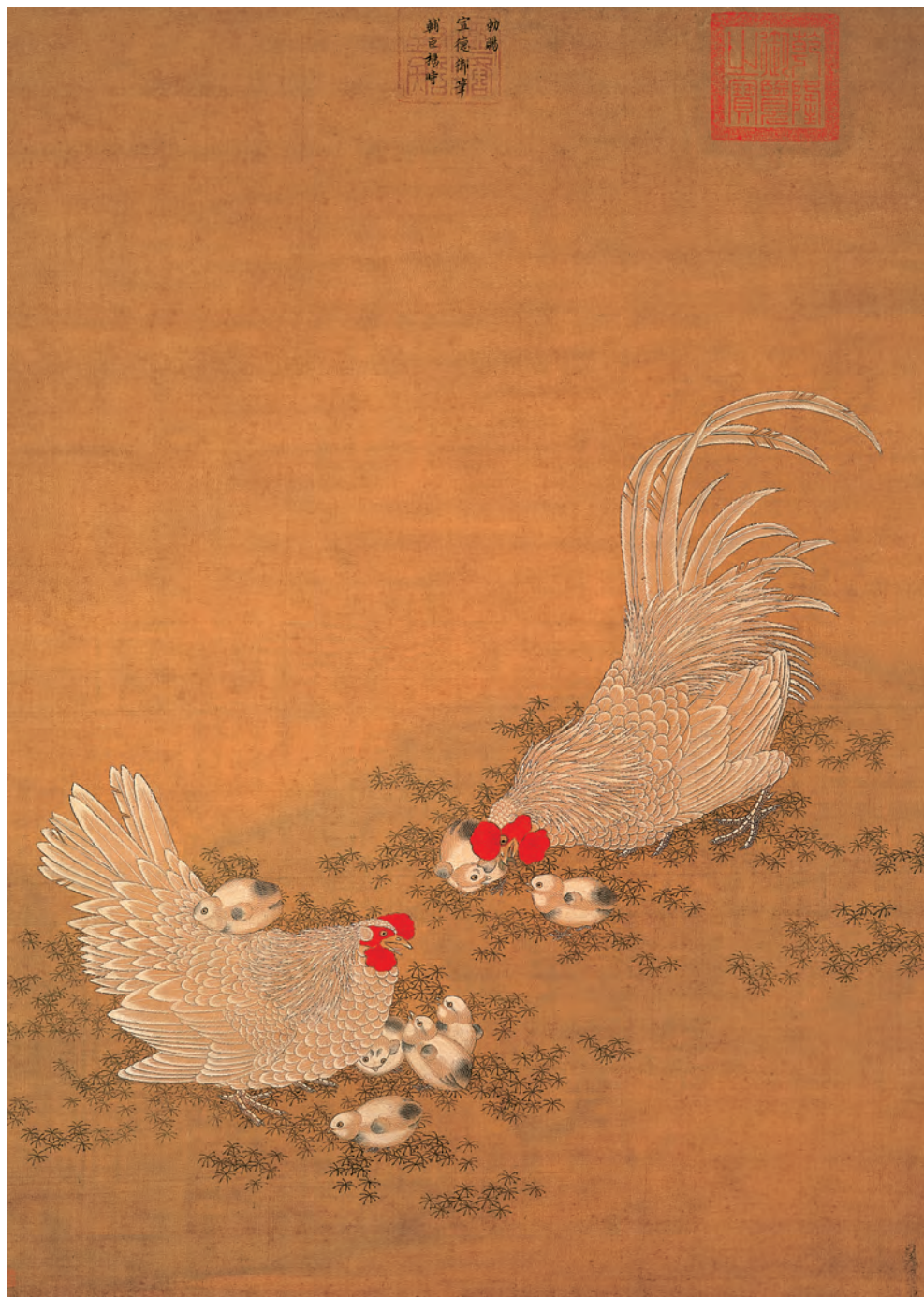
明 宣宗 畫子母雞圖 軸