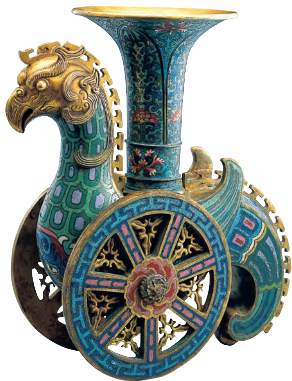
清 掐絲琺瑯天雞尊