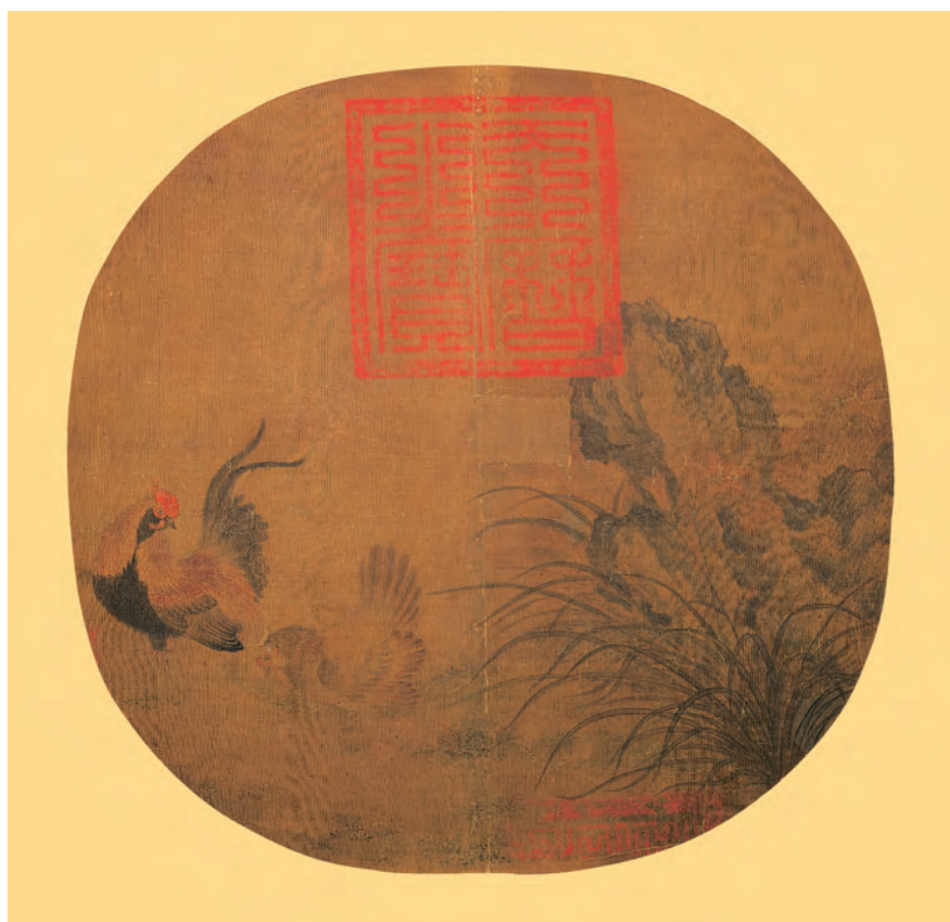
無款高冠柱石 紈扇畫冊