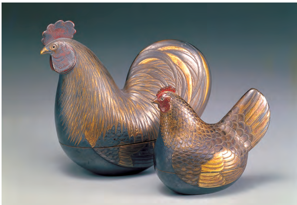
清 時繪雞形盒一對