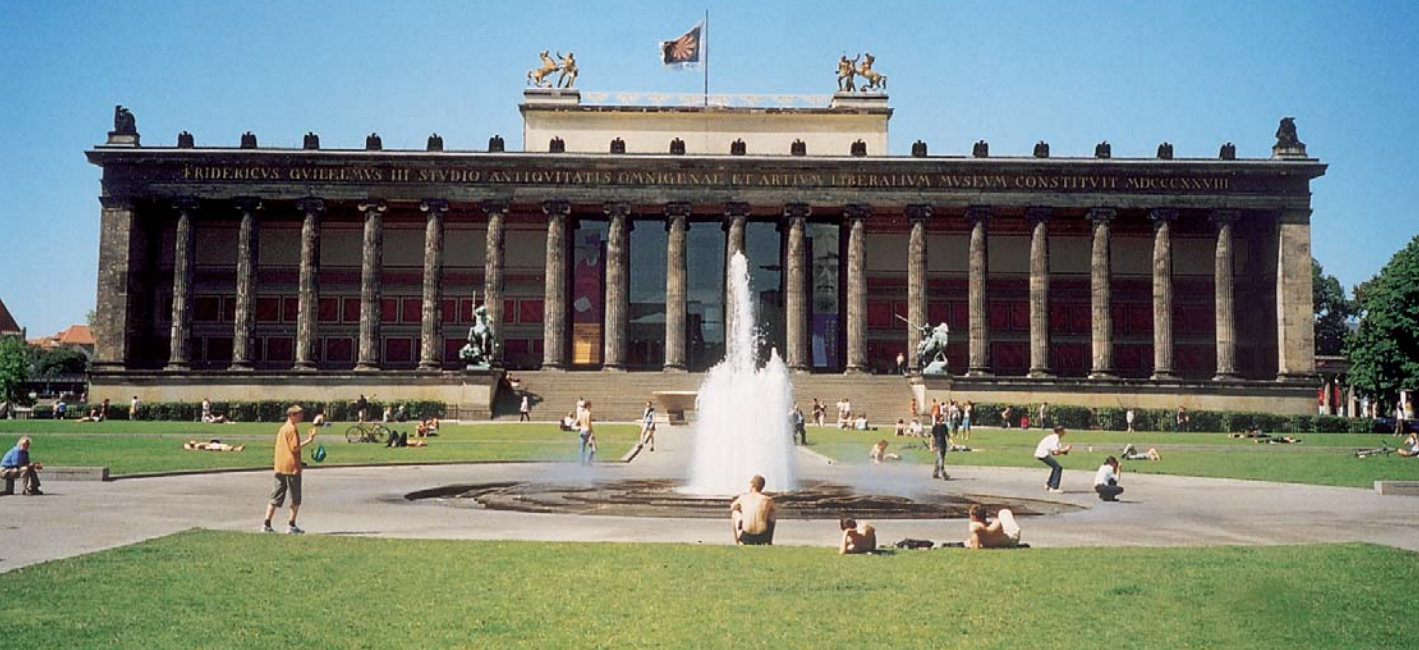
二〇〇三年，「天子之寶」柏林首展場地—老博物館。

法扣押的保障以外，其所涉及的相關事物層面是非常複雜而廣泛的。以下僅舉其犖犖大者，就關於評估借展單位、文物出借和文物保險等三項考量，略作說明。