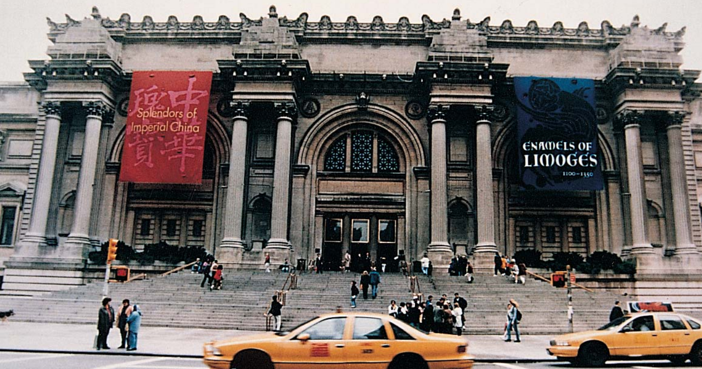
一九九六年，紐約大都會博物館「中華瑰寶」展覽，門首標題。