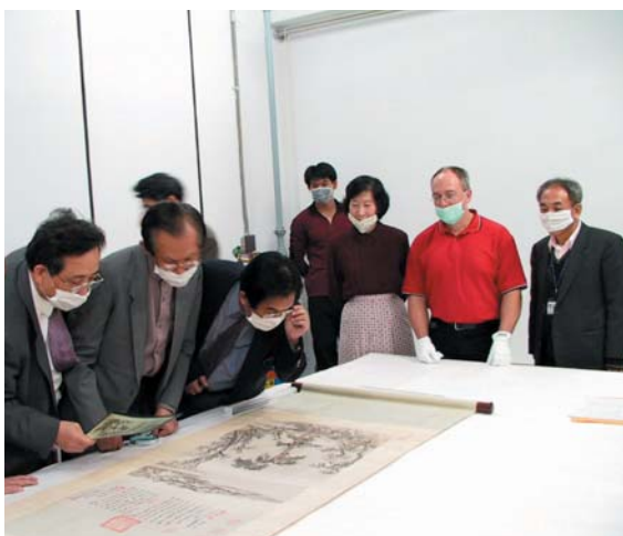
故宮文物出國前及回國後，都要接受教育部審查小組審視每件借展品狀況。

法、德三國之例，說明其所涉及的免司法扣押保證、借展單位評估、借展文物狀況及保險措施等前提考量，於此可以想見故宮文物出國之總體圓滿成功，一定要動員故宮與借展單位雙方所有相關從業人力，以縝密之規劃和循序作業之合作，才有以致之。