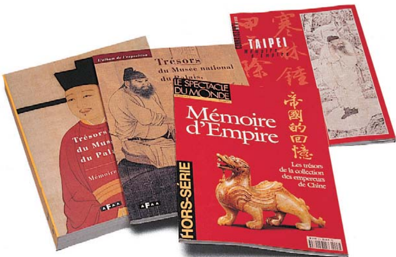
法方專為「帝國的回憶」展出的各種展覽圖錄。