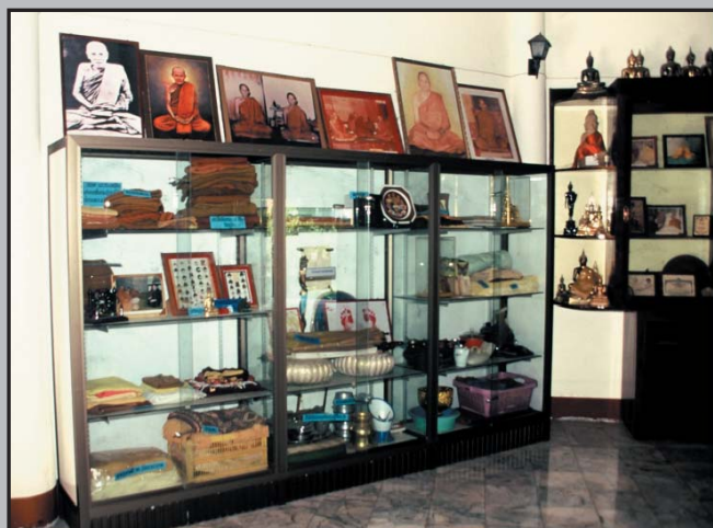
圖六-a、b 加堡德提到所謂的The Stupa-Museum（佛塔博物館），為泰國當代佛寺發展新趨勢，將博物館的概念與佛塔結合，寺廟還兼具了博物館的一些功能，收藏並展示地方考古遺物、聖僧寫實圖像、舍利以及有關的聖物等。