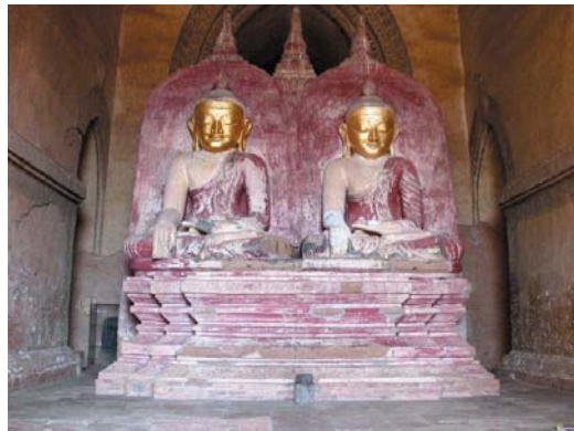
圖七-a、b 緬甸Pagan附近一座佛教寺廟（Dhammayangyi）遺址以及寺內保存的佛像，史坦那提供。史坦那在演講中介紹了國際團隊在緬甸最新的考古情報。

Vat Phou及Vientiane等地，顯示在前吳哥時期，寮國南部地區已有佛教信仰的存在；不過目前的考古資料還不足以鋪陳清楚的後續發展。一直到十五世紀湄公河流域，才又看到較多的佛教遺跡，分佈在連外通道上。由此我們可看到羅希拉德以寮國近年來發現的考古遺跡為基礎，企圖重建寮國佛教的源流、傳布、融合以及演變等複雜歷史過程的努力。