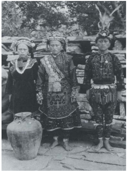
圖四 轉引自涉谷區立松濤美術館，《台灣高砂族一服飾—瀨川孝吉收集—》（東京，1983），頁74。

考古及文獻，來肯定他過去對台灣在十六、十七世紀作為貿易轉運站的推論。此外他也提醒研究者應該用亞洲甚至更寬廣的觀點來出發，才能充分了解當時東亞貿易的整體情況。現任