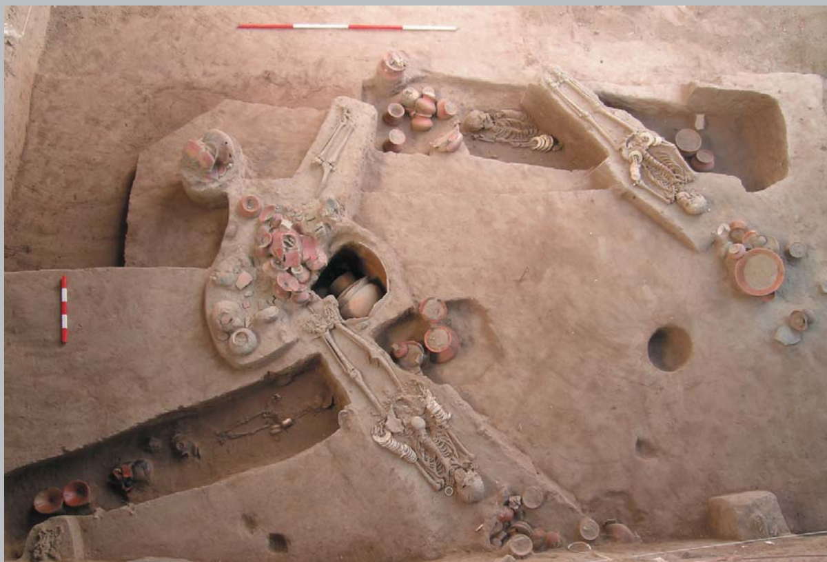
圖三 泰國東北部Ban Non Wat青銅時代墓葬遺址。此墓於2005年二月發掘，時代約為西元前一千年左右，墓中出土豐富的陪葬品，包括精美的彩陶、青銅器，以及貝殼與外來大理石所製的飾品。

次的研習會；第二階段會在二〇〇六年年底移師到東南亞舉辦研習與考察活動，第三階段將於二〇〇七年底在故宮舉行大型國際研討會。（圖二）