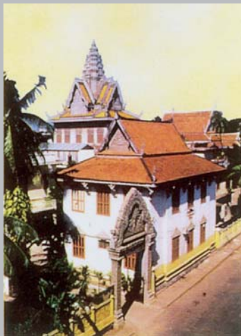
圖二-a 法國遠東學院博物館（此建築現已不存），河內，1933。法國遠東學院的創始，要上溯到1898年法國金石銘文學院發起設置的常駐印度支那考古團。1900年正式定名為法國遠東學院；最初的院址原設於越南西貢，之後不久即遷至河內。該院最初的使命是從事考古勘察、搜集抄本、保護古建物、研究法屬印度支那地區的語言文化遺跡，此外還要促進從印度到日本所有亞洲文明的歷史研究。