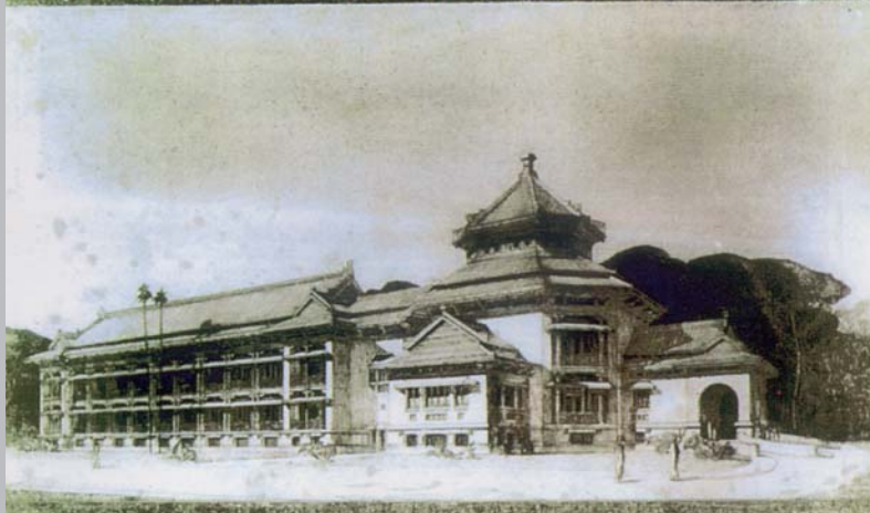
MUSEE DE L'ÉCOLE FRANÇAISE D'EXTREME ORIENT Façade perspective vue du Fleuve Rouge HANOI

此認識當時的副院長石守謙，加堡德得知故宮南部分院的計畫後，提出雙方交流合作的構想，建議藉由法國遠東學院在東南亞地區深耕一個世紀以上的經驗來協助，推動台灣方面對於