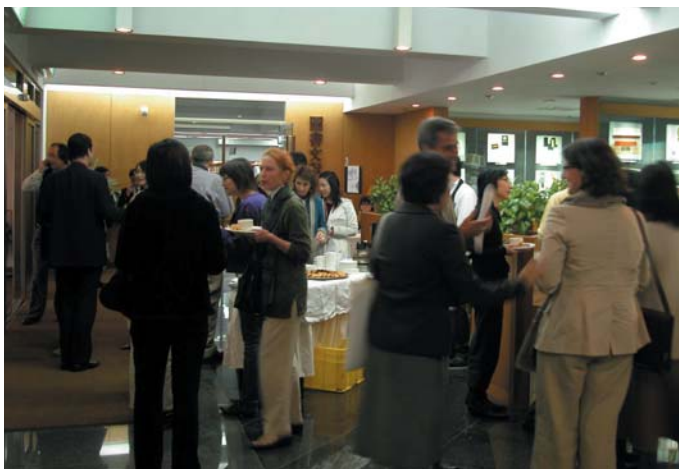
圖十 與會者於中場茶會時間亦把握機會交流。

流，尤其是接觸到中國古文獻對東南亞的歷史記載，藉由國內學者的發表，使他們可以從中得知中國與東南亞藝術的關係，所以此次的合作是互益且愉快的。 總結此研習會除了學術上交流的意義之外，還標示著故宮博物院的東南亞藝術文化研究在台灣踏出重要的一步，而與這些分布在世界各地學者們持續的聯絡與交流，也為這個領域在台灣的未来種下重要的根基。