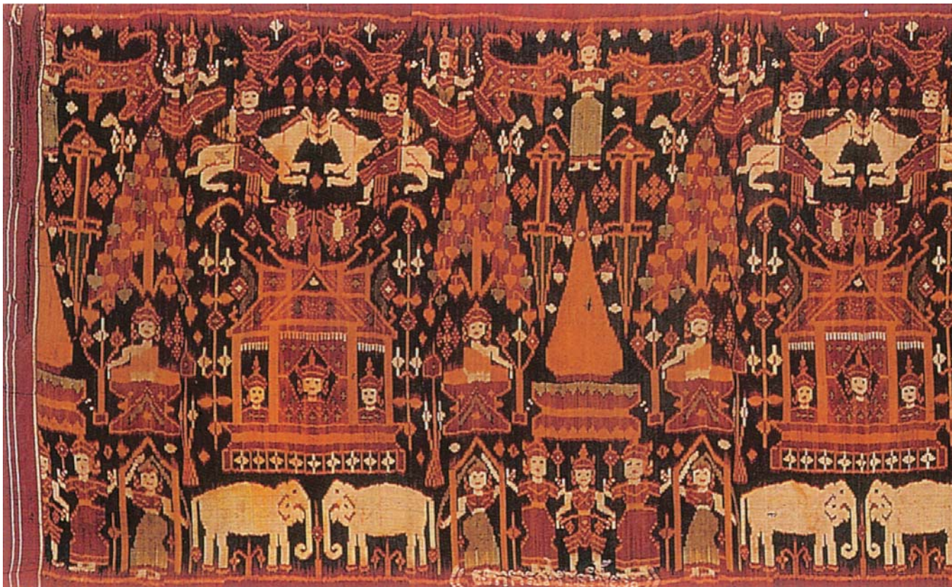
圖九 「毘輸安咄囉太子本生故事」掛飾，163×82公分。絲織斜紋布、綁染技法。中央部份描繪本生故事中的幾個主要角色：毘輸安咄囉太子(Vessantara Jataka)、太子妃(Madhi)與小孩、白馬、大象；另外還描繪了釋尊生平的兩個場景：菩提樹下沉思與度拉尼(Durani)女神；佛塔則暗示佛陀的涅槃。一系列柬埔寨文則出現在此件織品的下方。（轉引自Gillian Green, Traditional Textile of Cambodia Cultural Threads and Material Heritage , pl.251）

流，尤其是接觸到中國古文獻對東南亞的歷史記載，藉由國內學者的發表，使他們可以從中得知中國與東南亞藝術的關係，所以此次的合作是互益且愉快的。 總結此研習會除了學術上交流的意義之外，還標示著故宮博物院的東南亞藝術文化研究在台灣踏出重要的一步，而與這些分布在世界各地學者們持續的聯絡與交流，也為這個領域在台灣的未来種下重要的根基。