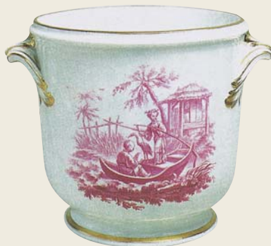
圖一四 凡塞那窯 淡紅彩描金泛舟人物圖鉢（軟瓷） 1750 法國國立塞弗爾陶瓷美術館藏 此畫傳依據布雪作品所繪