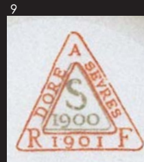
圖十六茶杯底款 1901年