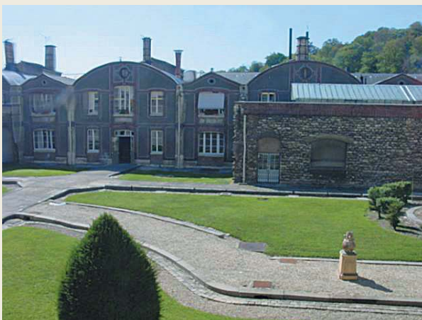
圖三 法國國立塞弗爾製瓷館廠房

一七五六年皇家製瓷廠成立五年後，窯廠從凡塞那遷移至巴黎西南方近郊的塞弗爾（Port de Sévers，圖三），也就是現在巴黎地鐵九號線的終點站，此處距離凡爾賽宮及蓬芭度夫人的宅邸不遠，而據說這也是蓬芭度