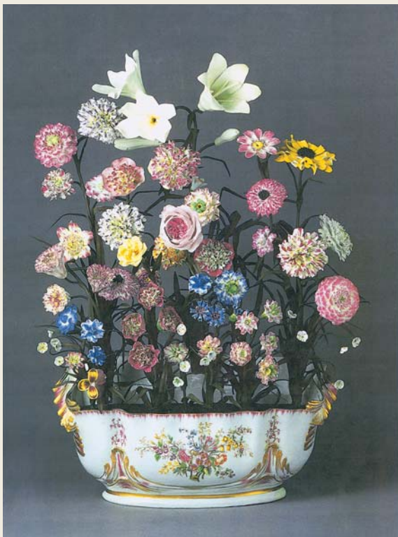
圖一 凡塞那窯 磁彩瓷花與瓷鉢 (軟瓷) 一七五〇—一七五二 法國國立塞弗爾陶瓷美術館藏

得上「軟瓷」(Soft-paste porcelain) 或「擬似瓷器」，是一種陶土混合玻璃粉末原料低溫燒成的，其與中國、日本或德國邁森窯以長石混合瓷土 (高嶺土) 高溫燒成的「硬瓷」(Hard-paste porcelain) 有所不同。無論硬質或軟質瓷器，未施釉燒成後的素胎，其胎地皆潔白細膩，但硬度不同，使用瓷土者硬度高，不容易受到刮傷擦痕，敲擊後則發出清脆的金屬響聲，而非瓷土的軟瓷則易遭刮傷，敲擊聲音則顯得低沉。