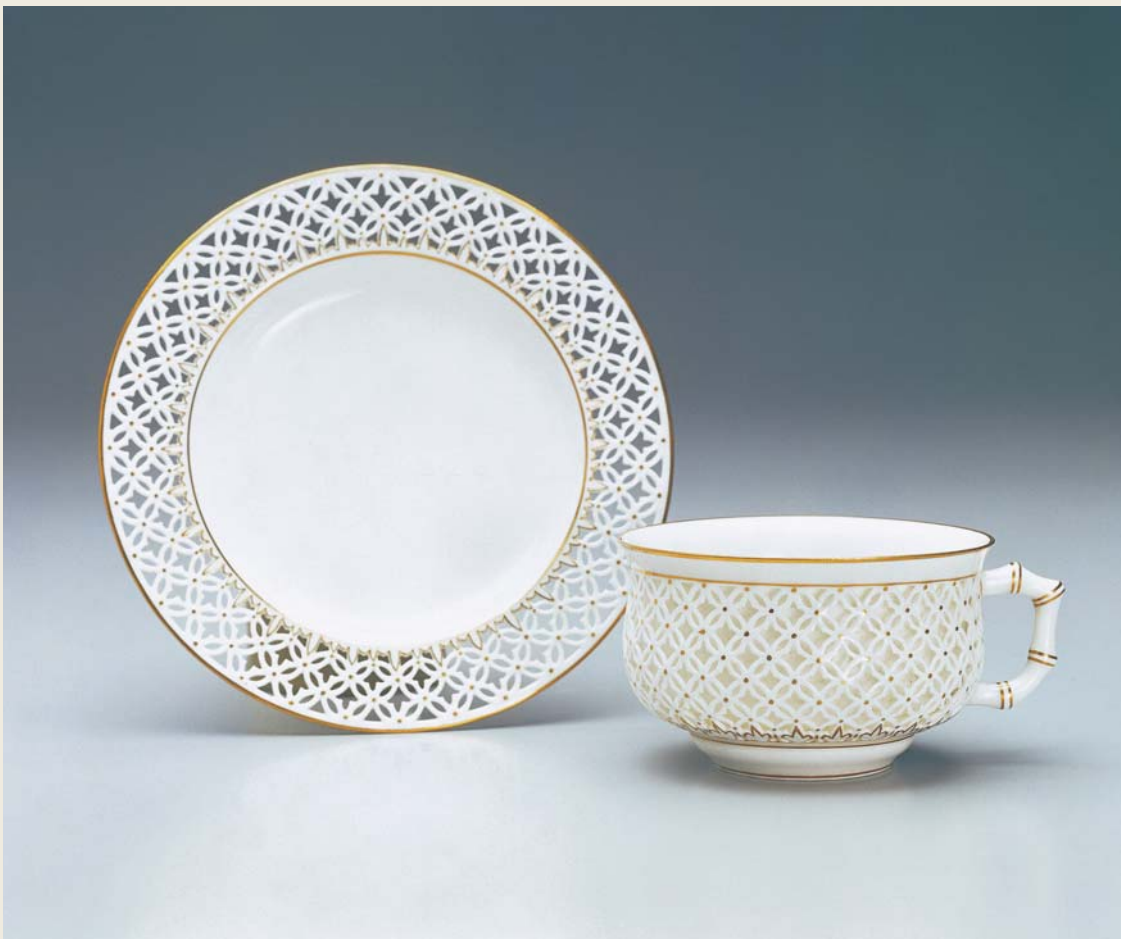
圖一六 塞弗爾窯 白瓷描金鏤空雕花帶托茶杯 1901 國立故宮博物院藏

這幾件茶器除白瓷描金鏤空雕花帶托茶杯（圖一六）為十九世紀末、二十世紀初（一九〇〇～一九〇二）製品外，餘均為十八世紀後半期製作，皆屬軟質瓷器，胎地乳白，透光性較強。白瓷描金折枝花卉蓋罐因款識內有「ff」的記號，其製作年代為一七八三年（圖一九、圖表5），另二件藍地描金五彩茶碟，花籃紋飾者為一七七六年（圖一七右、圖表4）、箭矛紋飾（圖一八左、圖表6）則為一七八六年；另二件白地琺瑯彩花卉單把杯的製作年代也是一七八六年（圖一七左、一八右、圖表7、8），惟令人不解的是單把杯的紋飾與茶碟並不成套。這二組杯碟在故宮的典藏號皆屬「列」字號，它們與其他國立故宮博物院所藏重要「列」字號瓷胎、宜興胎、玻璃胎琺瑯彩器相同，皆為存藏於端凝殿左右屋庫房的珍貴器物。白瓷描金花蓋罐（圖一九）為「呂」字號，即養心殿陳設器，尚配有清宮造辦處製作的楠木匣，匣蓋上刻「白瓷描金花卉蓋罐一件」。總之，這幾件杯碟、蓋罐收入清宮的時間，可能皆在乾隆晚期，原亦皆為養心殿上用品，且經過乾隆皇帝的宮廷包裝，都屬清宮珍品。