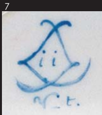
ii為1786年圖十七左底款 V.t.為描金畫工名字