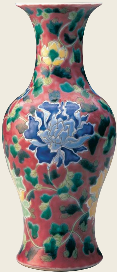
圖九 康熙 琺瑯彩胭脂紅地（粉紅地）牡丹瓶 國立故宮博物院藏 康熙胭脂紅為「粉紅蓬芭度」的先驅

爾名品珍器，以及該館所藏中國、日本、伊斯蘭陶瓷器。美術館後院內仍保留幾棟過去的陶瓷製作廠房（圖三），現為國立塞弗爾製瓷館，館內仍保有十萬個製瓷模具、樣稿以及數千種類的塞弗爾窯釉彩，這些至今仍是不外傳的秘方。為了確保設計和工藝的質量，現每年僅限量製作六千件，塞弗爾窯建有嚴格管理制度、及教育培訓機構，並致力於培養高水準的設計師及工藝師，使得這個由皇家官窯轉為國家管理的國立塞弗爾製瓷館，仍保有過去良好傳統工藝與聲譽。