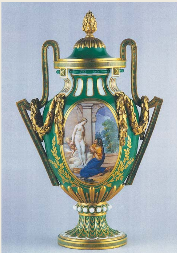
圖六 塞弗爾窯 綠地描金珙瑯彩人物圖瓶(軟瓷) 1765-1770 英國華德生莊園藏

(Jean Hellot) 有關：在一七六六年夏耶洛過世後「粉紅蓬芭度」也隨著永遠消失；換句話說，這個最能代表洛可可風格的色釉，從開發至消失僅短短的十年歲月，在蓬芭度夫人生前