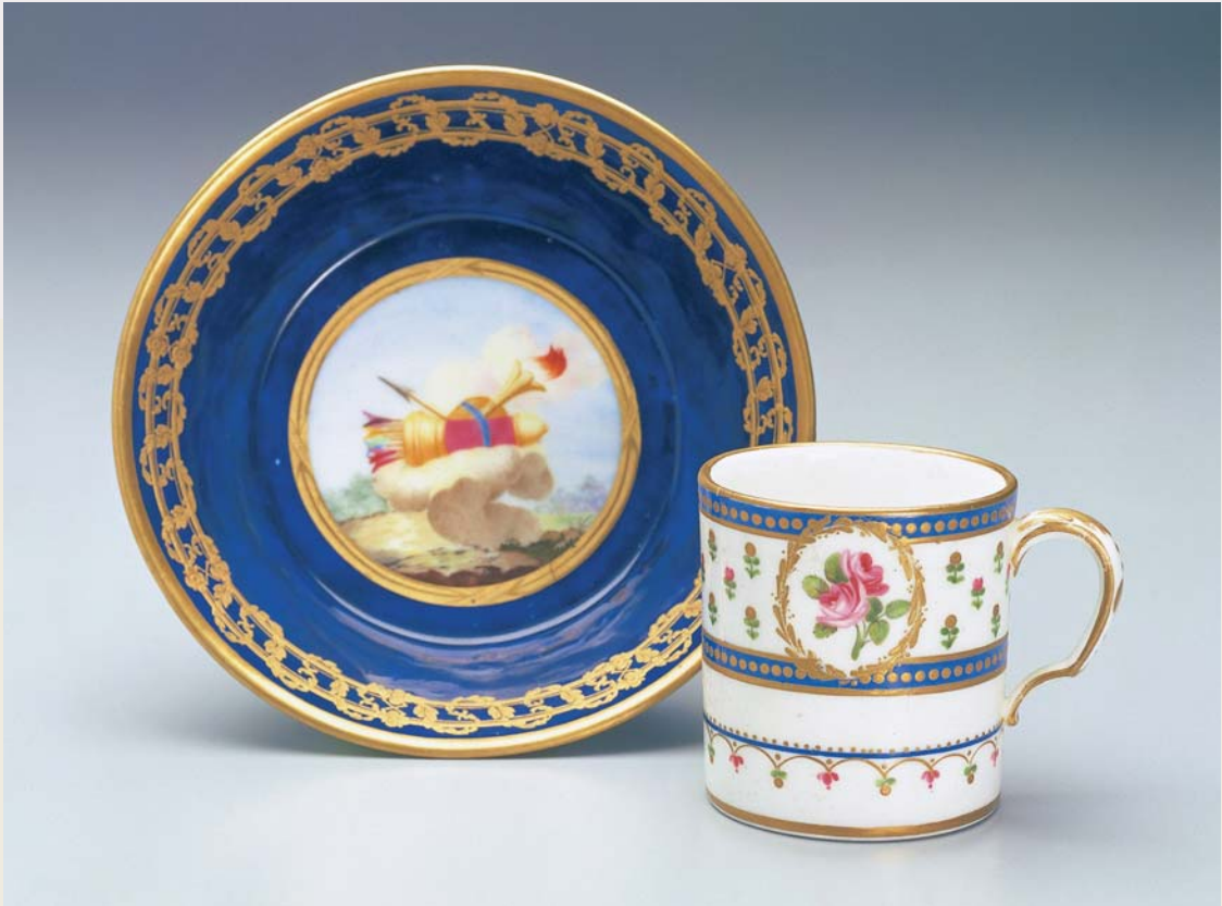
圖一八 塞弗爾窯 藍地描金珐瑯彩箭矛紋茶碟、珐瑯描金花卉單耳茶杯（軟瓷） 1786 國立故宮博物院藏