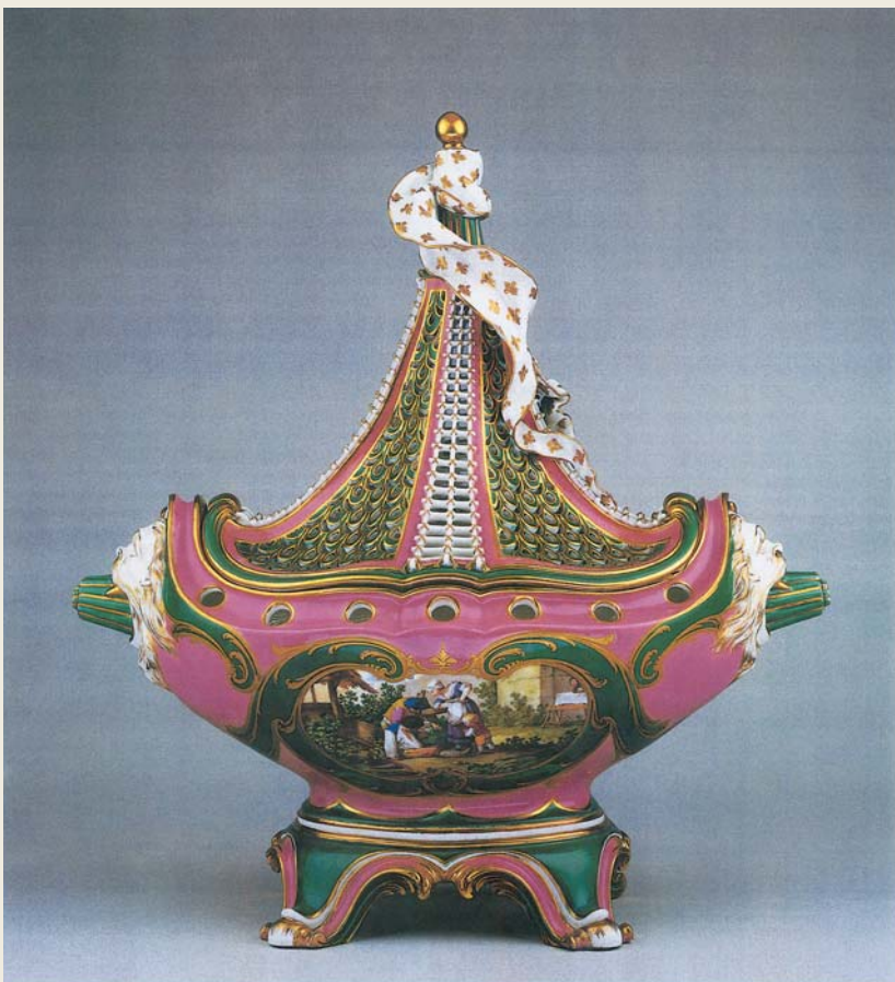
圖八 塞弗爾窯 粉紅地描金珐瑯彩船形香薰（軟瓷） 1760 洛杉磯蓋提美術館藏