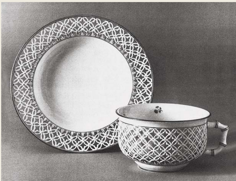
圖二一 塞弗爾窯 白瓷描金鏤空雕花帶托茶杯（杯內沿繪朵花） 1896 瑞典皇家博物館藏

受到明末景德鎮外銷玲瓏（鏤空）瓷的影響，十八世紀起歐洲各窯不斷仿製，塞弗爾此雙層鏤空茶器，應也是在此流風下的產物，然而卻是以塞弗爾引以為傲的傳統精湛技法來完成它的薄、細、輕、精，令人嘆為觀止。