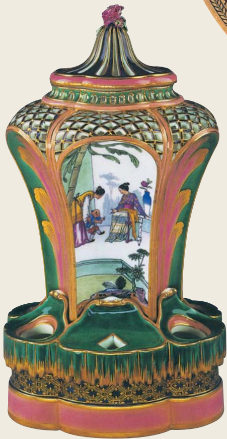
圖一五 塞弗爾窯 描金珐瑯彩中國仕女課子圖薰瓶（軟瓷） 1760 洛杉磯蓋提美術館藏 傳為畫家杜丁所繪