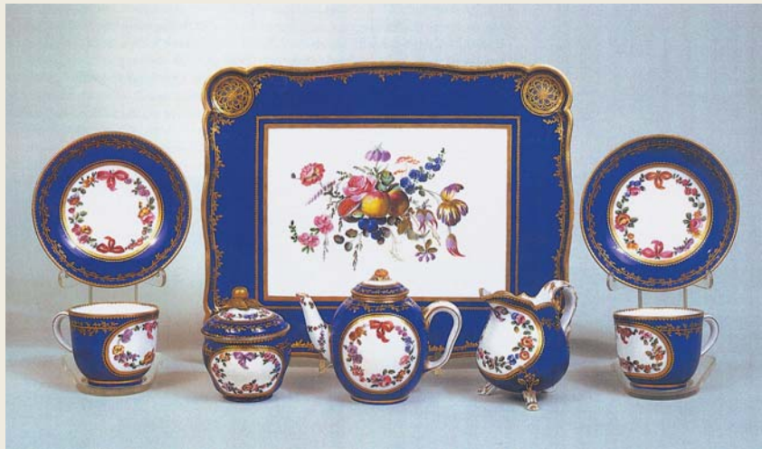
圖一二 塞弗爾窯 藍地描金珙瑯彩花卉紋茶具一套（軟瓷） 茶盤、茶碟、茶杯、糖罐、茶壺、奶罐 1764 瑞士包爾美術館藏