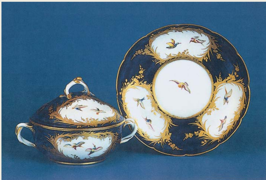
圖四 凡塞那窯 藍地描金瑤瑯彩飛鳥紋蓋鉢與盤（軟瓷）「王者之藍」1753 法國立塞弗爾陶瓷美術館藏

這個「粉紅蓬芭度」色彩也成了塞弗爾窯的代名詞，這種色釉的開發創製，應與前述科學學院總裁夏耶洛