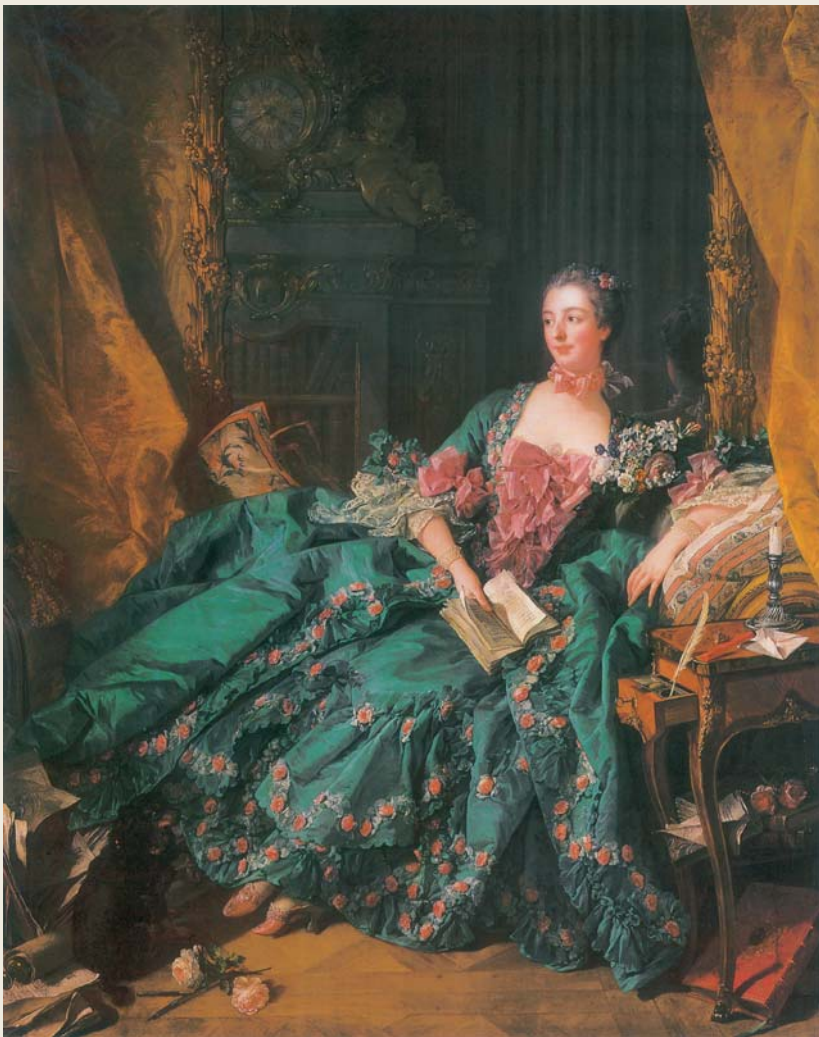
圖一 蓬芭度伯爵夫人畫像 法蘭斯瓦·布雪畫 一七五六 慕尼黑黑埃特美術館藏 蓬芭度伯爵夫人是路易十五的寵姬，為塞弗爾皇家製瓷廠最大的支持者，也是一位藝術愛好者。