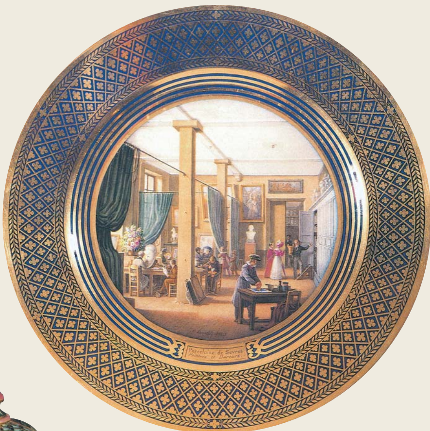
圖一三 塞弗爾窯 藍地描金珐瑯彩「塞弗爾皇家窯廠作坊場景圖」盤（硬瓷） 1823 法國國立塞弗爾陶瓷美術館藏 盤心畫塞弗爾皇家窯廠作坊場景，窯匠們有的正在描金、或描繪珐瑯彩，而窯廠主管正在展示櫃前，對著穿著入時的貴夫人推介作品。盤心下方可見「porcelaine de Sévres Peintres et Doreurs」等塞弗爾款識。