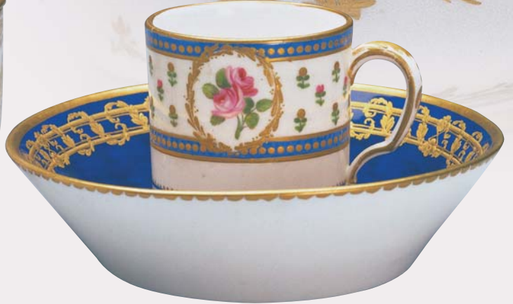
圖一八a 茶杯·茶碟一組（軟瓷） 1786 國 立故宮博物院藏