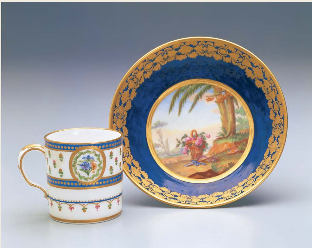
圖一七 塞弗爾窯 藍地描金珐瑯彩花籃紋茶碟 1776、珐瑯描金花卉單耳茶杯（軟瓷） 1786 國立故宮博物院藏