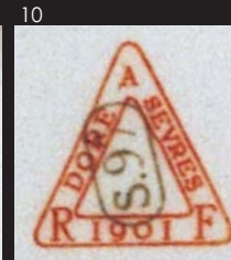
圖十六茶托底款 1901年

「186」「18」較大，「6」較小，故知此罐原價為十八利爾（18.6）。由款識得知，此器為一七八三年製，「LF」為畫家代號，這件帶有加飾皇冠款識的糖罐，應屬路易十六的御用器。