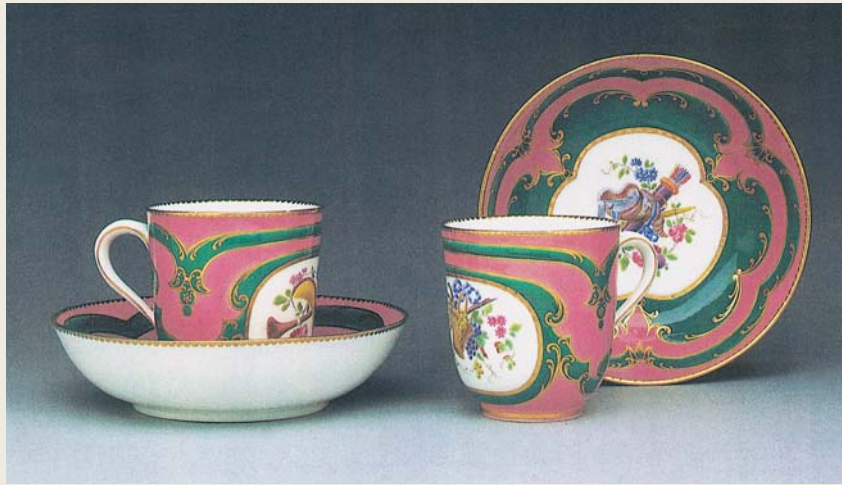
圖一〇 塞弗爾窯 粉紅地描金珙瑯彩花卉紋茶杯、茶碟二組 1759 洛杉磯蓋提美術館藏