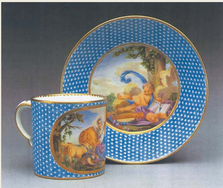
圖五 塞弗爾窯 松石綠(淡青) 地珙瑯彩「珍愛的羊」圖茶杯、茶碟 (軟瓷) 一七七二 洛杉磯蓋提美術館藏