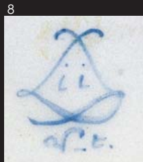
ii為1786年 圖十八右底款