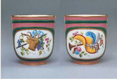
圖一— 圖一〇茶杯局部紋飾