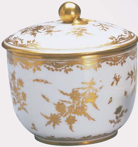
圖一九 塞弗爾窯 白瓷描金花卉紋糖罐（軟瓷） 1783 國立故宮博物院藏