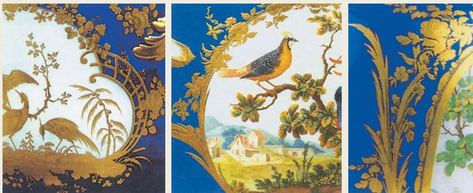
圖二〇 塞弗爾窯 洛可可樣式描金花草藤蔓紋（局部放大） 描金紋飾濃厚凸起為塞弗爾瓷的主要特徵之一

把（圖一八左），內口沿的描金紋則為雙道金圈上纏繞帶花連線紋，底款以濃青畫雙交叉「L」字框，框內寫雙「ii」字母款識，其下並畫有五圈點及「VB」字及淡青「B」，「ii」為一七八六年，「VB」、「B」則為畫工及描金畫工的名字代號（圖表6），此件胎下有陰刻似「2D」或「2C」。