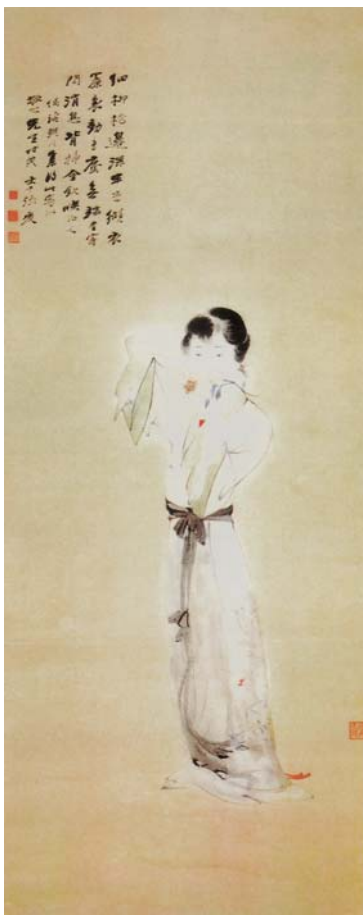
圖四 何應欽藏大千民國二十三年作《背插金釵圖》。 （《雲龍契合集》（何應欽上將珍藏畫畫選輯）頁一〇八）