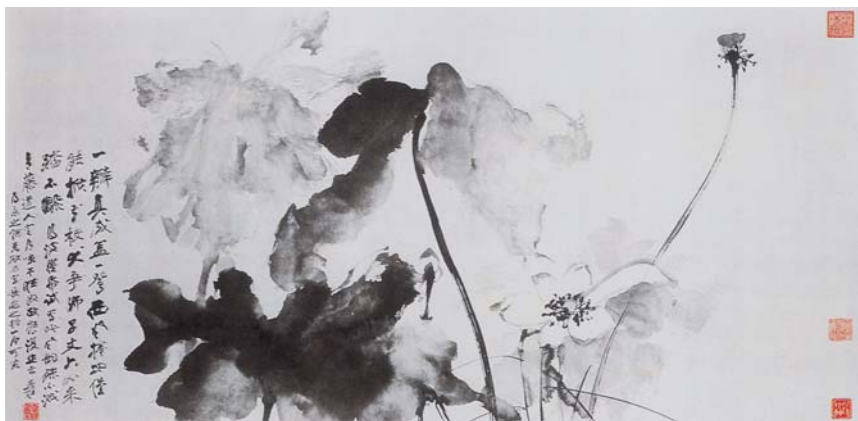
圖一 大千在漢城展出的墨荷之一（《張大千畫展》圖三三 韓國東亞日報社出版）

「江山才子國，花草美人秋，戊午嘉平月寫此，似可與二石爭道也。八十叟爰。」（註三）