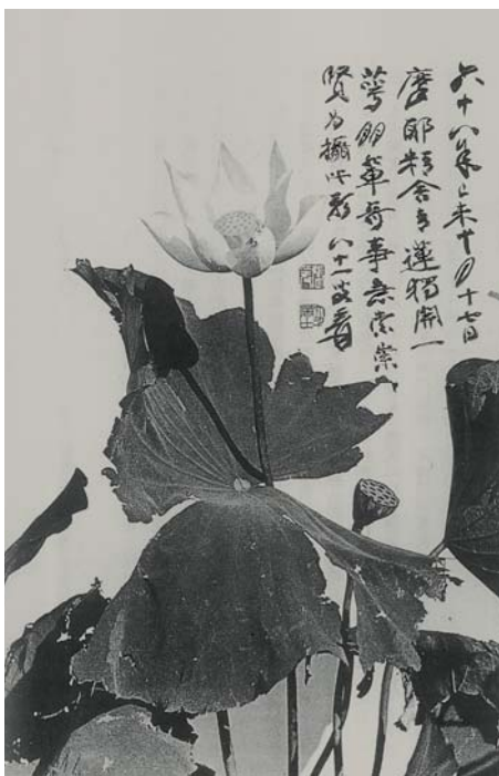
圖三 胡崇賢所攝荷花，大千題跋。 （《中華瑰寶知多少》 頁三九二）

拍至接近住宅的「懸崖松（一稱漸江石）」，光線比較陰暗，之一拍了十多幀，仍不滿意，瞥見一位巴西工人點火抽菸，頓時引發靈感，找些破紙，請工人在「懸崖松」和建築物之間，放火生煙，造成遠近景物的距離和虛實的變化，方始拍成，照片果如漸江和尚筆下的松石。一位在場的中國聲樂家沈愷女士，爲這景象寫了篇生動的報導，聳人的標題是：