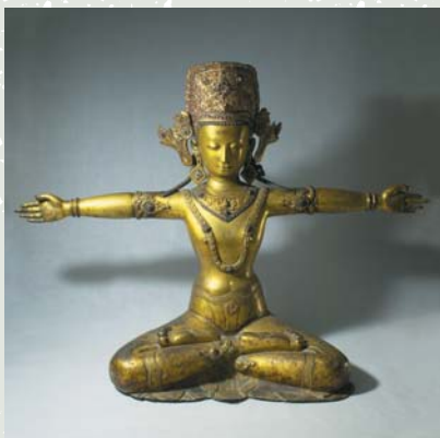
鎚鏤銅鑲金 因陀羅天神 尼泊爾 加德滿都 18世紀

版事業的進行。透過目錄、圖集以及學術期刊的發行，故宮的這批重要文物收藏之大貌，逐步公諸於世，並在對內容的理解上，終能繼十八世紀乾隆皇帝初步奠基之後，首度推進至一個全新的層次。不過，此期最重要的意義主要來自於展覽的開放。在力求合乎現代博物館展示環境條件之嚴格要求下，故宮這些久藏於箱篋之中的珍貴藝術文物，終能一一地展現在觀眾面前。這不僅讓國人得以親身體驗傳統文化之美，而且也提供了國際友人探索中華文化精華的最佳管道。 立於前面四十年的基礎之上，眺望著未來另一個四十年的發展前路，國立故宮博物院也要為自己訂一個更高遠的目標。它除了繼續向世人展示中華傳統文化之藝術結晶外，還應更積極地參與至二十一世紀全球新文化的創造之中。故宮典藏文物雖早為世人公認為最高質量的中華傳統藝術的代表，但它絕不只是供人憑弔、懷舊的民族遺產而已。這些藝術作品同時也記錄著千年來各種不同族群、來自許多國度多元文化交