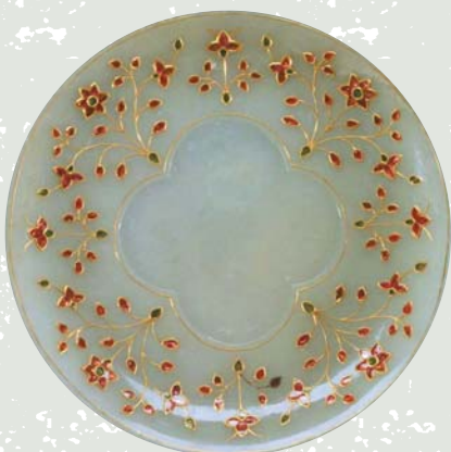
青玉嵌金絲紅玻璃盤 印度 蒙兀兒帝國