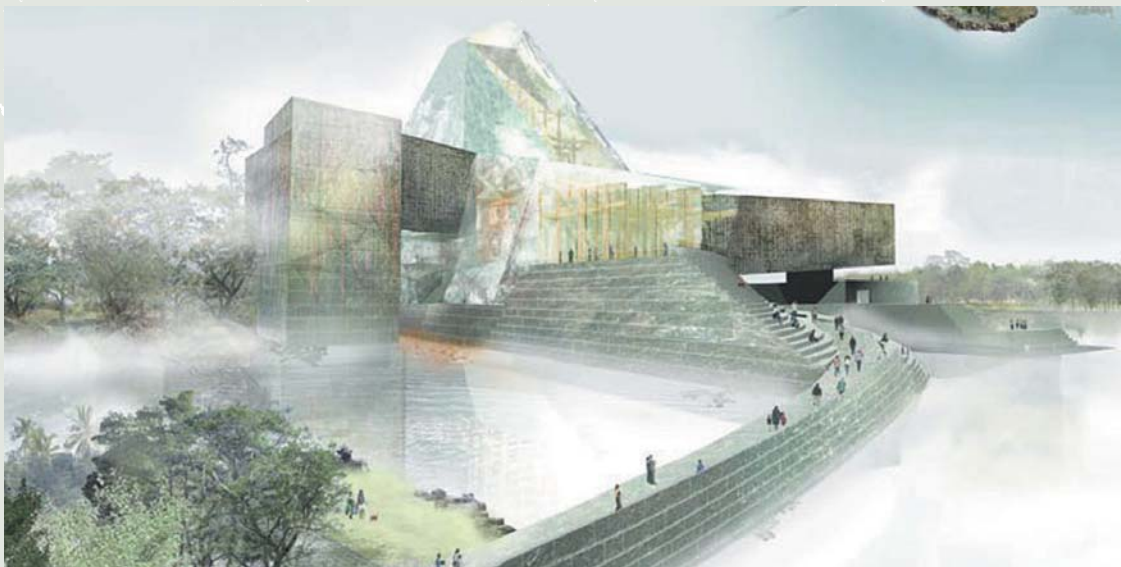
故宮南院建築電腦模擬圖 美國Antoine Predock建築事務所設計

國立故宮博物院近來正在執行的，以及在規劃之中即將開展的工作，可以說就是朝著這個方向所從事的努力。正館整建工程刻正如火如荼般地在進行著。這表面上看是基本硬體設備的改善，增加公共以及教育推廣空間，但更大的改變在於新展室及內容的規劃，希望以文化史為主軸，時代生活為脈絡，不僅讓文物間有所呼應，觀眾亦能以自由的方式，與文物進行跨越時空的互動。展覽與教育的理想功能並非只是知識的傳授，更重要的是去創造一個具有豐富可能性的互動平台。策展及教育人員的專業能力在此便具有關鍵性的作用。