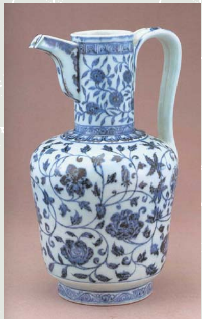
青花花卉執壺 中國 明永樂

可是，使命不能只是停留在理念的層次，如何落實才是真正的問題。就博物館的專業工作而言，典藏、研究、展覽、教育這一貫的作業仍是不變的主軸，只是在面對新局之時，需有新的思考，採用新的作法而已。相關的工作項目很多，很繁雜，但對故宮而言，它收藏的藝術文物仍是其存在的根本，一切考慮，如由之出發，可說最為具體而妥適。博物館學界近年倡議「觀眾本位」為博物館運作之指標方向，但如何防止其不墜入負面的「媚俗」魔障，亦是必持的審慎態度。如果回歸到文物的基點，所謂的「觀眾本位」實則可以更清晰地闡釋為「創造人與文物間的新關係」，追求博物館研究教育人員、觀眾與文物三者之間的多向互動，而將最終目標歸結到「創造觀眾文化體驗的全新深度」之上。