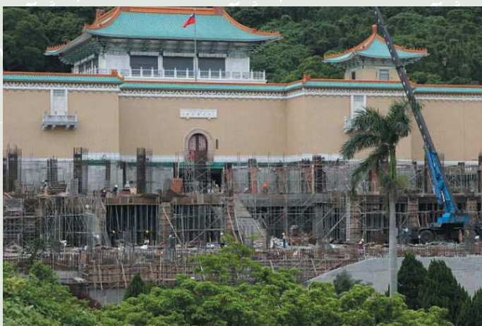
正在整建中的國立故宮博物院 2005年