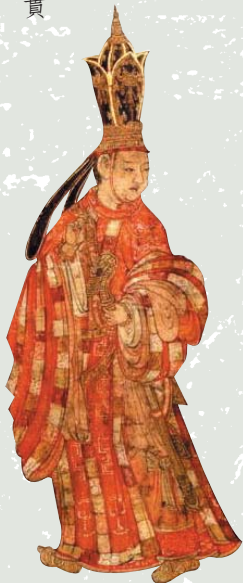
張勝溫 梵像卷 局部 大理國 (雲南) 12世紀