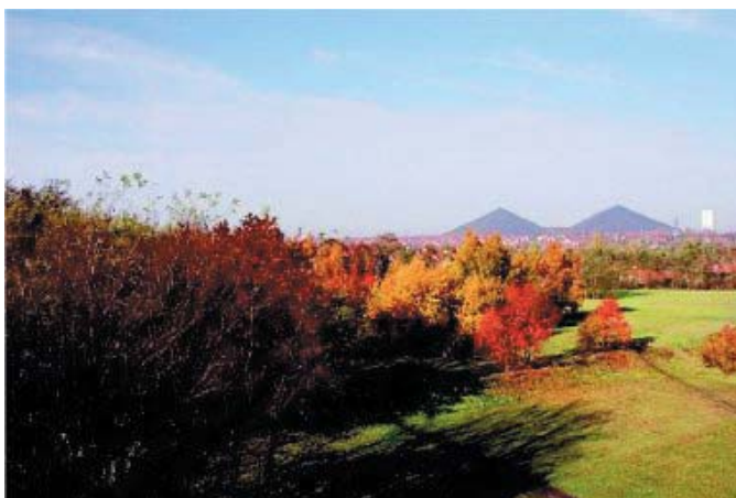
羅浮朗思分館基地一景（Dr. Delahaye提供）

該是考慮如何將未來的博物館融入整個城市與周圍的環境中。因此，如何與這個地區的居民取得良好的溝通並且獲得認同是一項必要的工作。事實上，在這個以往以礦業爲主要活動的城市裡，應該考慮到的是如何將羅浮宮分館預定地與都市的整體規劃融合而不去除滅或隔離都會的歷史。