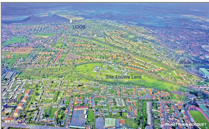
法國朗思市鳥瞰圖，圖中為羅浮—朗思分館基地

朗思市的優勢之一就是其在於農業科技建設的領域中有蓬勃的發展，並且亞脫（Artois）大學的科學重鎮也坐落於此；除此之外，朗思也因為