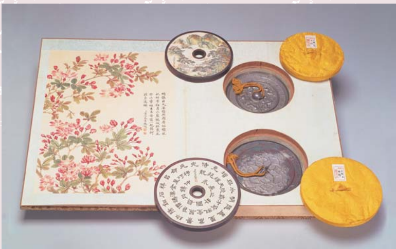
包裝華麗作冊頁狀的「方銅鏡」。國立故宮博物院藏 上方銅鏡：唐初素月鏡（T56-39），下方銅鏡：隋末唐初玉匣鏡（T57-39）。