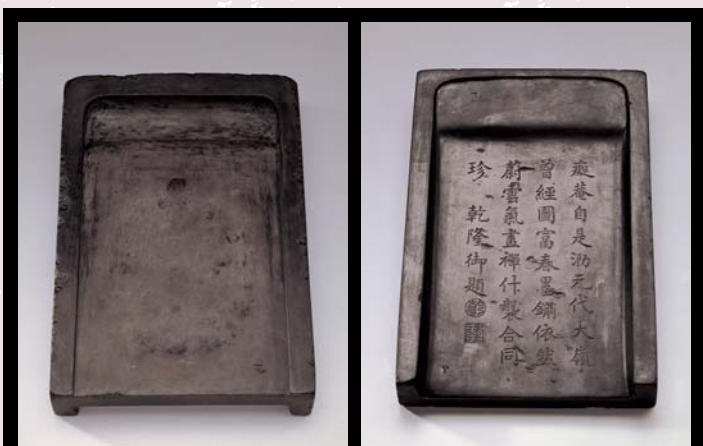
元 端石癡庵硯 國立故宮博物院藏

列，則僅編總號，例如西周的「散氏盤」單獨放在養心殿皇帝寶座前面，編號是「呂二」；如果是裝在同一個木箱中的文物，或者是裝在同一櫥櫃中的文物，在編一個總號之後加上阿拉伯數字作為分號，也就是說：同一箱櫃中不同的文物用同一個總號，而