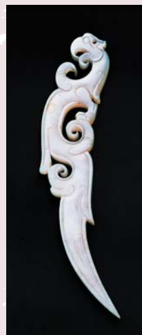
戰國 玉鳳紋觶 (呂一〇六一補23之三)

與「呂一六九八11」，即表示它們原本收貯養心殿，並且裝在同一個箱櫃中；又如同時展出的玉器——「漢 玉避邪」(呂一七九〇3之一)與「漢至六朝 玉角形杯」(呂一七九〇49)，原來也是收貯在養心殿的同一個箱櫃中。