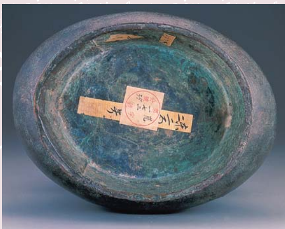
殷墟中期 獸面紋壺 圈足內 清宮黃簽與清室善後委員會號簽