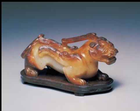
漢 玉避邪 (呂一七九〇3之一)