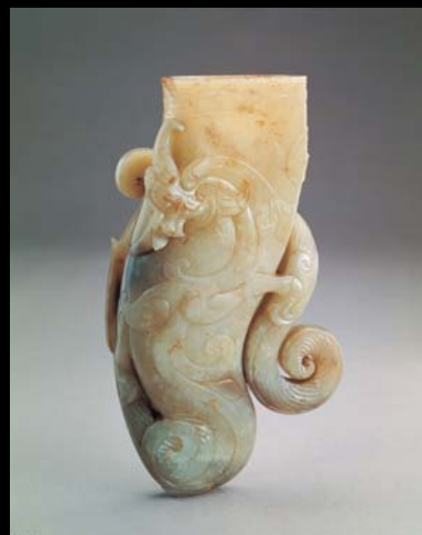
漢至六朝 玉角形杯 (呂一七九〇49)