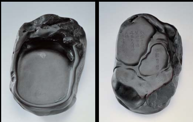
明 楊士奇 舊端石子硯 國立故宮博物院藏

其編號分別是「呂一六九八9」與「呂一六九八11」，即表示它們原本收貯養心殿，並且裝在同一個箱櫃中。