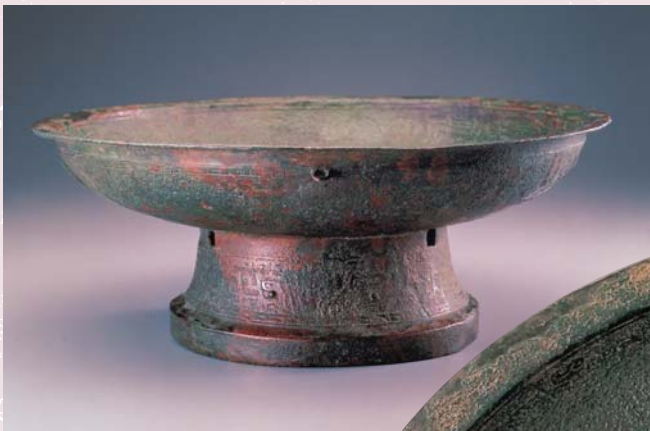
商後期 蟠龍紋盤 (JW 3005-38) 國立故宮博物院藏

去年（二〇〇四）十月，北京線裝書局將當年清室善後委員會編印的《故宮物品點查報告》重新景印發行，並且將民國二十二年（一九三三）國民政府行政院與內政部會同當時（北平）故宮博物院對頤和園所存物品清點的清冊附印於後。此書中將弘德殿之《千字文》代碼誤植為「洪」字，經查本院所藏編號為「月七〇」的「修身理性琴」即為書中所載「陶製七弦琴」，故弘德殿的《千字文》代碼實為「月」字。