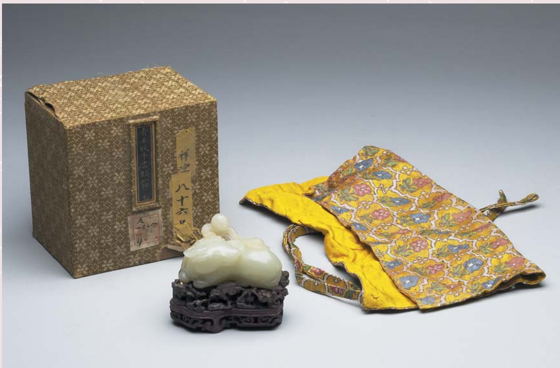
清 青玉牧牛書鎮 國立故宮博物院藏 「天一三二四」是清室善後委員會編號，為乾隆清宮舊藏，連木座、錦袱、裱錦木匣，為完整包裝。「故玉3207」為現在的典藏號。