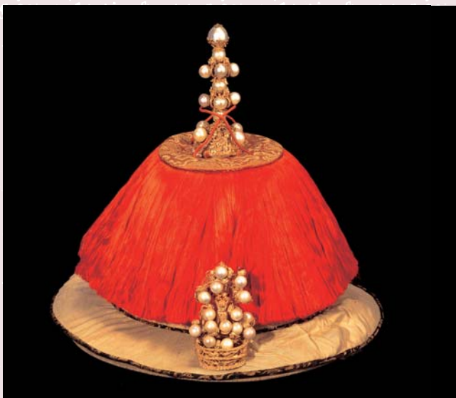
清高宗 夏朝冠 (金八七)