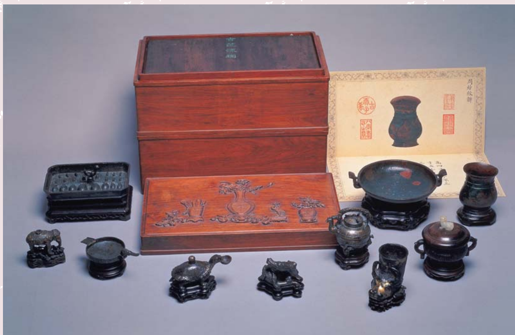
吉甌流輝多寶格 國立故宮博物院藏

「金二四七49」，表示它原來收貯在永壽宮，與其他小型多寶格裝在一起，總號是「二四七」，「吉甌流輝多寶格」也許是第49個小箱，收貯在這個多寶格中的文物再用「之一」、「之二」等編號，有些「之」字後面的數字因為保管人員書寫方便，也被寫成「之1」、「之2」。