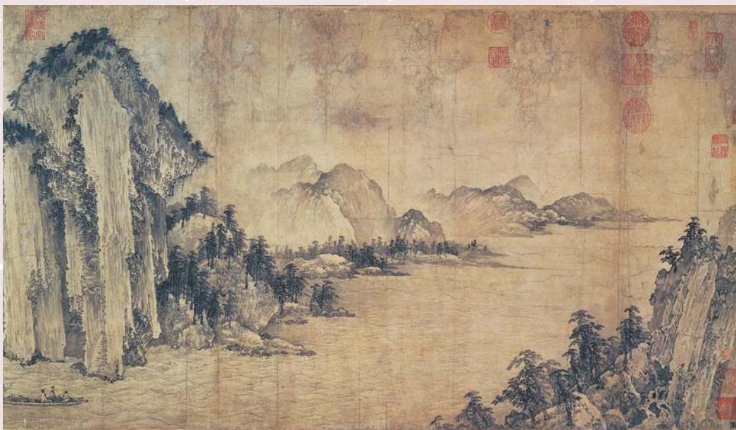
金 武元直 赤壁圖（卷） 國立故宮博物院藏 畫幅的右下角墨書一「譏」字，是《千字文》的第七〇七字。