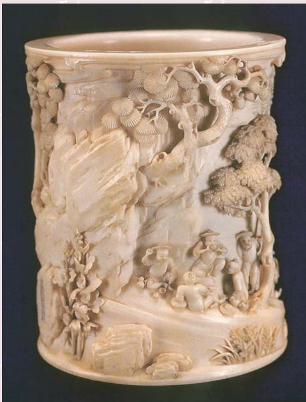
清乾隆三年 黃振效 雕象牙山水人物筆筒 北京故宮藏（故124255）

四〇15」號，古物館留平復查號則是「成二四五15」，它的「故」字號是「故124735-124746」，也就是每一開賦予一個號。目前該館多僅用「故」字號，若非特別保留，或者不常提出展覽，它們的《千字文》號簽得以依舊黏貼在原件上，通常經常展出的名件往往不易查得其《千字文》號碼，該館年輕一輩的典藏人員輒多不明瞭