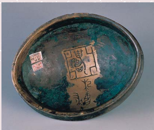
殷墟晚期 亞醜杞婦白 器蓋內 國立故宮博物院文物ID