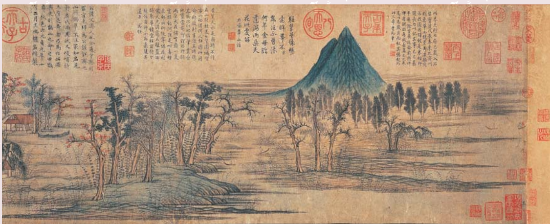
元 趙孟頫 鵲華秋色（卷） 國立故宮博物院藏 畫幅的右下角有墨書「其」字，乃《千字文》的第702字。

輪用「呂」字為代碼；養心殿後面的永壽宮是一座收貯文物的宮殿，所貯文物常為供養心殿替換用，永壽宮中文物即以「金」字為代碼。筆者任職國立故宮博物院器物處二十餘年，多年整理庫房中文物的經驗告訴我：凡以「天」、「呂」、「金」字為代碼的文物往往質量較佳。