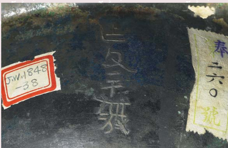
仿西周獸面雲雷紋簋 銘文局部 左方號簽：國立中央博物院文物ID，右方號簽：古物陳列所文物ID，表示此件文物原為瀋陽故宮所藏。

文》點查號仍不予廢棄。據了解，今日北京故宮博物院已不重視昔日這種以《千字文》為代碼的編號方式，使得有些已按質材歸類的文物