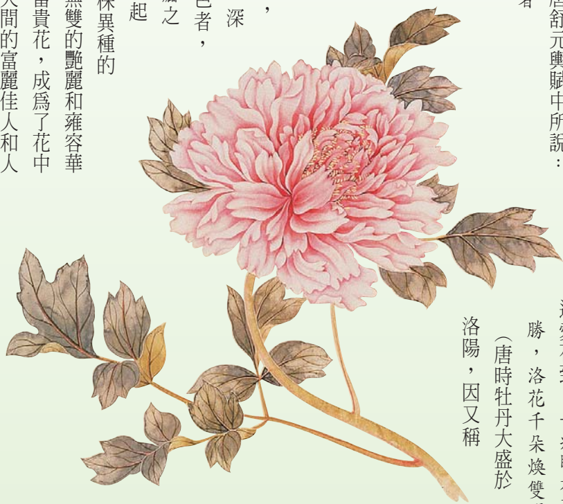
牡丹—清 汪承霈 春祺集錦 局部 國立故宮博物院藏

季時，專設看花局來觀賞之，有「花開時節動京城」之句；又有唐劉禹錫的〈渾侍中宅牡丹〉：「徑尺千餘