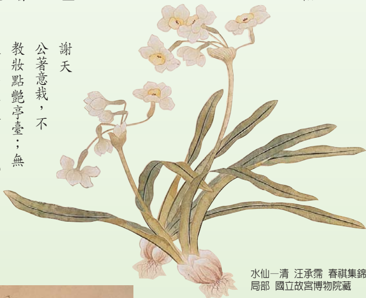
水仙——清 汪承霈 春祺集錦 局部

于謙〈落花吟〉則有詩句如：「昨日花開樹頭紅，今日花落樹頭空；花開花落尋常事，未必皆因一夜風。」前者觀察自然現象，怨花落是東風無情之故，後者卻以花本遲早會有開落之時，因以尋常心看待之。更有甚者，不但是賞花，還以花的立場來闡述其心情，如明李禎〈花答〉所言：「多