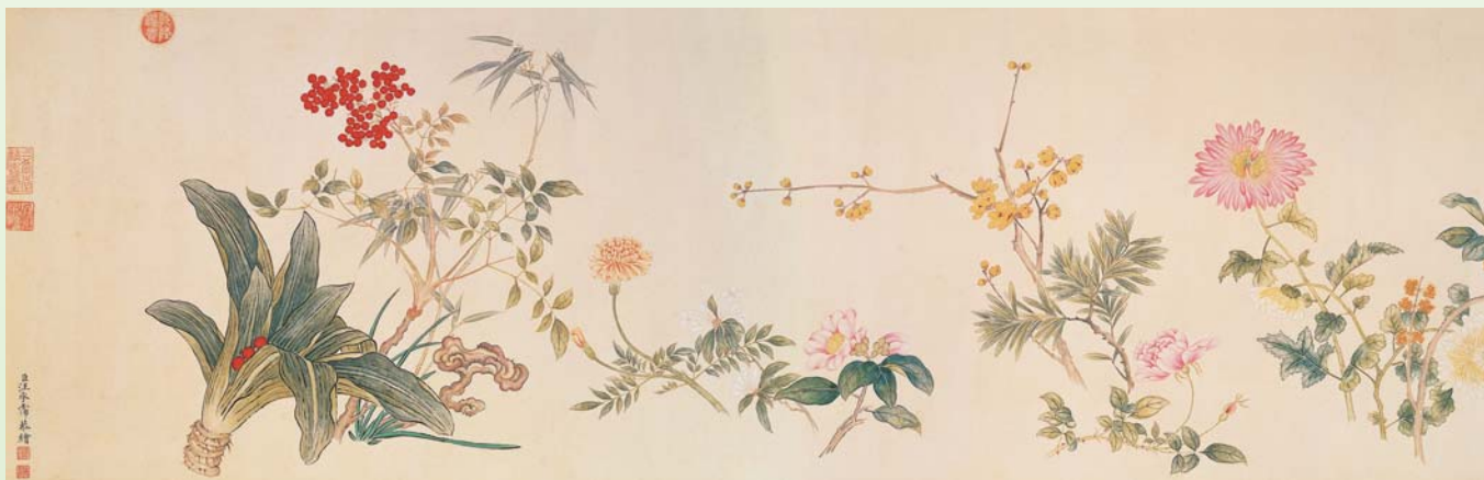
清 汪承霈 春祺集錦 國立故宮博物院藏

景花卉」為畫名；有些僅名為「花卉」或「寫生」或是「花鳥」、「花卉草蟲」；有些則有著特別的名稱如：「仙圃恆春」、「綺闌綯采」、「春祺集錦」、「群芳擷秀」。在表現的形式上，皆為手卷和冊頁的形式，而無畫軸的形式；可能主要因為畫軸為單幅，要在一幅畫面中呈現許多的花卉，不但不易，就算都安置在其中了，也往往成爲一種較圖案化或裝飾性的表現，有時甚至不免有擁擠和繁雜的感覺，而缺少了自然的美感和舒緩的氣氛。但手卷和冊頁則不同，兩者都具有較充份和有延展性的空間。手卷會從卷首向後延伸，可以一段一段或以間雜的方式，依季節順序來畫出當令的花卉；冊頁