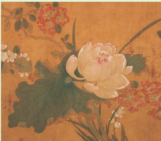
蓮荷—明 陸治 四時花卉真蹟 局部

夏季的花卉中，薔薇和蓮荷是不同的象徵，薔薇有著夏日的熱情，蓮荷則展現消暑的氣氛。其出自水中，花葉高居水面，花色柔和，以紅、白為常見，黃色為稀有，帶清香味，在又圓又大綠葉的烘托下，正是所謂「芙蓉池裡葉田田」、「濃淡共妍香各