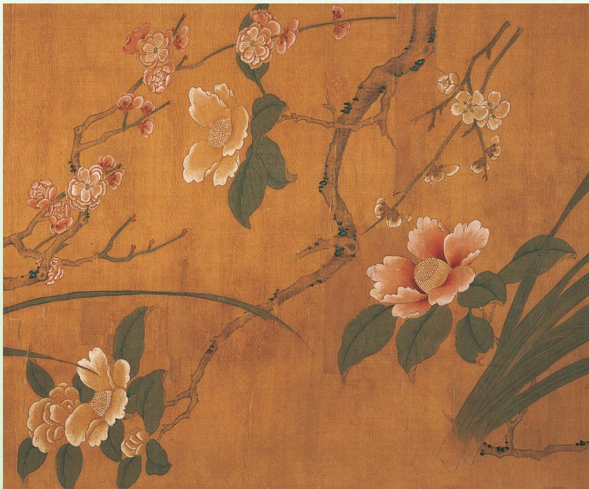
茶花—明 陸治 四時花卉真蹟 局部 國立故宮博物院藏

梅花從冬日盛開，開時清香四溢。白者如滿天雪花，有云：「中庭一樹梅，寒冬葉未開；祇言花是雪，