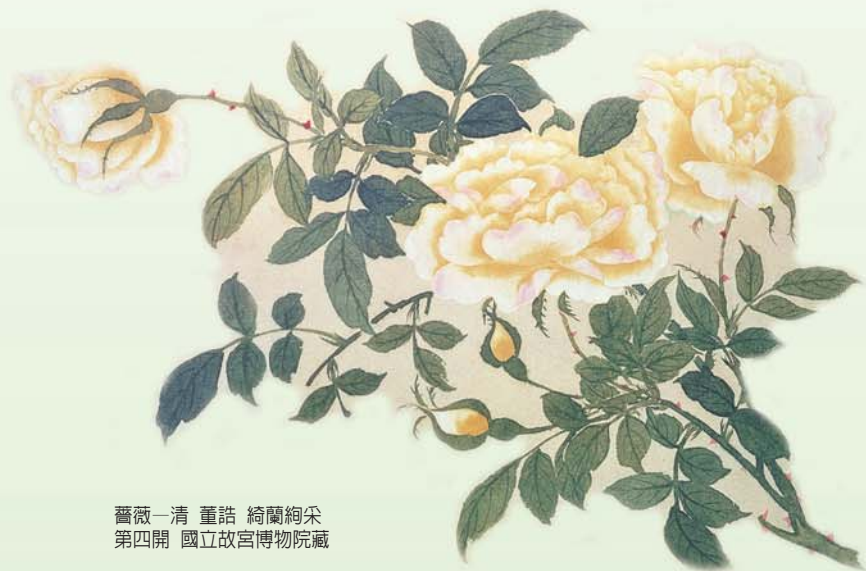
薔薇—清 董誥 綺蘭圖采 第四開 國立故宮博物院藏

此花開不厭，一年長占四時春。」正由於它的常開少謝，好像一直在等待著什麼而不願凋謝，也許是在等待能欣賞和讚美它的人出現吧！這份心情一如人的癡心盼望，故號癡客。