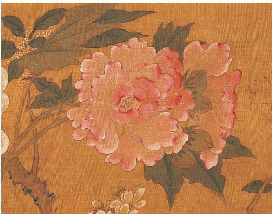
芙蓉—明 陸治 四時花卉真蹟 局部 國立故宮博物院藏