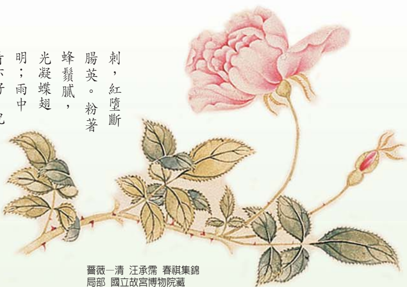
薔薇—清 汪承霈 春祺集錦 局部 國立故宮博物院藏

刺，紅墮斷腸英。粉著蜂鬚膩，光凝蝶翅明；雨中看亦好，況復值初晴。」 薔薇的莖多刺，人們以人情度之，認為是因它的美麗會引人前來採折，所以多刺來加以自衛。而玫瑰的多刺是最有名的，因號稱為刺客。另月季花又名長春花，因四季皆會開花而得名，明張新《月季花》：「一番花信一番新，半屬東風半屬塵；惟有