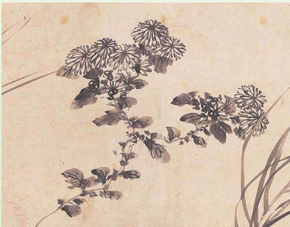
菊花—明 陳淳 寫生 局部 國立故宮博物院藏