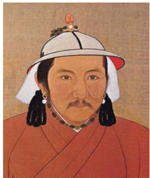
圖一 元文宗 (1330~1332) 頭間掛有項鍊。國立故宮博物院藏

念珠是佛教僧尼與善男信女唸佛計數的法器，也是篤信喇嘛教的滿清人製定朝珠的濫觴：由於清人飾用朝冠的形狀和冠頂的製成，都可從同是來自北方而在