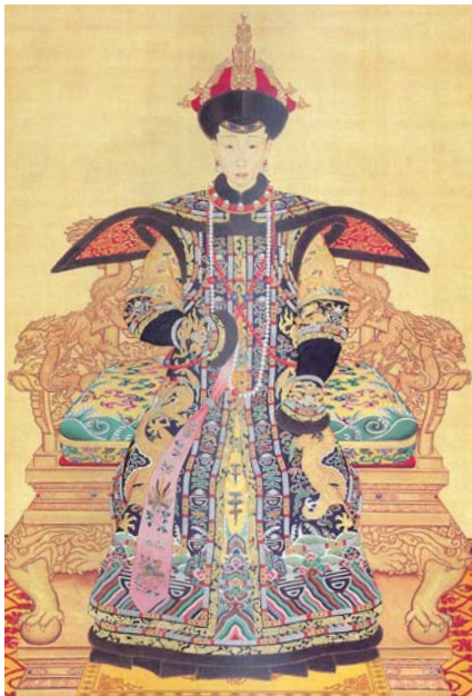
圖八 掛東珠朝珠的乾隆后畫像，珊瑚佛頭上下未多加一粒珠子，珊瑚記捻。

制與念珠或朝珠都不同。此外，在故宮典藏的東珠朝珠中，還見一掛以青金石為佛頭珠、上下多加珠子、記捻則用珊瑚，與一般