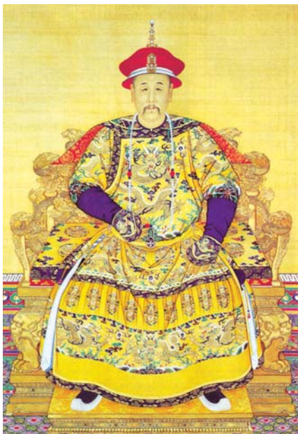
圖四 佩掛東珠朝珠的雍正皇帝畫像。朝珠形制，除背雲部份無法確定外，其餘均與圖五雍正帝御用的東珠朝珠相同。