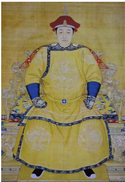
圖三 清世祖順治帝朝服畫像。