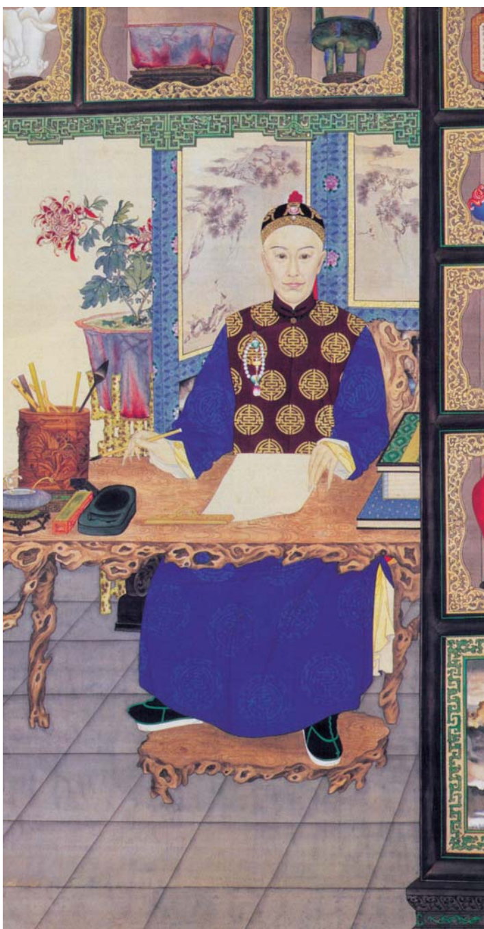
圖二一 《光緒皇帝讀書圖》在大襟嘴上掛A型手串。

由此看來，(II)類型手串開始製作和懸掛的年代大致在十九世紀中期，以女人佩掛較為普遍。筆者以為，B型手串出現的時間或許稍早於A型，由於其懸掛時下垂的珠串過長而較累贅，才改善至A型，故在晚期圖片中的手串，幾乎均屬A型。到了十九世紀末期，飾用手串的風氣似乎已經式微，如從清代末期的圖