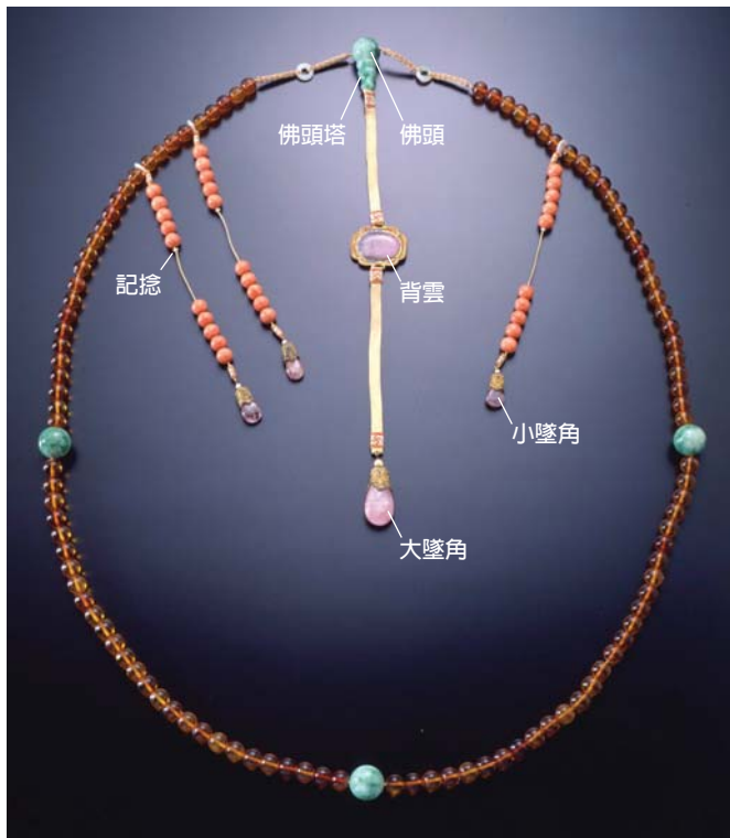
圖二 朝珠結構圖。國立故宮博物院藏

成串；另外三串「記捻」，每串由十顆成「一行二就」方式的小珠子、和「小墜角」組成，以一邊一串、另邊兩串分列在佛頭塔的左右（圖二）；佩掛時，男人要把兩串記捻垂在脖子左邊的胸前，女的在右胸，背雲部分則垂在背後。