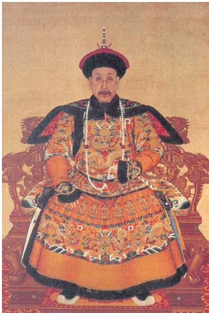
圖七 掛東珠朝珠的乾隆皇帝畫像，珊瑚佛頭上下未多加一粒珠子，珍珠記捻。