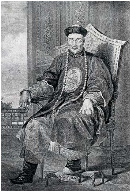
圖九 乾隆帝穿常服像，頂間所掛的珠串，形制與念珠或朝珠都不同；此圖繪於一七九七年，遜位後為太上皇的第二年。