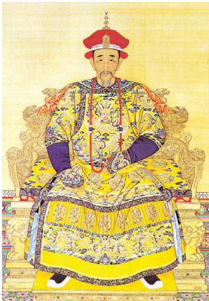
圖六 康熙帝掛紅色寶石（珊瑚）朝珠畫像，藍色寶石（青金石）佛頭上下多加一顆珍珠，綠松石記捻。