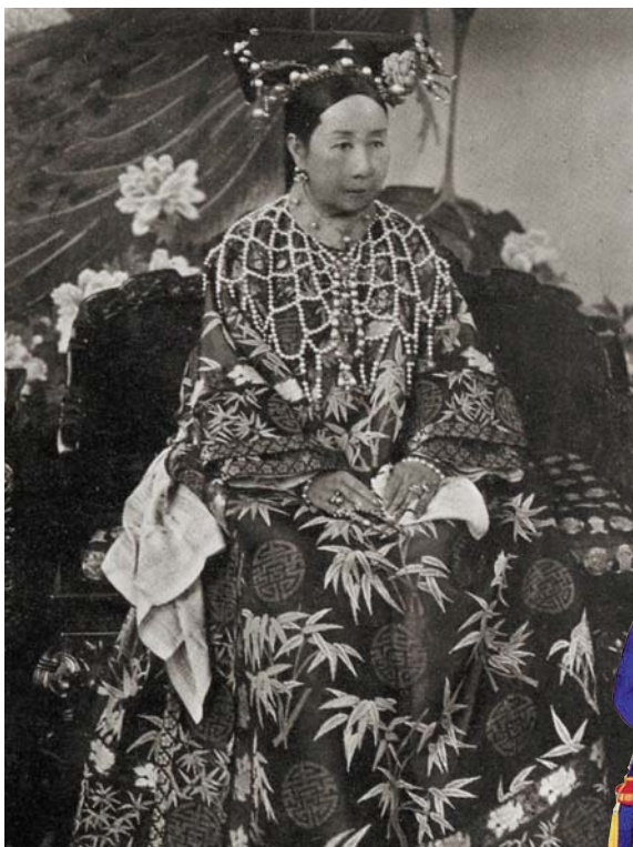
圖十九 慈禧太后穿上由三五〇〇顆珍珠綴成的披肩，還在胸前掛大顆粒的珍珠手串，戴珍珠手鐲及戒子。 圖二十 咸豐孝欽貴妃(慈禧太后)畫像，把(II)類A型手串掛在對襟衣的第二顆鈕扣上。

至於男人飾用手串的問題，遍尋國外幾位拍攝十九世紀中後期中國人文照片的攝影家作品、北平故宮珍藏的清廷王公大臣的常服畫像與照片、或者穿戴整齊的鄉紳，僅發現光緒皇帝(一八七二~一九〇八)(圖二)和李鴻章(一八二三~一九〇二)的衣襟上掛有手串，前者把A型手串掛在大襟嘴上，後者是在胸前掛了B型手串。