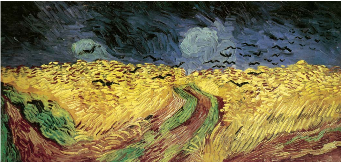
圖八 梵谷 〈麥田群鴉〉，1890 油畫、畫布，50.5×103公分 荷蘭國家藝術收藏館藏