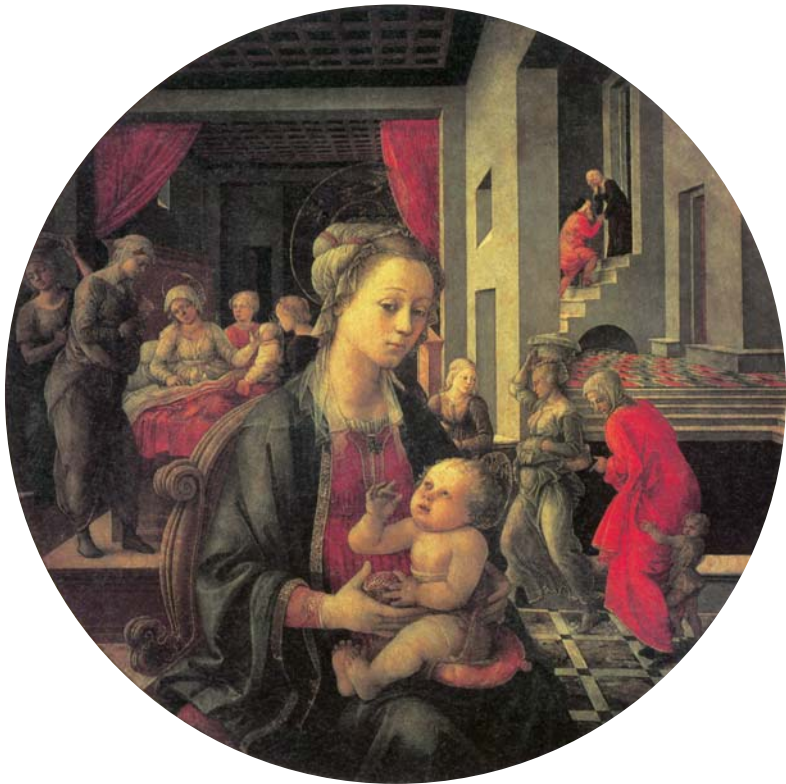
圖四 菲利普·利比〈聖母與聖嬰〉，1452 油畫、木板，直徑135公分 碧堤宮藏

比 (Fra Filippo Lippi) 同樣也是一位修道士，但卻行為不檢，和一位修女鬧出緋聞，兩人還生下兩個孩子，最後被教會解除聖職，然而從他的繪畫中卻看不出什麼離經叛道的痕跡(圖四)。比菲利普·利比晚了六十多年出生的德國畫家杜勒 (Albrecht Dürer) 在一五一四年刻了一張名為〈憂鬱〉的版畫(圖五)，畫中主角就是一位生著翅膀、撐著頭、代表著憂鬱的人物。杜勒的同鄉墨蘭頓 (Melancthon) 雖說過這位畫家是個憂鬱的人，然而，這張版畫除