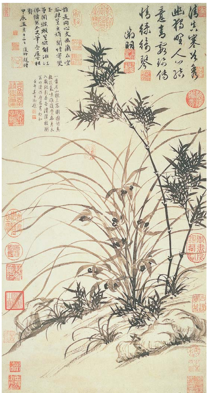
圖二 明 文徵明〈蘭竹〉，1544 國立故宮博物院藏

家，而只能被稱為畫匠，一位好畫家必須有良好品格並且深具人文素養才行。當時的人似乎也會將畫作的品質和畫家的個性聯結在一起，譬如安吉利科的名字並非這位畫家的本名，而是別人給他的暱稱，意思是「如天使一般」，薩瓦利也描述他是位謙虛、虔誠而又仁慈的人，並聲稱他所畫的〈聖母加冕圖〉(圖二)美得就像是在天堂中畫出來的，讓人看了完全明白為什麼這位畫家會被人稱為「如同天使一般的修道士」。從這段描述中可以看出薩瓦