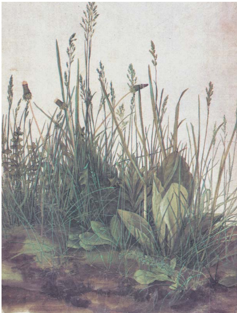
圖三 杜勒〈草〉，1502 水彩，41×32公分 阿爾貝特版畫收藏館

利將畫家的品格修養和他的作品做了某種程度的聯結，這和中國「觀畫知人」的概念是很相似的。