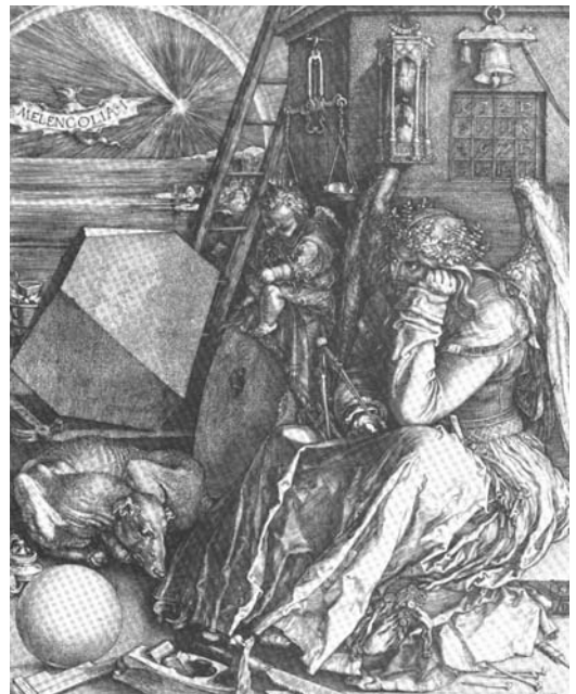
圖五 杜勒〈憂鬱〉，1514 版畫，240×187公分

比 (Fra Filippo Lippi) 同樣也是一位修道士，但卻行為不檢，和一位修女鬧出緋聞，兩人還生下兩個孩子，最後被教會解除聖職，然而從他的繪畫中卻看不出什麼離經叛道的痕跡(圖四)。比菲利普·利比晚了六十多年出生的德國畫家杜勒 (Albrecht Dürer) 在一五一四年刻了一張名為〈憂鬱〉的版畫(圖五)，畫中主角就是一位生著翅膀、撐著頭、代表著憂鬱的人物。杜勒的同鄉墨蘭頓 (Melancthon) 雖說過這位畫家是個憂鬱的人，然而，這張版畫除