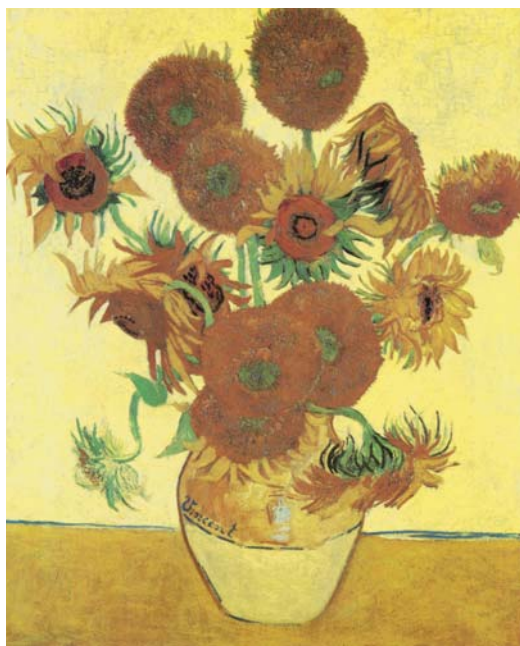
圖七 梵谷 〈向日葵〉，1888 油畫、畫布，93×73公分 倫敦國家畫廊藏

右，當時他夢想在法國南方建立一個藝術社區，朋友高更又即將要來和他同住，開心的梵谷爲了幫朋友裝飾房間而畫的向日葵（圖七），顏色燦爛、生意盎然，反映出他當時的興奮之情，在寫給弟弟的信中也提到他畫向日葵時是充滿熱情的。但兩年後畫的〈麥田群鴉〉（圖八）卻展現了極度的不安：一群烏鴉飛過烏雲密佈的天空，麥田在狂風中晃動，用色也極度陰暗，這幅畫很可能是梵谷的最後一件作品，反映出他自殺前憂鬱而狂亂的心境，雖然他並未留下對這件作品的文字敘述，但他稍早時另外畫了其它以麥田爲主題的畫，並寫信告訴他的弟弟他在這些畫中刻意表現了他極度的孤單和悲傷。根據這些畫家本人留下的信件可以證明，梵谷已經脫離了傳統，不是爲了表現自然而作畫，而是有意識的藉著自然的景象來傳達自己的感情心緒。