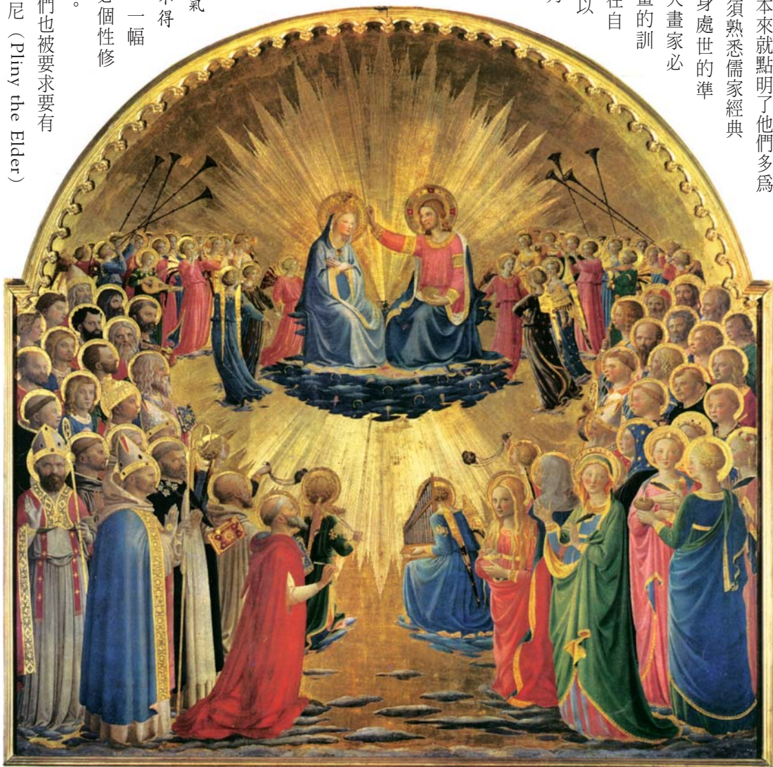
圖一 安吉利科〈聖母加冕圖〉，1435~1440左右 蛋彩、木板，112×114公分 烏菲茲美術館藏