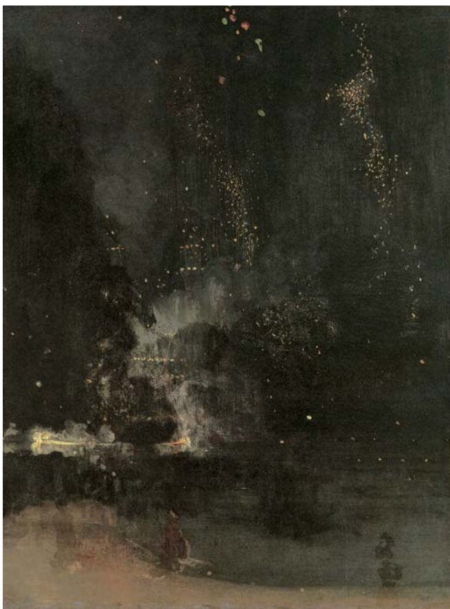
圖六 惠斯勒〈黑色與金色的小夜曲—墜落的煙火〉，1875 油畫、畫布，53.5×75.5公分 底特律藝術中心藏

惠斯勒 (James Abbott McNeill Whistler) 正好有許多作品名稱都和音樂有關，他在一八七七年展出一件作品〈黑色與金色的小夜曲—墜落的煙火〉