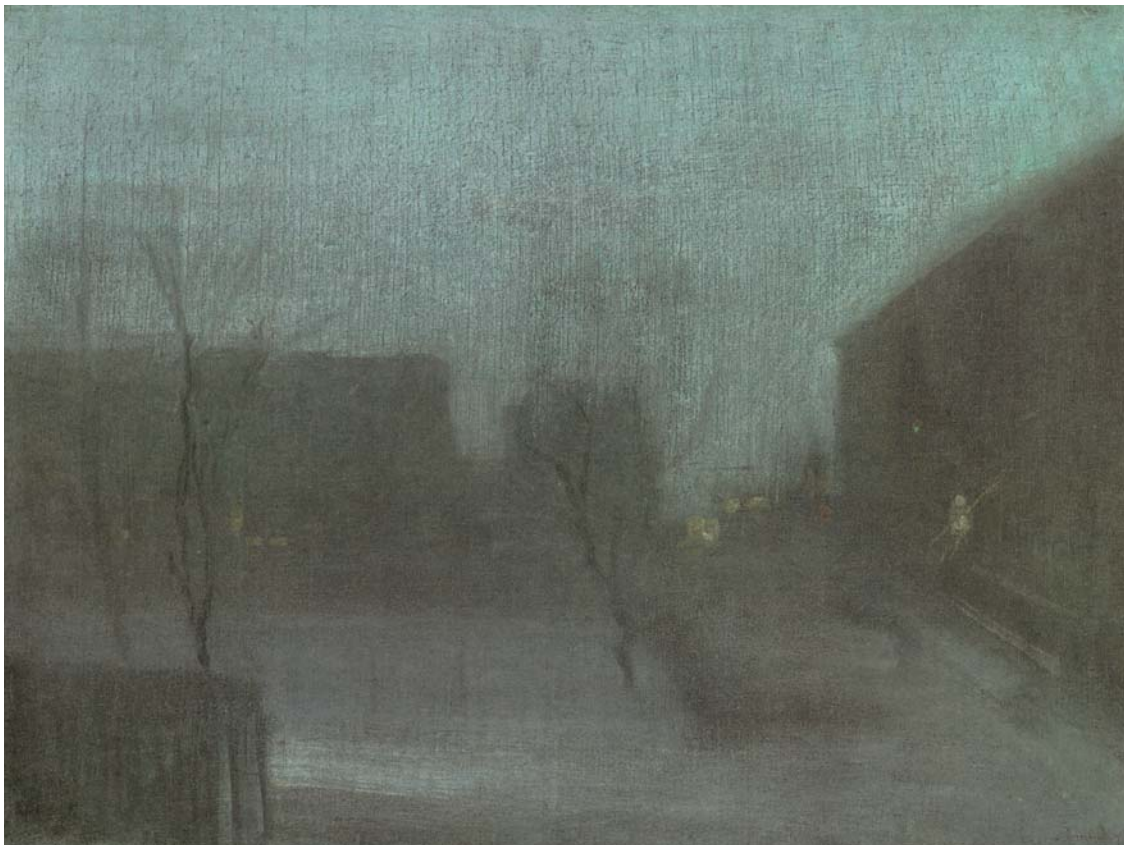
圖九 惠斯勒〈小夜曲：特拉法廣場—卻爾希的雪景〉，1875~1877左右 油畫、畫布，47.2×62.5公分 弗里爾畫廊藏