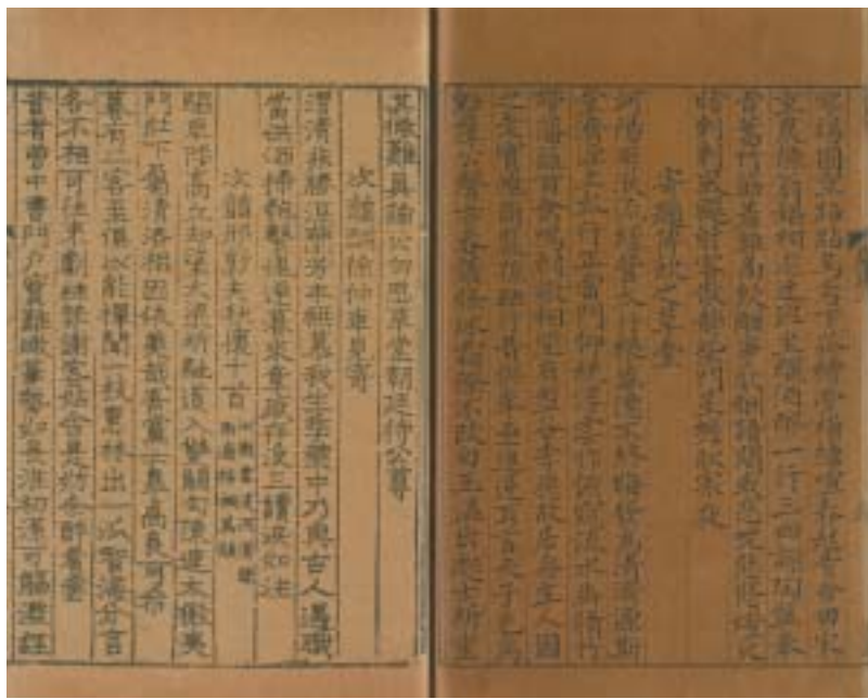
圖五 本書原版有多處缺葉，可由紙張與字體，一窺遞經元明依原式抄配之修補軌跡。

體秀挺潔麗，較原版瘦削，似為元季所補刻」(圖五)而《長短句》補抄之紙張與字體與正集與後集不同，應非同一次抄成。阿部隆一於《中國訪書志》中則認為補抄應為「元末明初間」。