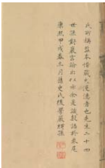
圖四 康熙甲戌（三十三年）嚴繩孫手書題識，下有「繩孫」朱方，「秋水」白方。