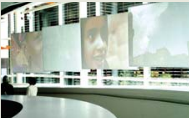
（左上）蓋布朗利博物館一樓大廳，左為語音導覽櫃臺，出借英、法、西、德及義語之語音導覽設備、中為服務台，右方則為樂器庫房。