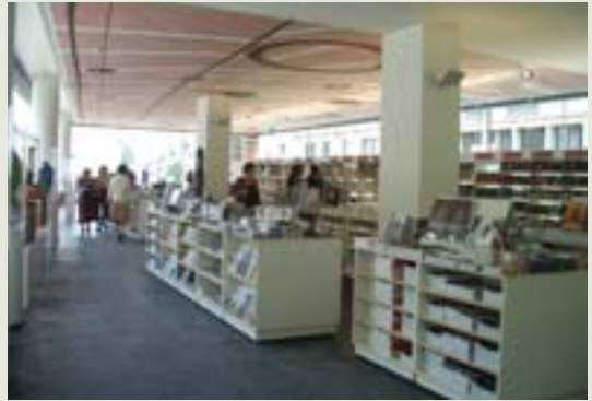
（右上）設計師 Jean Nouvel 邀請了澳洲原住民藝術家們為由法國國立博物館聯會（Réunion des Musées nationaux）所經營的書局及禮品店和修復中心彩繪天花板。