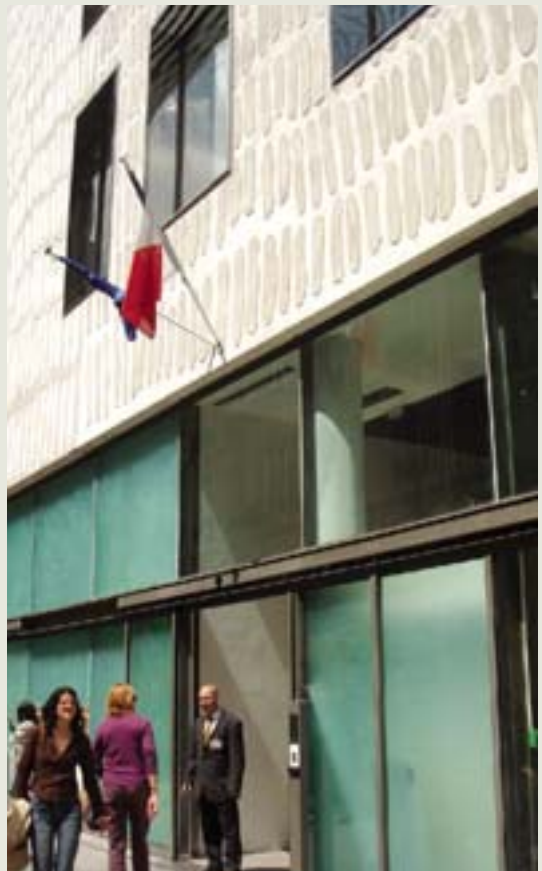
牆面與窗台邀請了八位澳洲原住民藝術家設計圖案。