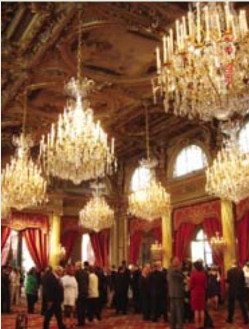
(右上) 法國總統席哈克 (Jacques Chirac) 與聯合國秘書長安南 (Kofi Annan) 於二〇〇六年六月二十日在為蓋布朗利博物館共同開幕。