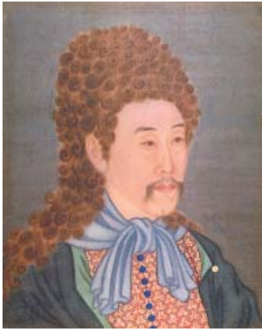
圖九 雍正半身西服像 北京故宮藏