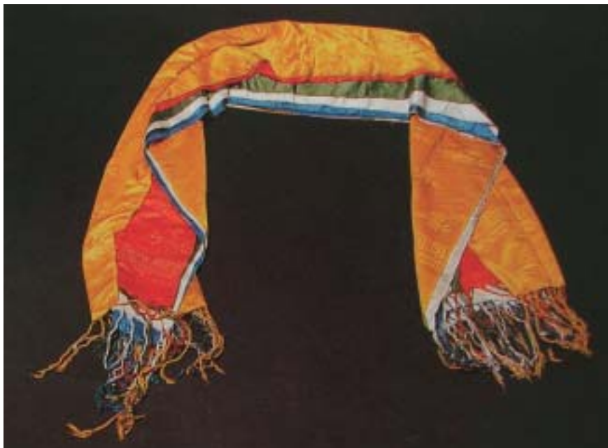
圖七 哈達 北京故宮藏

其一，它詳細記錄活計的來龍去脈，提供翔實的創作動機、設計理念、評點過程，甚至製作流程，使得藝術品的研究不流於看圖說話的主觀論述，對查考清朝宮廷文物，各類活計製作與特點，及研究宮中文化藝術的發展，提供真切生動的記