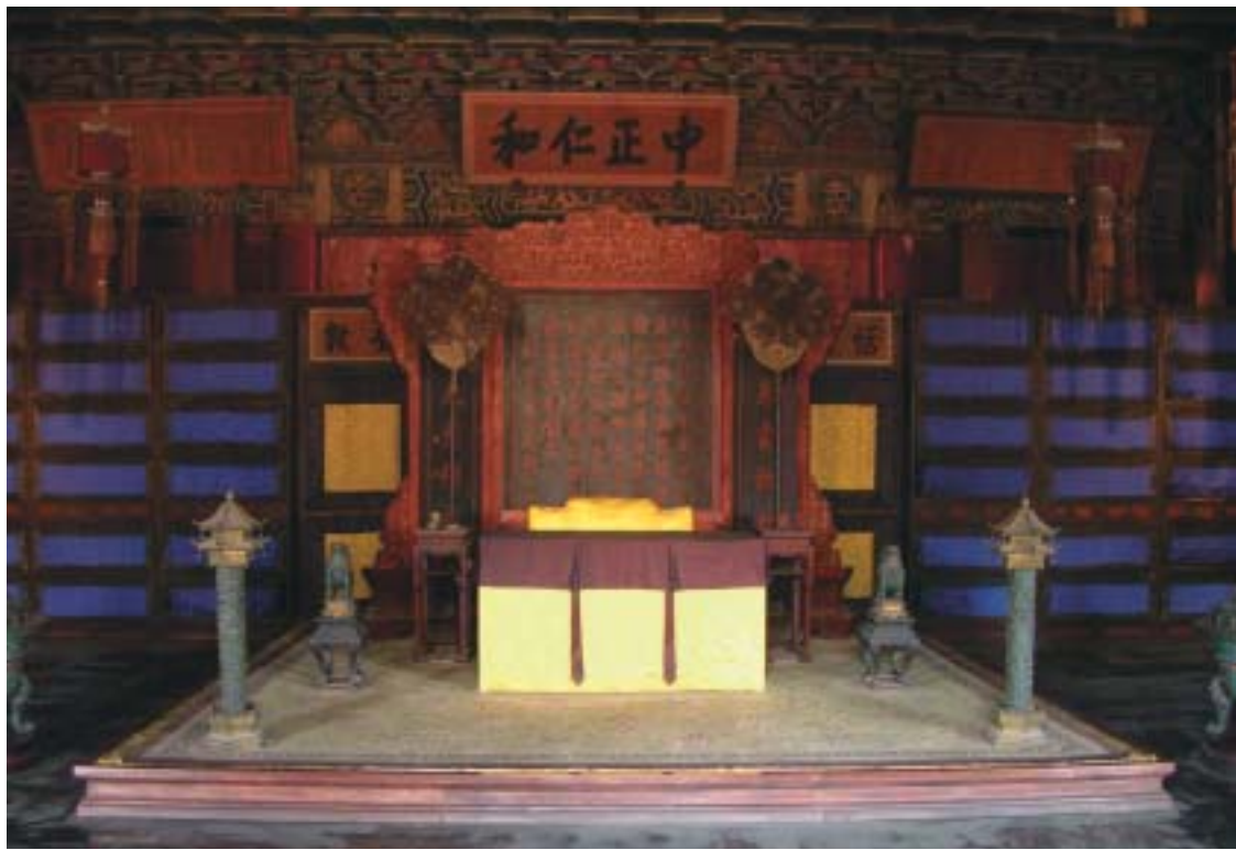
圖一 養心殿現況。

果，將居住在張家口外的察汗喇嘛，因饑荒前來投奔的蒙古人，連同副都統瞻岱等進的新平口外蒙古人等，共六百零五人。將其中五百零五人，編成三個佐領，交由額駙策凌收管；剩下的七十人賞給喀爾喀公密什克，三十人賞給一等台吉丹津，並「按戶給予牲畜，以資活計」，這裡的「活計」便是生計之意。