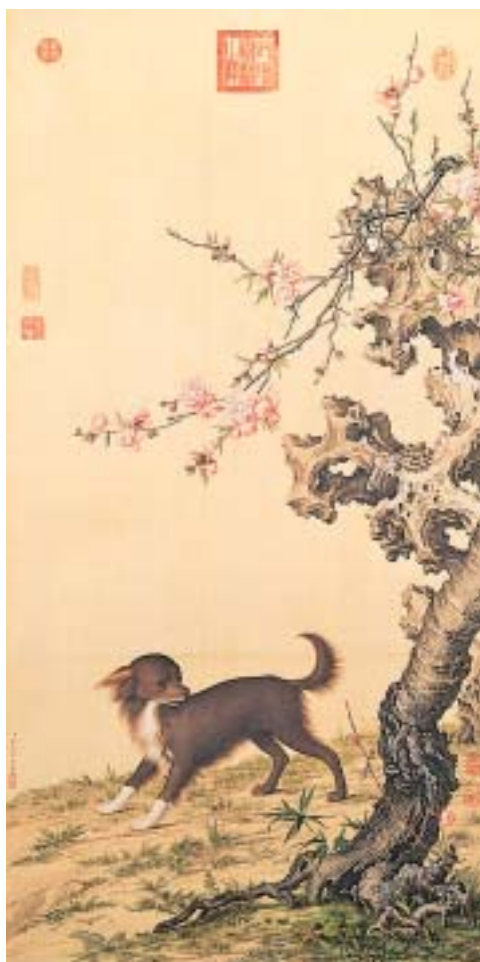
圖五 郎世寧 仙底花龍圖 國立故宮博物院藏