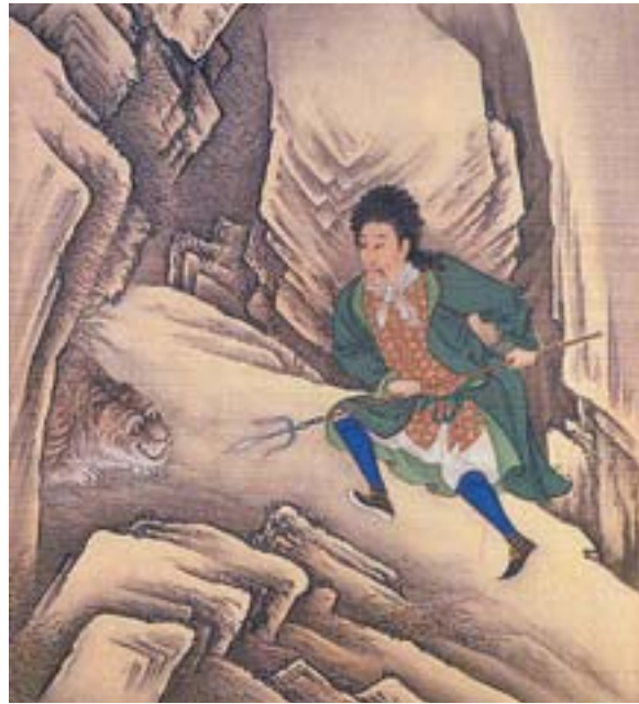
圖八 雍正行樂圖 北京故宮藏

（圖八）另一幅〈雍正半身西服像〉，畫中雍正皇帝頭戴西洋捲金長假髮，頸脖子上圍著領巾，一付西洋人的模樣。（圖九）此二幅為慎靖郡王允禧所畫，這並非允禧想像繪成，而是直接描繪。活計檔中有一則雍正皇帝傳做西洋鬍子的記錄，雍正十三年七月二十九日，傳旨：「著做像西洋人黑鬍子一件。」（《活計檔》雍正十三年七月二十九日，〈匣作〉）雍正皇帝令匠役做西洋人黑鬍子，而且要「像」才行，反映雍正皇帝對西洋玩意的接受度很高，玩過變裝活動，願意讓允禧畫下他的變裝秀，才留下這二幅裝扮西洋人的畫像。如此新潮前衛、活潑生動的雍正皇帝，是過去難以想像的形象。