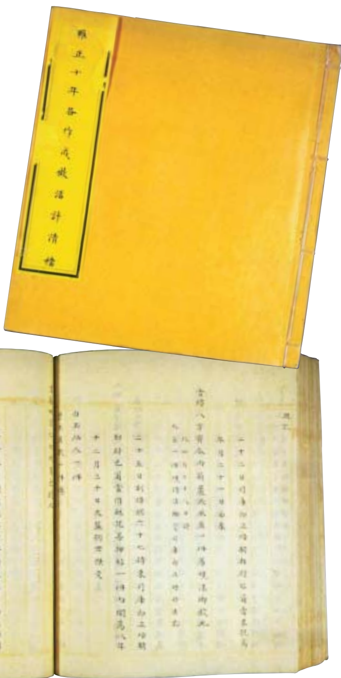
圖二、三 《內務府各作成做活計清檔》封面、內頁。

的活計檔可能因初創之故，尚未完全成熟定型，有些作坊未單獨記錄，而是附於某作記錄後。例如清宮玻璃廠成立於康熙三十五年，到雍正朝時已有一定的規模與工藝水準，但雍正元年至四年玻璃活計並未單獨記錄，而是抄錄於玉作之後，直至雍正五年才將燒造玻璃廠獨立記錄。另，由於雍正朝活計記檔制度尚在發展中，當時活計房人員將活計作成作隨手登錄於檔冊，時稱為「流水檔」或「底檔」。(圖四)流水檔依四季區分，為〈春季流水檔〉、〈夏季流水檔〉、〈秋季流水檔〉