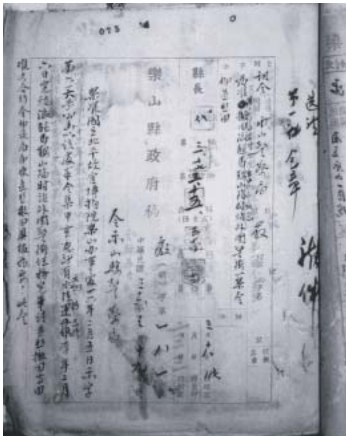
圖二 民國三十六年樂山縣政府令縣警察局撤回派駐警衛公函 現存樂山市檔案館

外，現因任務完畢，應請即飭撤回。相應一並函達，即希查照為荷。此致樂山縣政府。國立北平故宮博物院樂山辦事處啟（蓋章）。（民國）三十六年二月五日。