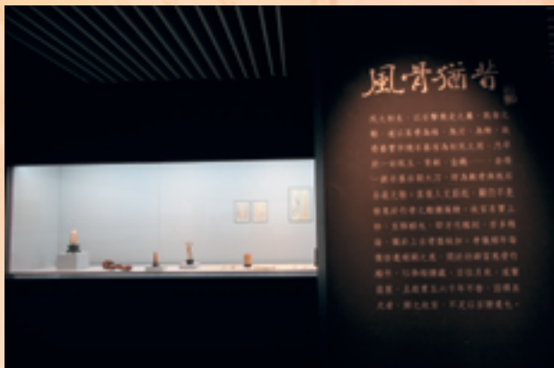
「玉丁寧館紀念展」展場一隅

於二〇〇三年十月編印其自篆《千字文》、《九歌》、《司空表聖詩品》一套三冊；二〇〇四年在個展之前，出版《玉丁寧館贖墨》，並蒐錄了其一生具代表性的詩稿，編印了《玉丁寧館詩存》。先生曾自詡「沒有浪費過一天」，我很榮幸能有機會襄助他達成心願，完成了好些他高興做的事，我想這應該是