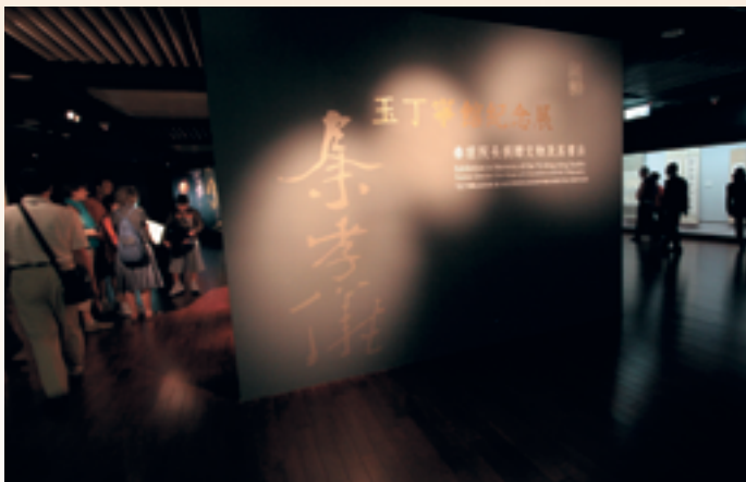
「玉丁寧館紀念展」展場一隅

先生晚年最快慰的事了。 文化是生活的內涵，我成立基金會以來，一直扎根於教育，著力於科技與藝術生活的結合，以提昇文化內涵，達到社會「文化均富」的理念。我一直有一顆效法中國文人風骨氣節的赤忱之心，而孝儀先生正是我欽仰的文人表徵，他的一生為藝術文化的無私奉獻與寬廣包容，留予後人無限的懷念。 藝文界痛失了這位可敬可親的長者，我們緬懷這位文人典範，特地舉辦「玉丁寧館紀念展」，展出先生所捐贈給故宮的部分文物，與商借自家屬的書法作品，希望讓國人再一次濡染先生的文采風範，藉由玉丁寧館的藝術風華、詩文造詣與收藏雅好來追思憑弔，也為他「風骨猶昔」還懷抱「筆力詩心」的一生，畫下完美的句點。 我與先生結緣於故宮，從初識到他辭世，不到十年，我敬之如師如父，能接觸這麼一