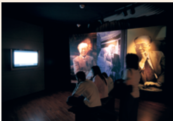
「玉丁寧館紀念展」展場一隅

他的心胸與願景，是我們大家相當敬仰的；他的離開，代表著一代典範博物館人的逝去，也是我們大家相當不捨的。我真心地企盼，國立故宮博物院可以在秦前院長擘畫的基礎上，不斷茁壯，得到他老人家永恆的庇祐，胸懷天下，日新又新。