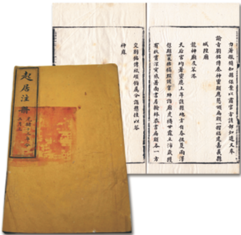
《光緒朝起居注冊》關於賜匾笨港天后宮的記載 國立故宮博物院藏