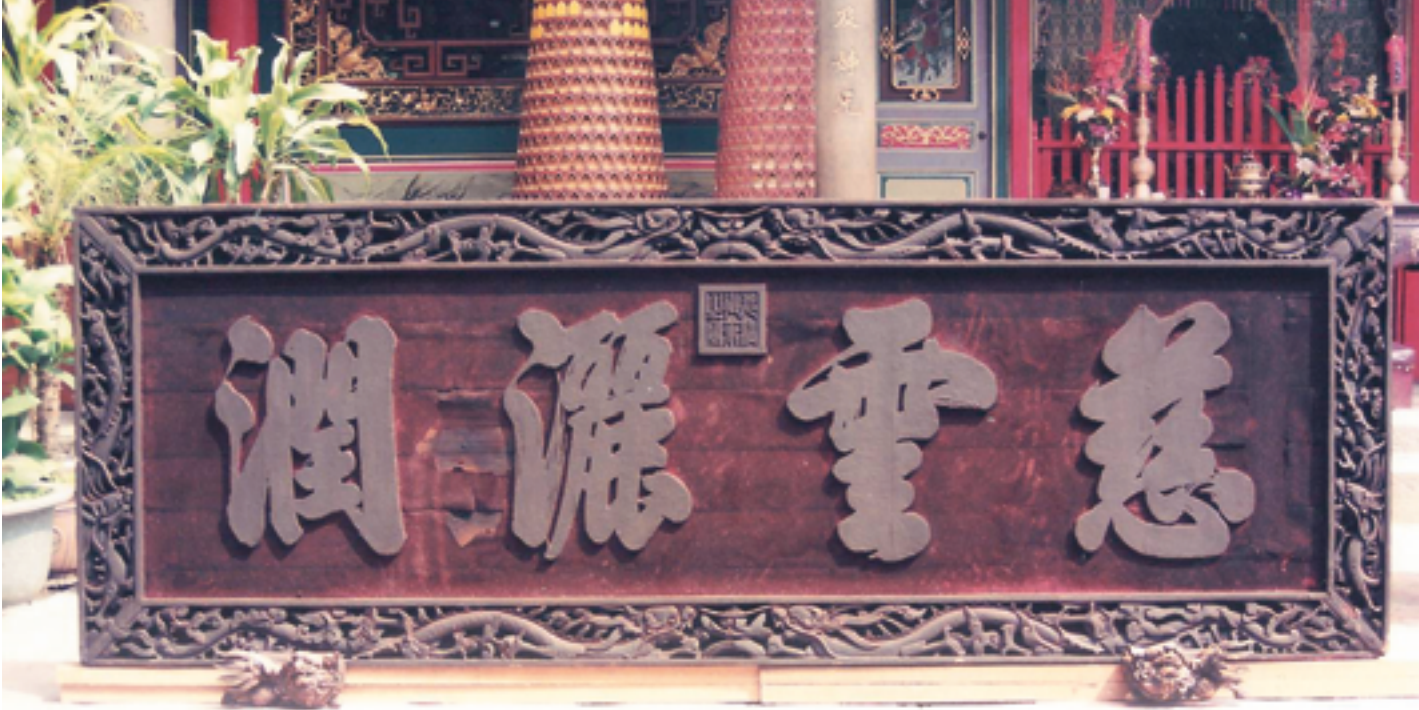
懸掛於北港朝天宮正殿內的「慈雲灑潤」匾