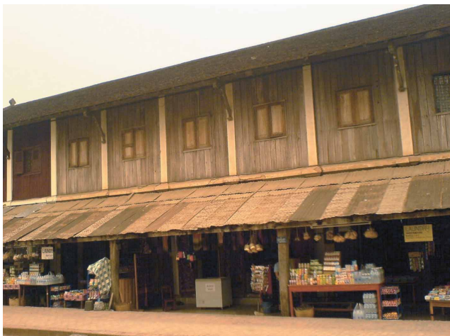
圖十三a 龍坡邦的中國商店街 東南亞的華人以從商為主，龍坡邦就是很好的例子，在過去，當地人以農為業，商人幾乎都是華人。

的發展階段（圖十一）。 此行所參觀的聚落遺址，我想以被聯合國教科文組織（UNESCO）列為世界文化遺產的龍坡邦古城聚落保存維護計劃為例來說明。龍坡邦是一個沿著河建造的城市，北邊有另一條河（Nan Gang）在此與湄公河會合，有地理位置上的優勢。 〔註六〕 龍坡邦是鄰近區域最大的聚落，當其成為一政治權力中心時，需要發展擴張其腹地來支持更多人的食衣住行所需。現今龍坡邦聚落的發展由幾個部分組成，原有居民的住家通常是位於稻田中央的干欄式建築，以木材及竹子來建造，居民大多從事農業生產，平常由小路通往河岸對外交通（圖十二）；後來遷入的華人主要是來自雲南的商人，沿著主要通道建立商店街及住家，掌握大多數的財富（圖十三a）；後來抵達龍坡邦的法國人，他們來到時聚落已被來自雲南的回人燒毀殆盡，法國在寮國的殖民政府重建龍坡邦作