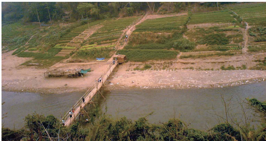
圖十二 當地原住居民穿過稻田中的小徑，通往河岸對外交通。施靜菲攝

的發展階段（圖十一）。 此行所參觀的聚落遺址，我想以被聯合國教科文組織（UNESCO）列為世界文化遺產的龍坡邦古城聚落保存維護計劃為例來說明。龍坡邦是一個沿著河建造的城市，北邊有另一條河（Nan Gang）在此與湄公河會合，有地理位置上的優勢。 〔註六〕 龍坡邦是鄰近區域最大的聚落，當其成為一政治權力中心時，需要發展擴張其腹地來支持更多人的食衣住行所需。現今龍坡邦聚落的發展由幾個部分組成，原有居民的住家通常是位於稻田中央的干欄式建築，以木材及竹子來建造，居民大多從事農業生產，平常由小路通往河岸對外交通（圖十二）；後來遷入的華人主要是來自雲南的商人，沿著主要通道建立商店街及住家，掌握大多數的財富（圖十三a）；後來抵達龍坡邦的法國人，他們來到時聚落已被來自雲南的回人燒毀殆盡，法國在寮國的殖民政府重建龍坡邦作