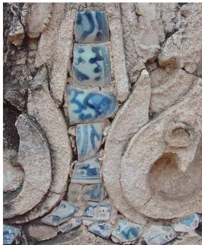
圖十 大城 Wat Mahathat 用十六到十七世紀的中國青花瓷破片來拼貼裝飾