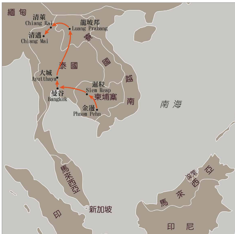
圖二 行程地圖 蔡奇材電腦繪圖