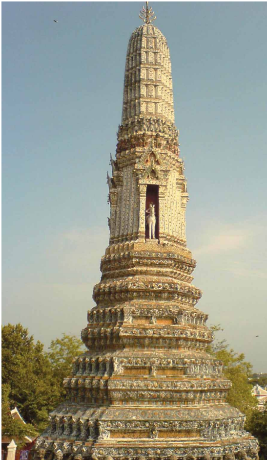
圖十一 曼谷 Wat Arun 建築裝飾 以陶瓷做建築外觀裝飾聞名的光明寺，近看的話會發現其陶瓷拼貼有好幾種方式，例如以各色陶瓷片加上青花破片拼貼，或是直接將陶瓷盤嵌坎在牆面上。