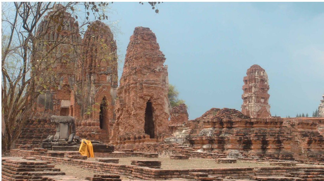
圖十四 大城古城區寺廟群

格建築（圖十三b）。這也是你走在龍坡邦時會發現有兩種道路系統的原因，小通道為原住民的道路系統，主要道路則大多是法國人所建造。目前該地的文化遺產保存與維護計畫由 Ela Maison du Patrimoine 文化遺產中心來推動執行，一方面延請專業人員努力研究傳統工法，並運用舊有材料來翻修老建築及道路；一方需面對文化遺產保存與當地居民在現代化衝擊下亟欲在生活品質上與時代接軌的衝突，其中如溝渠及道路的修護及路燈設置等，主要以輔導及協商的方式與居民溝通，一起努力在兩者之間取得妥協及平衡。