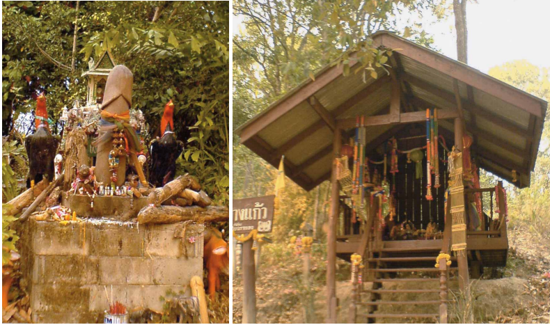
圖五 泰北Payao地區，位於清邁往清萊的路上，陽具、地方神祇與佛像一起被膜拜。