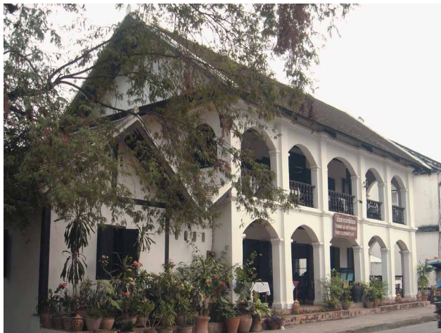
圖十三b 龍坡邦主要道路兩旁的法國殖民地式建築