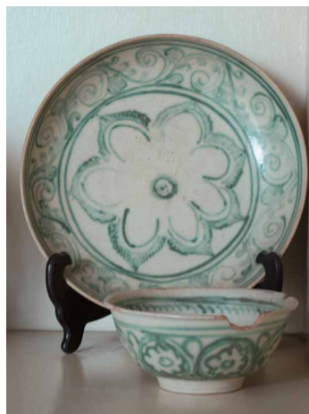
圖十六 緬甸的白釉綠彩陶器