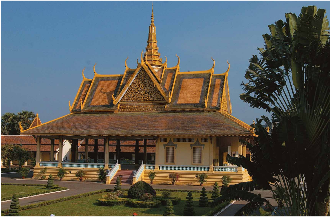
圖三 金邊皇宮 金邊皇宮是我們一下飛機後就參訪的第一個地點，可說是為此次的東南亞藝術啓蒙之旅拉開序幕的重要開場白，皇宮屋頂長長的Naga讓人印象深刻，接下來像Naga這樣來自印度的宗教圖像即不斷地出現在我們四週。