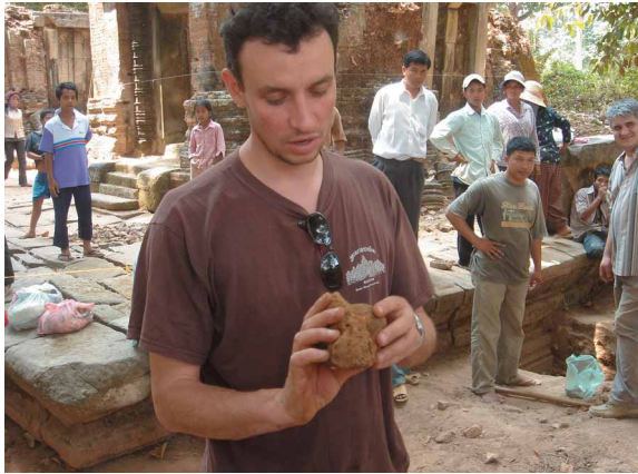
圖八 Prei Monti遺址 遺址的考古工作人員給我們看剛剛出土的陶瓷小罐