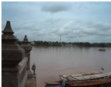
阿比查邦·魏拉希沙可 APICHPATPONG WEERASETHAKUL 參展作品《亞洲魂》

一九七〇年生於泰國，擁有建築學士背景與視覺藝術出身的年輕導演；九九年自創「踢動機器」製片公司。上一部作品〈熱帶幻夢〉(Tropical Malady) 得坎城評審團大獎之後，於去年特別受邀出席鹿特丹影展。今年其兩件作品正在