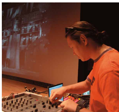
「靜默之聲」之「大都會」由DJ Stingray現場詮釋 2006年9月

參加這次展覽的藝術家來自世界各地，對策展人戈揚來說：這些已具國際展覽經驗的導演或藝術家們，必需能自信在一個電影的文本下，在美術館及電影這兩個領域，同時展出他們的作品或概念。這些電影工作者都必需有製作電影和裝置藝術的經驗，也要具備進