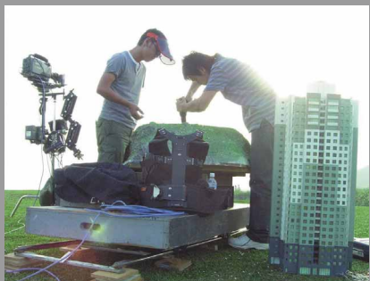
愛拉·萊德ELLA RAIDEL 創作情形

當代美術館參加當代藝術展之外，還有陸續其它五個以上的展出。包括：國際鹿特丹影展；雪梨影展；國際電子藝術節；國際媒體藝術雙年展；澳洲國家美術館；雪梨博物館；雪梨當代美術館；墨爾本實驗媒體藝術節：等等。