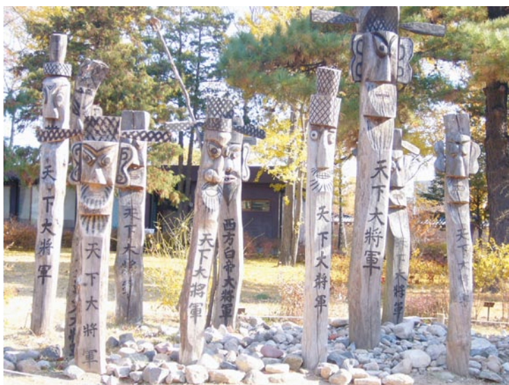
國立民俗博物館館外景觀