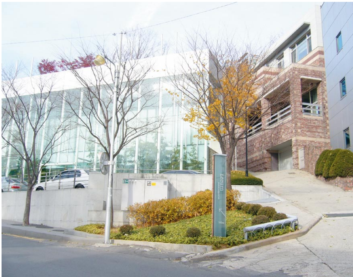
韓國三星Leeum美術館周邊美麗的建築及景觀

的主要作品等（三星Leeum美術館網址）。 Leeum美術館之組織編制包括文化資產保護協會、藝術與社會研究室、修復及保存科學研究室、行政部門、傳播部門等。入館採收費制，成人每人為一萬韓元（約台幣三百六十元），青少年（三至十八歲）為六千韓元（約台幣