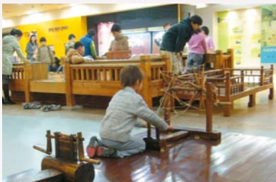
韓國國立民俗博物館兒童館內的體驗活動

韓國博物館的發展，從二十世紀初在昌慶宮中的李王朝王室博物館成立開始，其後各地陸續建立博物館。一九六〇年代以後，許多公、私立博物館先後成立。一九八〇年後，政府在文化政策上大力支持，博物館的發展益發多元與專業。以韓國首都首爾市(舊稱漢城)政府所提出的「願景二〇一五—首爾文化城」十年綱要計畫(Vision 2015, Cultural City Seoul)為例，在城市競爭的前提下，韓國政府投入高額經費，除計畫進行全面城市改造外，並計劃形塑首爾為具有豐富文化的城市，發展高品質的文