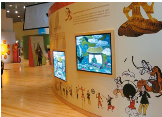
國立中央博物館兒童館內