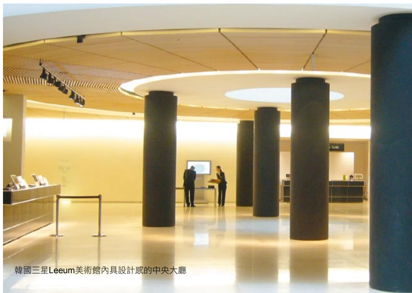
韓國三星Leeum美術館內具設計感的中央大廳

的主要作品等（三星Leeum美術館網址）。 Leeum美術館之組織編制包括文化資產保護協會、藝術與社會研究室、修復及保存科學研究室、行政部門、傳播部門等。入館採收費制，成人每人為一萬韓元（約台幣三百六十元），青少年（三至十八歲）為六千韓元（約台幣