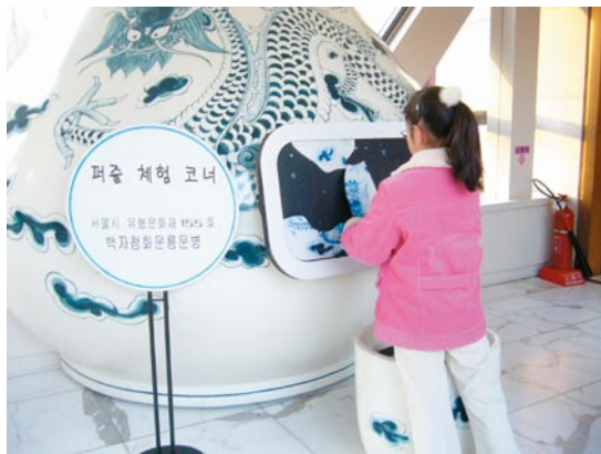
首爾市立歷史博物館兒童之數位體驗學習

國立民俗博物館、首爾市立美術館等國家級及地方級博物館中，多設有專為兒童所設計的兒童館區，其中尤以國立中央博物館的兒童館最為特殊，不僅面積夠大且主題豐富，設計活動生動有趣，利用電腦等科技方式進行展示設計，使兒童產生興趣，並利用互動學習手法達到「遊戲中可學習，教學中可遊樂」的感官刺激。館內並特別設置拍照區提供學童進行角色扮演，設計傳統音樂體驗區、傳統拳術教學區使兒童可以對著銀幕練拳等，促使兒童體驗傳統文化並啟發孩童的思考能力，學童動手體驗記憶學習，成效十分可觀。三星文化基金會並專設一座「三星兒童博物館」，提供低年級兒童使用，十分受到學校及家長的重視。