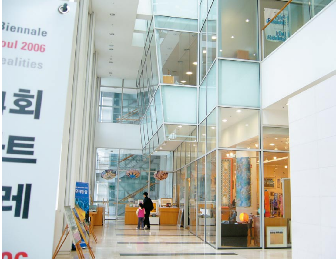
首爾市立美術館內部新舊建築間明亮舒適的服務空間