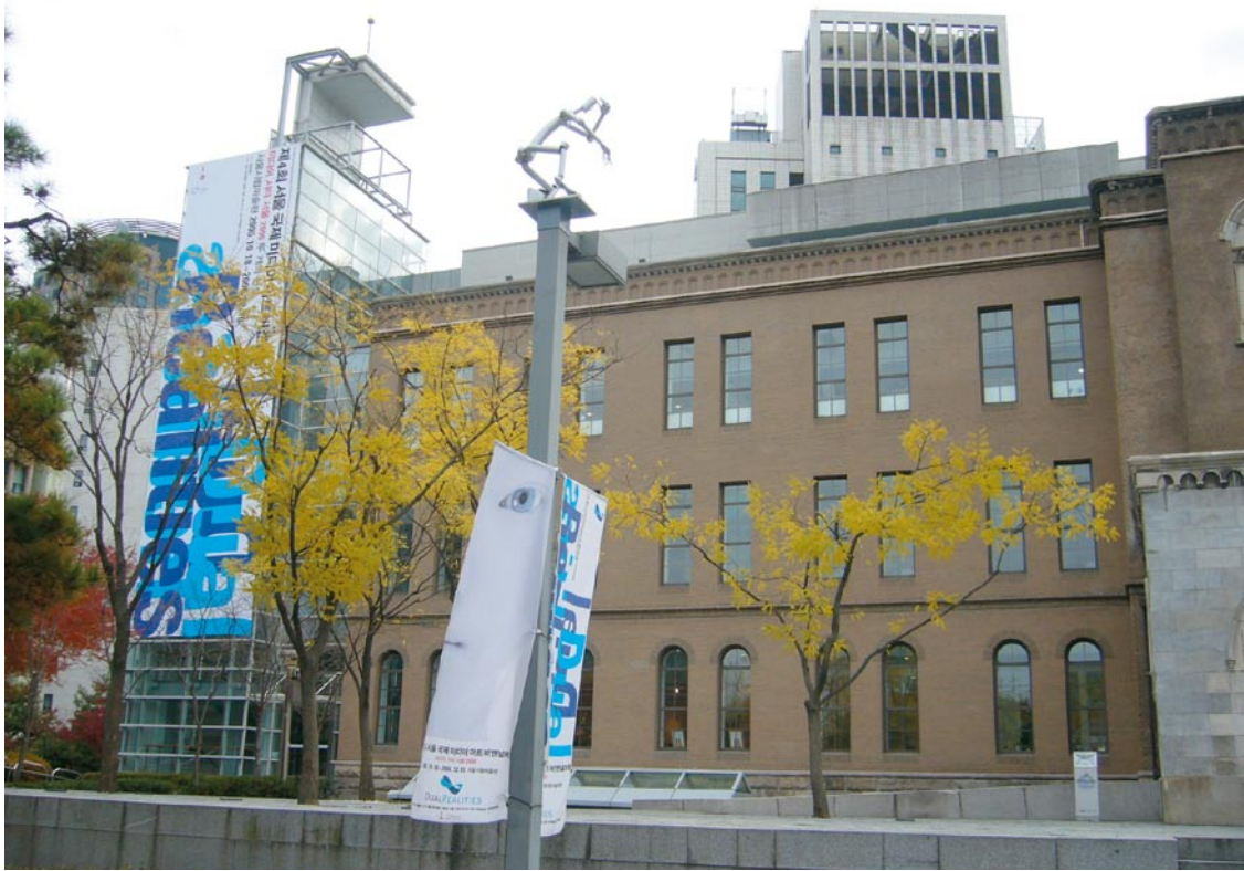
首爾市立美術館新舊建設整合十分成功