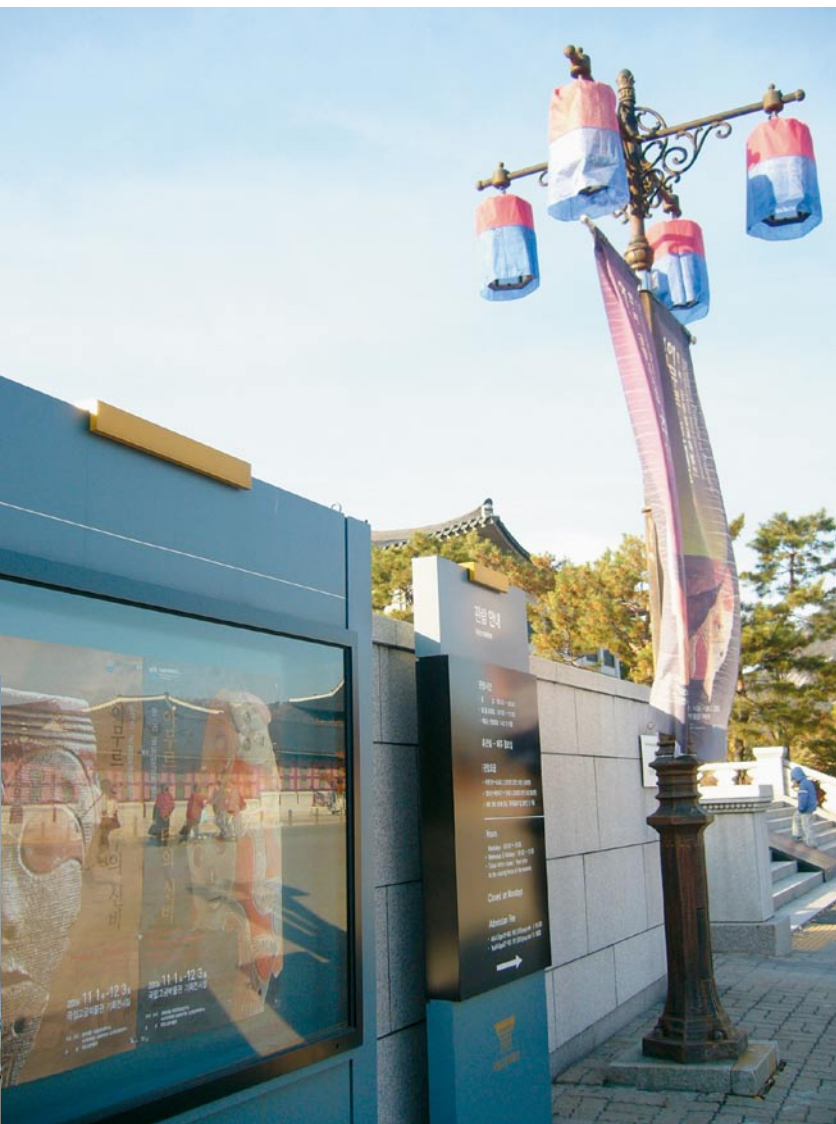
韓國國立故宮博物館前告示牌