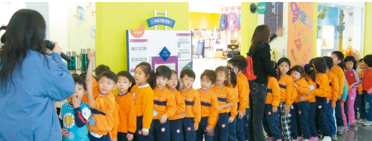
三星兒童博物館學童參觀情景