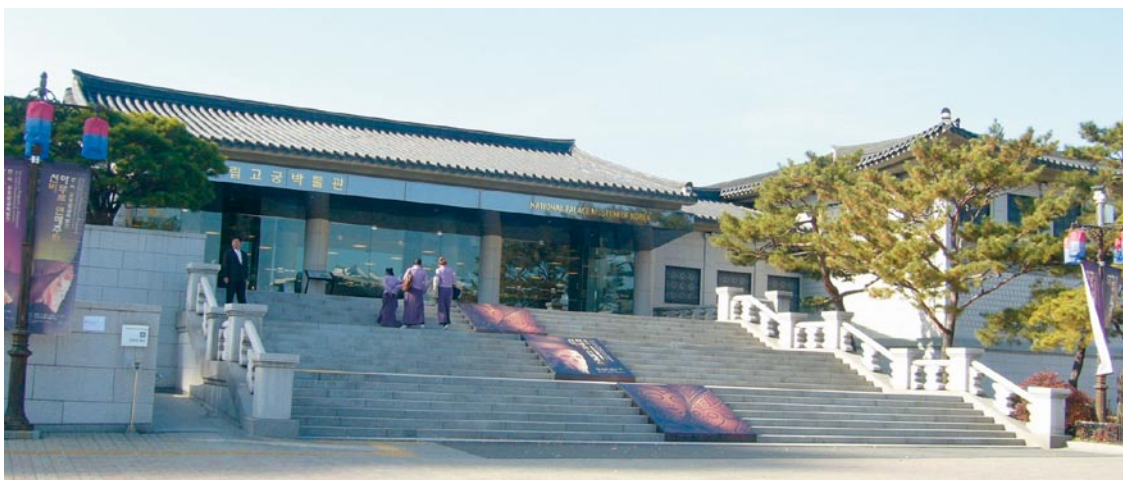
韓國國立故宮博物館外觀

該館原為一九〇八年純宗皇帝在昌慶宮內建立的皇室博物館，其後曾先後改稱為李王家博物館、德壽宮美術館、德壽宮事務所、宮中文物展示廳等，二〇〇四年時成立「朝鮮王室歷史博物館推進團」，二〇〇五年確定博物館名稱為「國立故宮博物館」，並於二〇〇五年八月正式開館。藏品為朝鮮時代王室及大韓帝國皇室文物，數量約有四萬餘件，包括玉璽／禦冊、儀軌、文書、祭器、樂器、科學器械、武器、金屬工藝品、陶瓷器、服飾、裝飾品、傢俱、扁額等，佔地面積二九九八六平方米，展示面積六九七五平方米。其常設展廳展示主題為帝王紀錄、宗廟祭祀、宮廷建築、科學文化、王室生活等（韓國國立故宮博物館網站資料）。