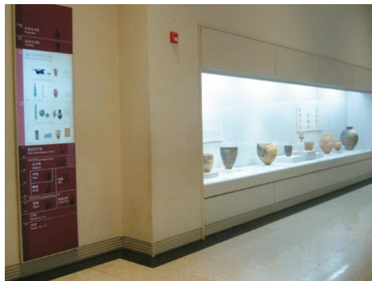
國立中央博物館展示室內各處均置放年代表供觀眾隨時參考

命名為「Leum」，是結合了博物館的的創辦人「Lee」的姓，以及「museum」當中「um」的縮寫而成，由三星文化基金會創辦，展出三星文化基金會之蒐藏品。其建館目的是促進韓國首都首爾成為世界的文化中心，絲路、新藝術及文化的節點，並傳播韓國最新的藝術潮流。