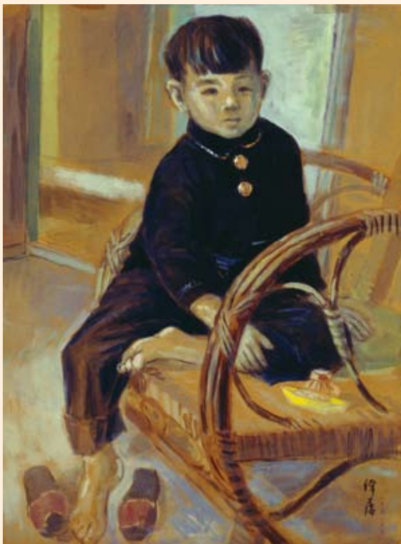
1. 小憩（稍息） 73x54 cm 1956