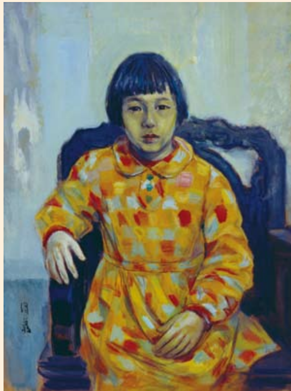
2. 小妹 74x55 cm 1957

光線在人物的陰陽面作了不少文章，畫家也不負所託，表現得極細密貼切。人物的位置並非像一般常見的置於中央，而是面朝向左前方，靠近畫者極近，因而截去雙腳的描寫。倒是背景處理得很仔細：瓶花、石膏像、畫作，甚至小椅子的一角，一如他寫生時的徹底態度。小椅角原本無甚重要，但站在平衡畫面的觀點上看，則不可或缺。