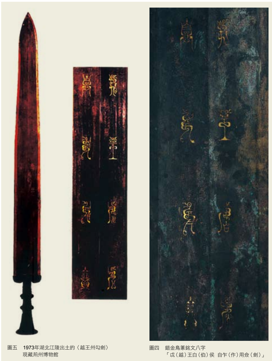
圖五 1973年湖北江陵出土的〈越王州勾劍〉 現藏荊州博物館