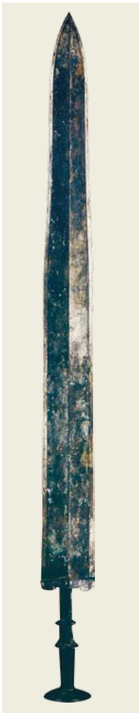
圖一 越王伯侯劍 私人收藏