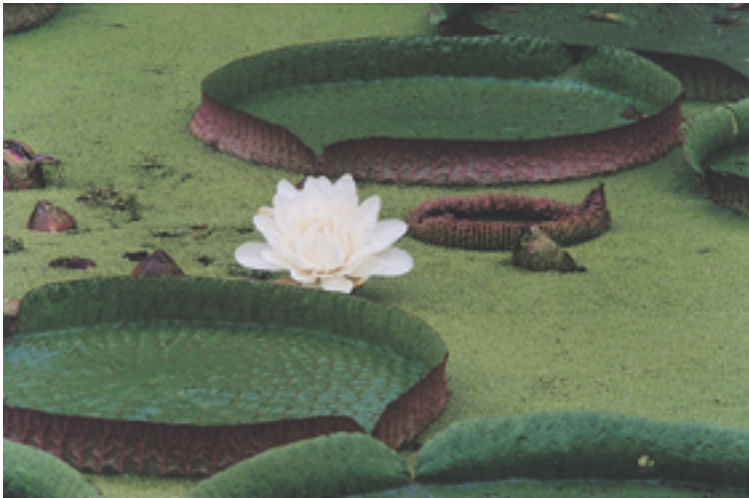
至德園的大王蓮一如每年春天的牡丹展，都曾是觀眾難忘的體驗。