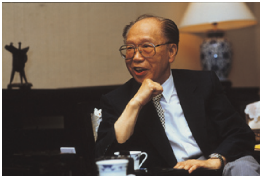
秦院長的辦公室一直布置得古雅精緻。