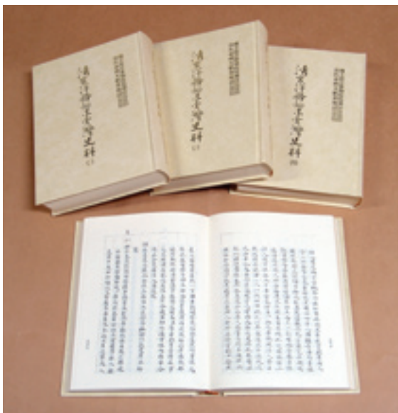
故宮出版的台灣文獻史料，代表秦孝儀先生在台灣史研究上推動之功。