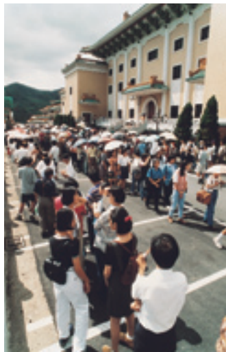
羅浮宮展覽時排隊的人潮。秦院長持續推動與國外著名博物館的交換展。