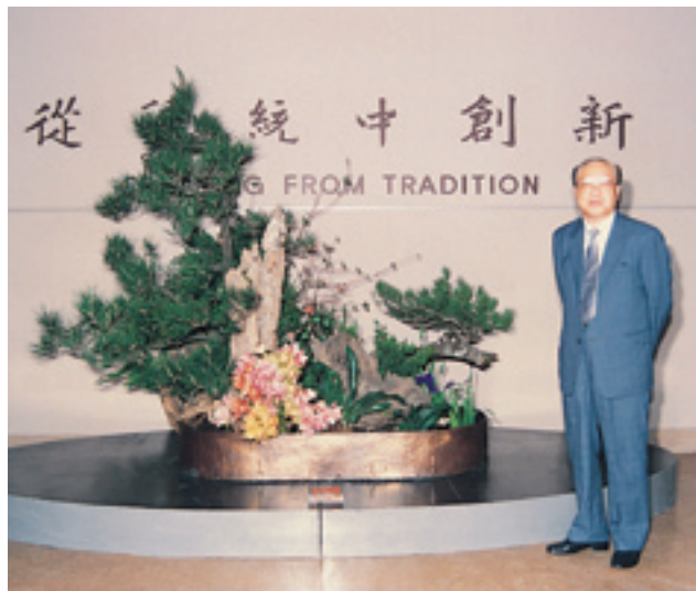
從傳統中尋找創新的泉源，是秦院長闢近代館的方向。