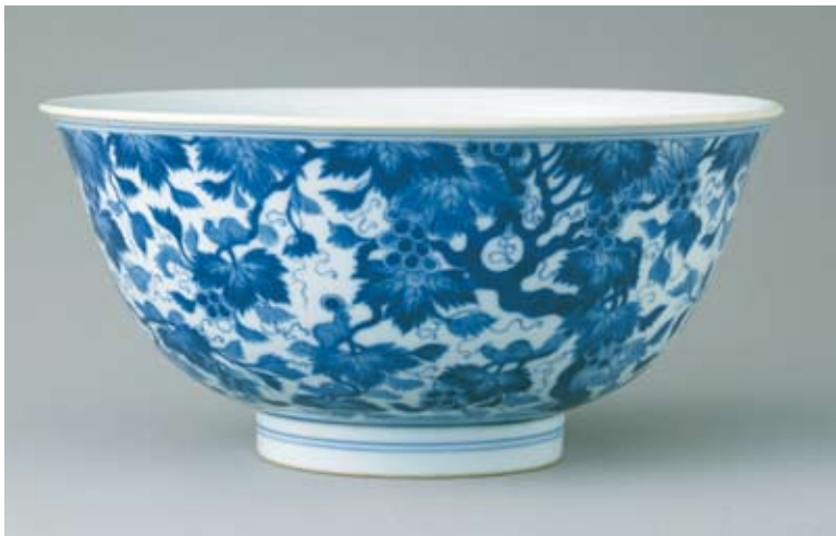
清 乾隆 青花葡萄松鼠圖碗 國立故宮博物院藏

南語中的俚諺，生動傳神，雅俗共賞。十二屬相中的「鼠牛虎兔」湊起來，可以比喻無理取鬧。老鼠，閩南語叫做鳥鼠。「狗咬鳥鼠」，就是狗拿耗子，比喻白費力氣，徒勞無功。格言諺語中常說：「鳥鼠過溪人人喝扑」。「虎頭蛇