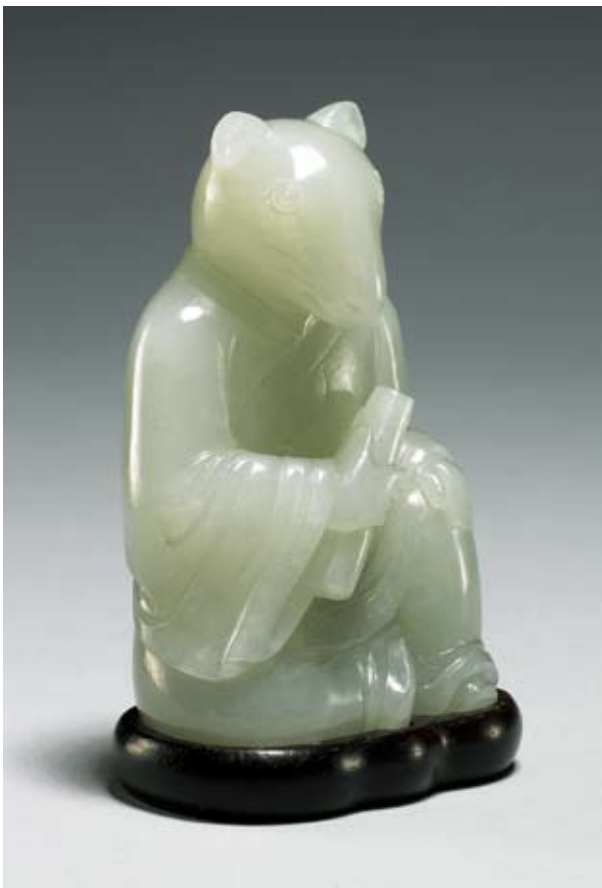
清 玉十二生肖像—子鼠 國立故宮博物院藏

的肖鼠，黃久約生於子年，他的生肖，就是鼠，鼠銜明珠，有吉兆。黃久約生性友悌，為文典贍，官至諫議大夫。金章宗即位，授橫海軍節度使。