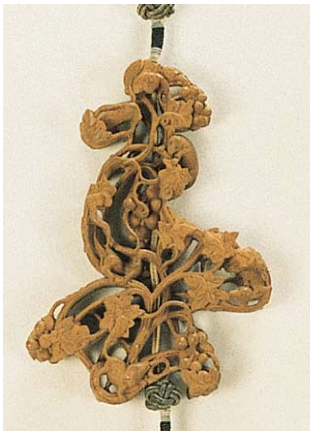
清 檀香木鏤空松鼠葡萄春字珮 國立故宮博物院藏