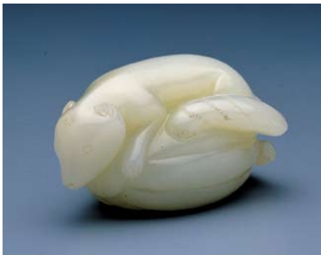
清 玉松鼠瓜式盒 國立故宮博物院藏

為政者徵斂苛稅以致人民離析之詩，但也表達了農人對鼠害的無可奈何。正史中對老鼠危害莊稼的記載，更是罄竹難書。《新唐書·五行志》記載唐高宗弘道初年，「梁州倉有大鼠，長二尺餘，為貓所嚙，數百鼠反嚙貓。」《宋史·五行志》記載宋高宗紹興十六年（一一四六），「清遠、翁源、真陽三縣，鼠食稼，千