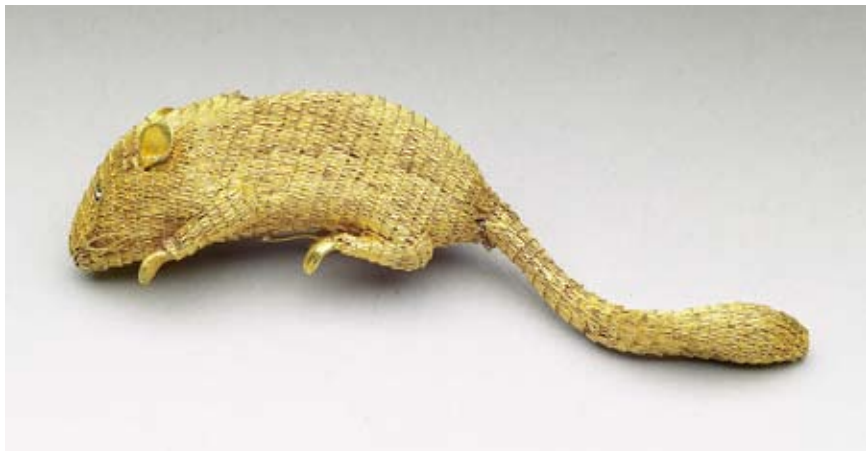
清 金絲鼠 國立故宮博物院藏

內，鳥在外，貓鼠不相害。文學作品，常以鳥鼠為題材。《浪蹟叢談》所載「水落魚龍夜，山空鳥鼠秋」等詩句，虛涵兩意，頗有創見。