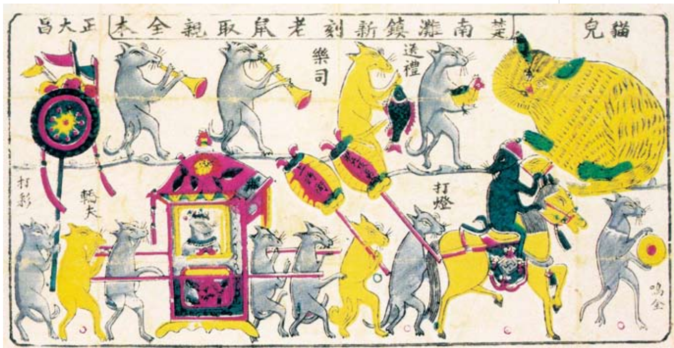
清 老鼠娶親 湖南隆回