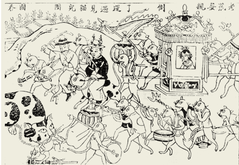
清 老鼠娶親 陝西神木

倒了運，遇見貓兒團圍吞」。看了這些老鼠娶親的年畫，讓我們感覺一股奇怪，而且矛盾的氣氛，古代人們貼上這種老鼠娶親遇上貓的年畫，似乎有「黃鼠狼給雞拜年」的味道，