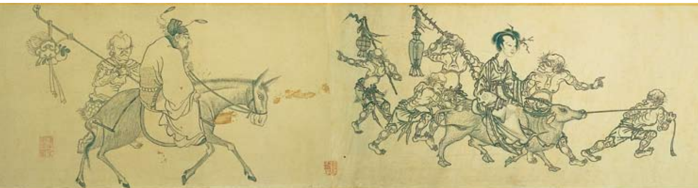
元 王振鵬 鍾馗送嫁卷 局部 國立故宮博物院藏