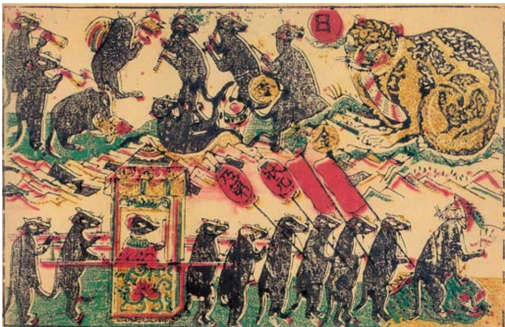
清 老鼠娶親 福建漳州

生龍，鳳生鳳，老鼠生的兒子會打洞」嗎？原來最厲害的就是咱們這些「鼠輩」了，於是決定在眾鼠中選個乘龍快婿，高高興興地辦起了喜事。