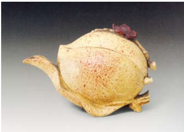
圖七 清 雍正 宜興窯桃式硯滴壺 北京故宮博物院藏