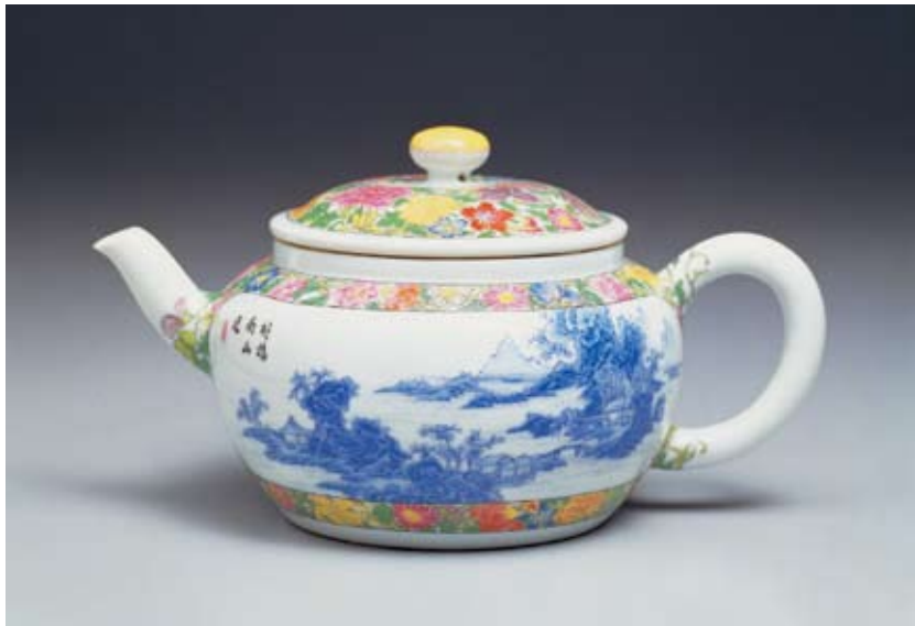
圖十一 清 雍正 磁胎畫琺瑯青山水白地茶壺 全器造型、壺蓋、底邊、流、把皆與年希堯《視學》上的茶壺設計圖相近，應就是依據設計圖稿製作的琺瑯彩瓷壺。 國立故宮博物院藏