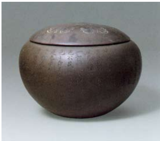
圖十三 清 雍正 宜興窯紫砂刻心經蓋鉢 北京故宮博物院藏