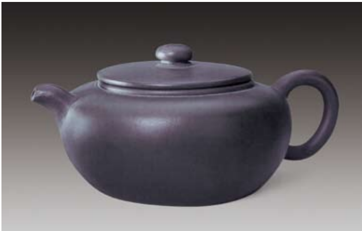
圖一 清 雍正 宜興窯扁圓壺 北京故宮博物院藏