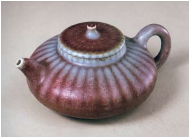
圖十五 清 雍正 鈞釉窯變菊瓣紋茶壺 北京故宮博物院藏