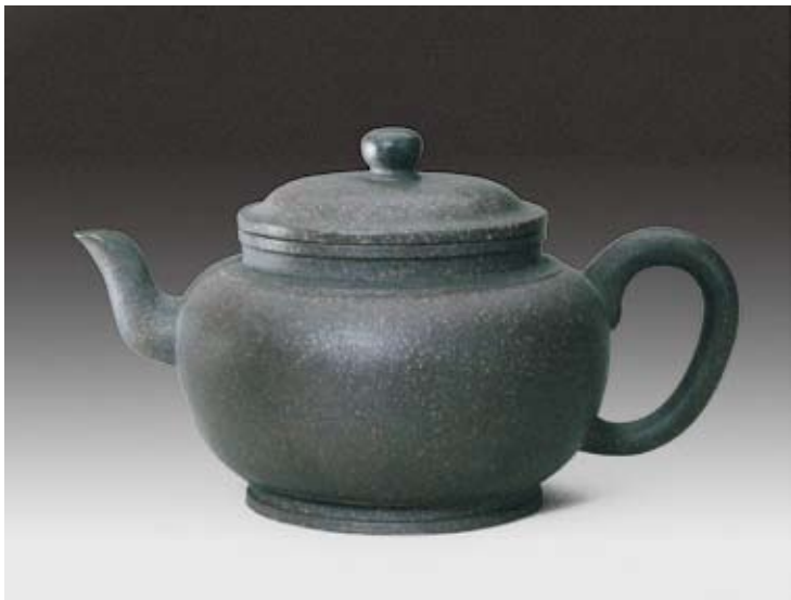
圖十 清 雍正 宜興窯圓壺 北京故宮博物院藏

以說雍正宮廷御用的器物無論何種材質，其式樣和設計風格都有共通性。檔中的「桃式水丞」，二〇〇〇年整理時，根據繁複的雕刻式樣定為乾隆，其後根據另一件帶「雍正年製」四字款的銅胎畫珐瑯雙桃式水丞，與此紫砂水丞造型風格完全一致。據此推翻了原來