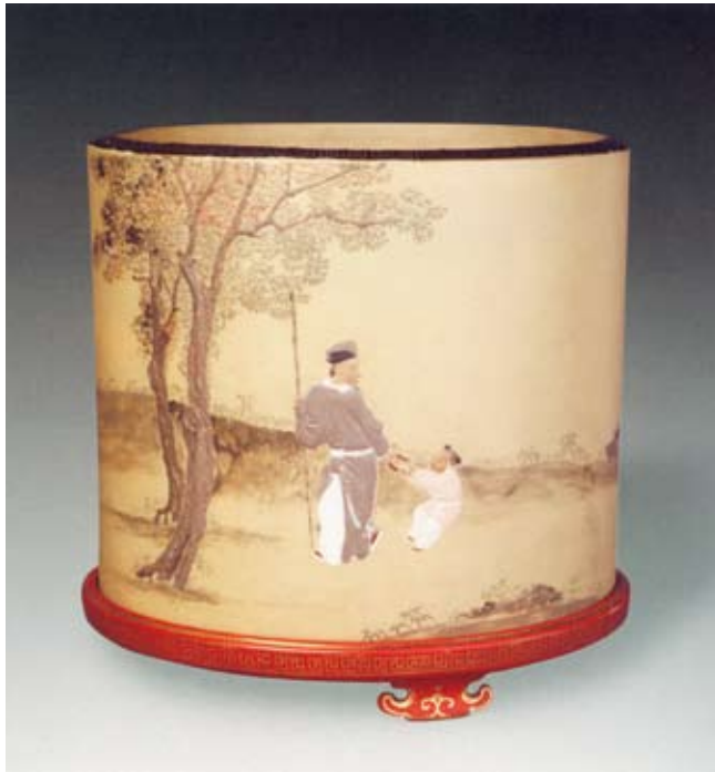
圖五 清 雍正 宜興窯描金彩繪打棗紋大筆筒 北京故宮博物院藏