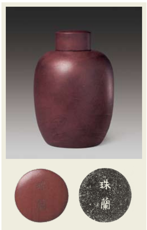
圖四 清 雍正 宜興窯珠蘭銘蘆雁紋茶葉罐 北京故宮博物院藏