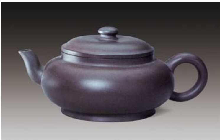
圖二 清 雍正 宜興窯端把壺 北京故宮博物院藏

盛時期，名家輩出，一批符合「雅、秀、精、巧」皇家用器標準的宜興紫砂進入宮廷。雍正對此表現出不同尋常的興趣，屢下諭旨，命工匠把宜興壺的造型照搬到銀器、琺瑯器和官窯瓷器上。宜興紫砂雖然來自民間，但江南地區文人薈