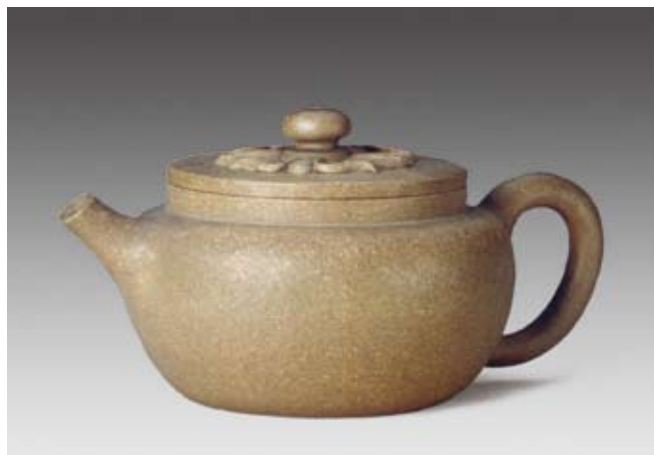
圖十六 清 雍正 宜興窯柿蒂紋扁圓壺 北京故宮博物院藏