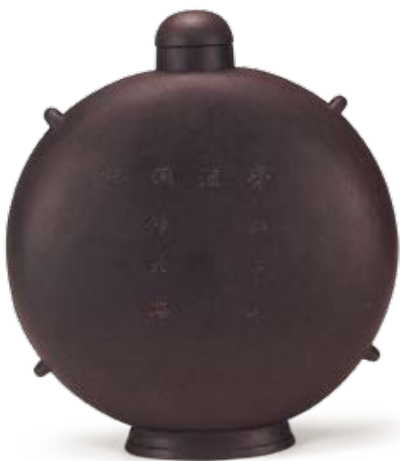
圖八 清 雍正 宜興窯四繫詩句背壺 北京故宮博物院藏

多的無款器中，鮮為人知，品種有茗壺（圖一、二）、茶葉罐（圖三、四）、蓋鉢、大筆筒（圖五）、桃式水丞、描金雲蝠硯（圖六）、硯滴壺（圖七）、花盆等。雍正朝紫砂的發現，彌補了存世雍正宮廷紫砂的空白。