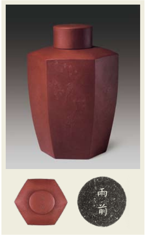
圖三 清 雍正 宜興窯雨前銘花鳥紋六方茶葉罐 北京故宮博物院藏