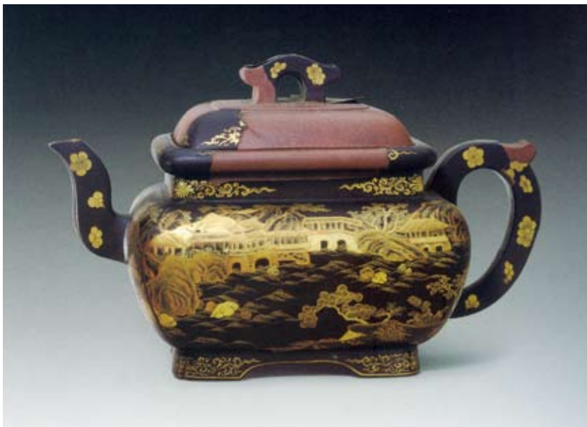
圖十二 清 雍正 宜興窯黑漆描金彩繪方壺 北京故宮博物院藏

收小些做好樣呈覽，欽此。：於十一月二十七日做得木樣四件：宜興壺留下，欽此。（註五） 文中所說的「外畫洋金花紋宜興壺」（圖十二，故