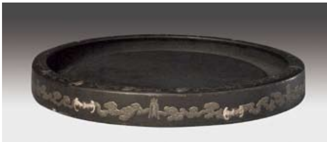
圖六 清 雍正 宜興窯紫砂金漆雲蝠硯 北京故宮博物院藏