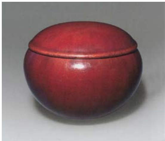
圖十四 清 雍正 仿宜興霽紅蓋鉢 北京故宮博物院藏