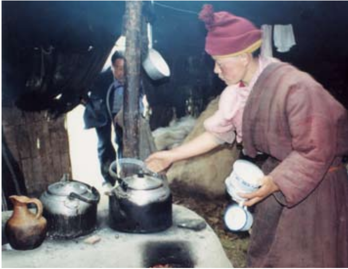
1999年筆者從青海玉樹藏族自治州結古鎮前往四川石渠縣色須寺途中，參訪一座牧民黑帳篷，帳篷女主人熬煮奶茶款待筆者等來自遠方的陌生人；熬茶用的已是現代燒水壺，茶碗也是尋常飯碗，但一隻盛奶的陶器，則樸實典雅。