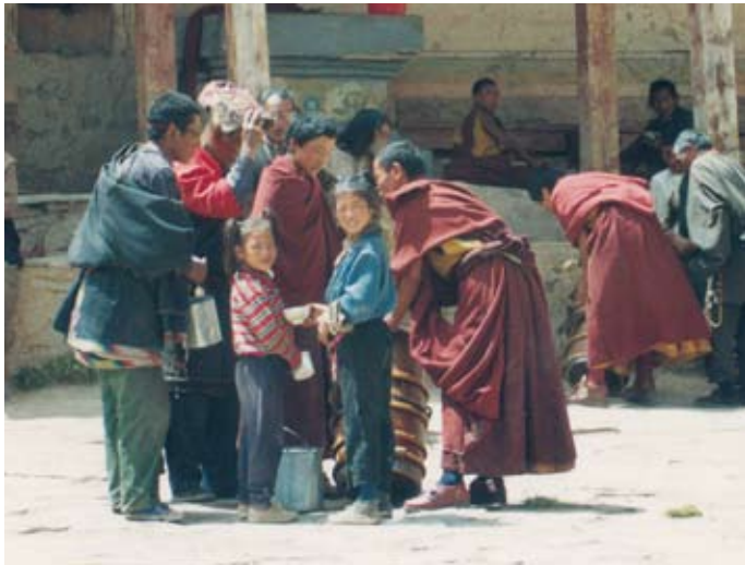
到達色須寺，適逢午餉，寺中喇嘛正提著午膳、茶壺、茶桶佈施。