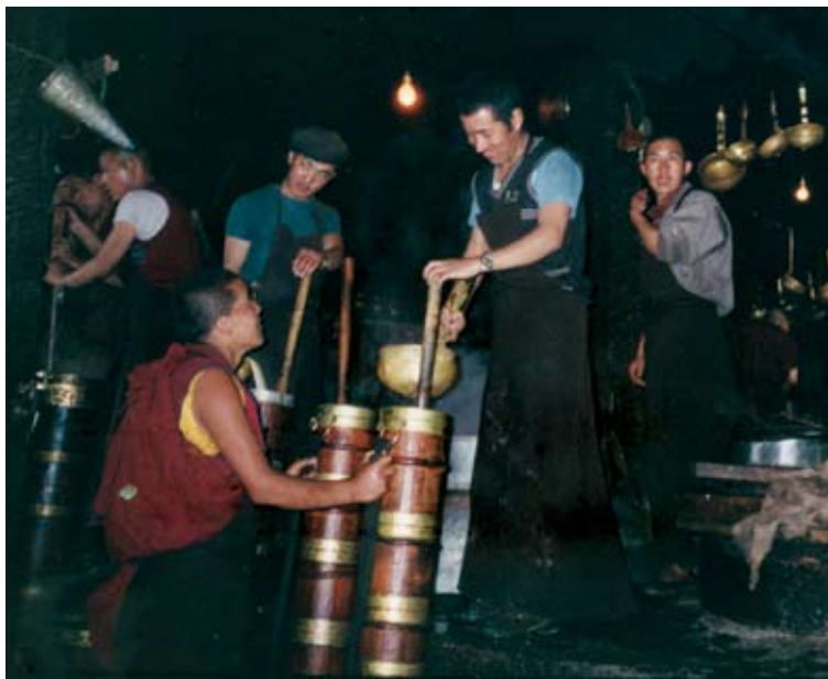
清晨西藏寺廟中僧俗正在熬製酥油茶，供應早課畢之僧眾飲用。

奏摺內容涉及三件事：西藏地方政府最高官員（噶布倫）報告了為皇太后辦理了大型佛事情形；集合了三百位喇嘛在大昭寺、廣法寺與桑耶寺等寺誦經熬茶；前後共二十七天。