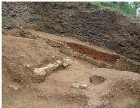
圖七 BG1Y1的窯門和匠台