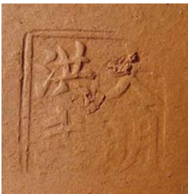
圖二五 「大明洪武」款