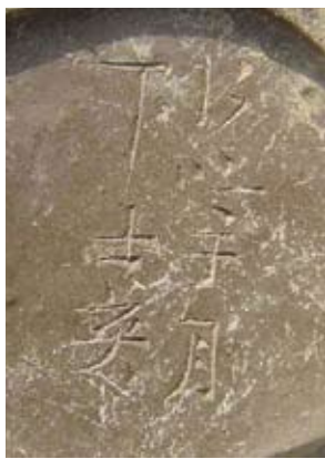
圖二二 「行吟於月下 士英」刻款