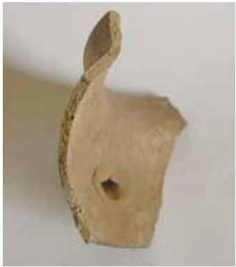
圖四 明代壺流的鉚接工藝