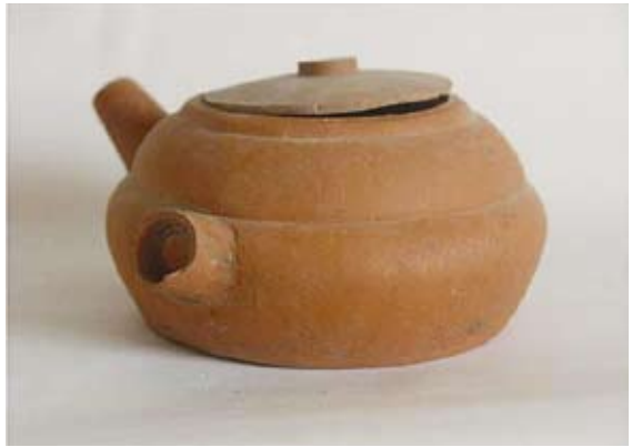
圖十一 磚紅胎穿心鉢