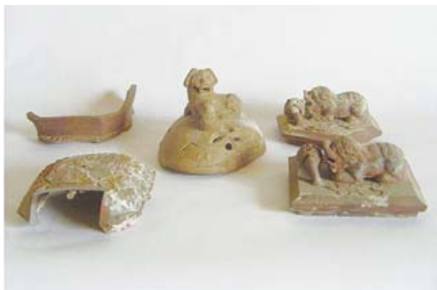
圖十九 外銷的宜興紫砂