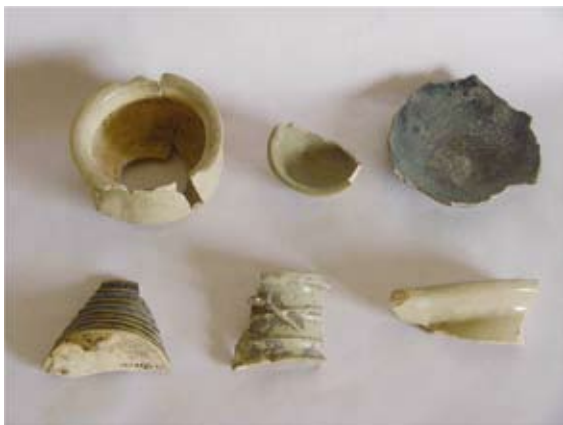
圖十 明末清初的白泥胎均釉產品