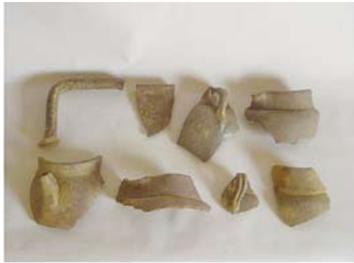
圖三 BG1下層明代標本