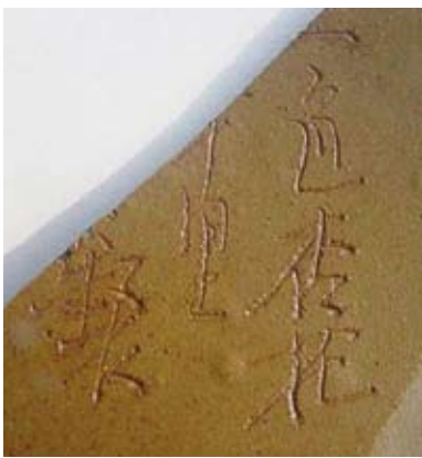
圖二四 「一色杏花紅十里（孟臣）製」刻款