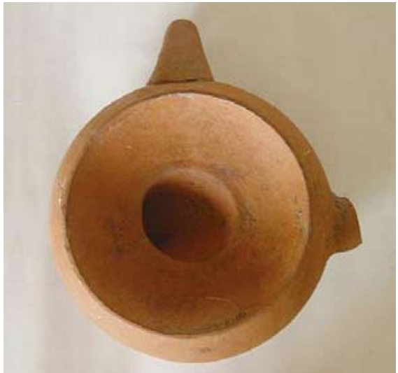
圖十二 磚紅胎穿心鉢（底部）