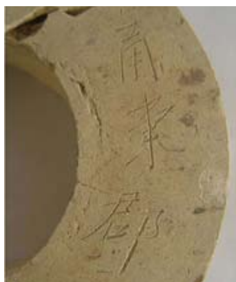
圖十八 軋模上的「甬東郡」刻款

代浙江陶業衰落，宜興陶業興起，甬東制陶者和窯工來蜀山討生活也不足為奇。故宜興有部分「陶者」來自甬東，當不存疑。現在丁蜀地區的鮑姓等家族的一支相傳就來自寧波。至於「非土著也」，則顯武斷了。