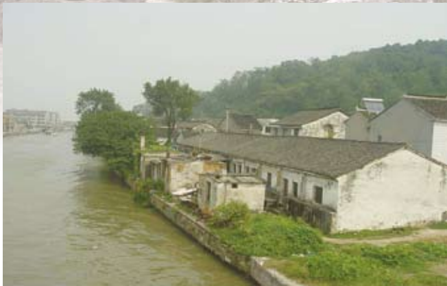
圖一 蠡河、南街和蜀山

丁蜀地區的窯址調查和蜀山窯的發掘始於二〇〇五年春天。上世紀七〇年代，南京博物院和宜興陶瓷公司在曾對丁蜀地區古窯址進行過考古調查。但由於時代久遠和環境變遷，部分窯址已經面目全非。