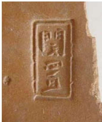
圖二一 「閔置」印章款

在蜀山窯址，紫砂和其他各類產品的燒制沒有明顯區別，大多採用混燒的方法。明代晚期產品主要是較粗的甲泥胎質，未發現白泥胎產品。清代初期，紫砂和白泥有了較為嚴格的區別。從出土標本數量看，清代初期（順治、康熙）紫砂壺產品較少，更多生產白泥胎醬釉罐等生活用具。均釉產品也僅見少量。乾隆開始，紫砂壺、銚等茶具開始大量燒造，均釉產品的品種較為單