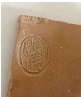
圖二十 「顯爵」印章款

通過和蜀山窯址標本對比，羊角山窯址出土的器物標本 〔註四〕 早到明代晚期，晚至民國。還未發現早於明代的產品。從生產規模上也遜色於蜀山窯址。羊角山窯址是一處臨近礦源地的窯址，而蜀山窯址