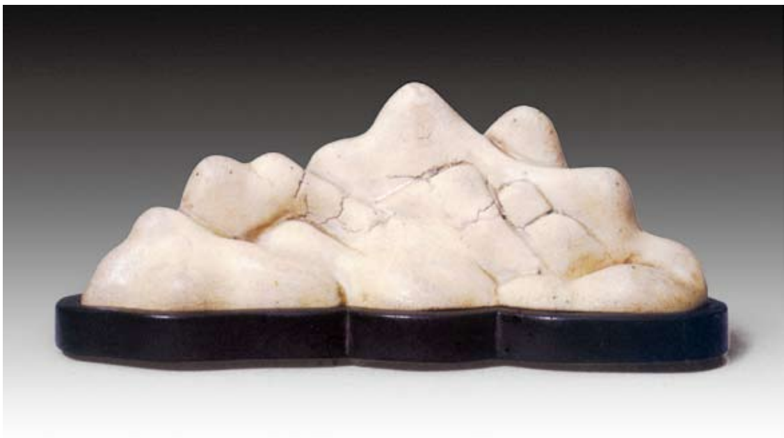
圖十七 明 萬曆 山字筆架 北京故宮博物院藏

盛景。「黃黑二土」並不出自蜀山，但指蜀山窯燒造黃黑兩種胎質的器物。對應到窯址出土標本上，應該是明代地層的粗砂胎（包括早期的紫砂茶具在內）和粗砂胎加醬釉類（黑貨）的器物。「兔窟」一句，當指窯場四周依山而造的很多工棚，考古目前沒有發現類似遺迹。「似均州者」一句，目前考古發現蜀山的均窯產品為白泥胎牙黃、天青釉，地層上最早為E11的最下層，時代是明末清初。與北京故宮博物院一件萬曆紀年的「山」字筆架（圖十七） 〔註三〕 胎、釉一致。推測「似均州者」最早應該是白泥胎質，而紫砂胎質的均窯產品蜀山沒有發現，或者另有陶窯燒造，或者在時代上晚于白泥胎質的均窯產品。「陶者甬東人」，甬東指寧波東門一帶。蜀山窯址出土「甬東郡」銘文模具標本（圖十八）一件，時代不晚於清代康熙時期，查史上無「甬東郡」一名。推測是明代陶工後裔誤傳所致。「陶者」可作制陶者，