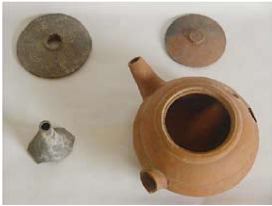
圖十三 紫褐胎和磚紅胎穿心鉢比較