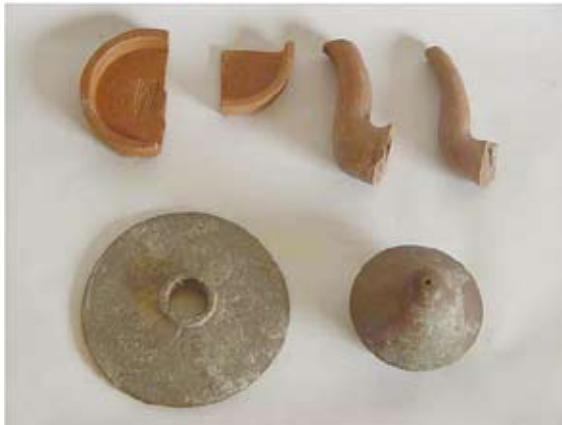
圖九 明末清初的紫砂胎器物

房等（圖十）。磚紅胎的器形有：壺、罐、燈盞、穿心鉢、釜（圖十一、十二）等。紫褐胎的器形有：壺、罐、燈盞、穿心鉢、盒、釜（圖十三）等。粗砂胎的器形有：缸、盆、罐、壇、鉢等。模具有製作器身的內模（圖十四）、製作壺嘴和動物造型用的外模（圖十五）、剪裁泥片用的軋模等。窯具主要有匣鉢、支座、墊餅等（圖十六）。 誠然，我們在進行產品的器物分類時是有些困惑的。在宜興傳統的陶器產品分類上，大致有紫砂、白貨、黑貨、黃貨、溪貨和粗砂等六類。其中的交叉和重疊是顯而易見的。因此，我們選擇了一種簡單而直觀的分類方法，即胎色結合胎質的分類。從古人的角度看，過去對於胎色的瞭解是最直接的，而對胎質的瞭解則要模糊得多。但我們這種分類法也存在很大局限，由於胎色的變化總是漸進的，所以常常對一件器物屬於紫砂胎還是磚紅胎或是紫褐胎而苦惱。