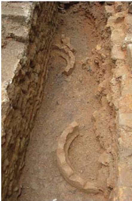
圖六 ET1Y2出土的大型支座