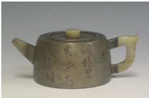
圖十四 朱堅與楊彭年合製 錫包砂胎梅竹詩銘壺 香港中文大學文物館 藏品，碧山壺館舊藏 高：10公分 寬：17公分