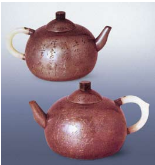
圖七 朱堅製 圓球錫壺 中國國家博物館藏 高：9.2公分 口徑：4.9公分 底徑：9公分