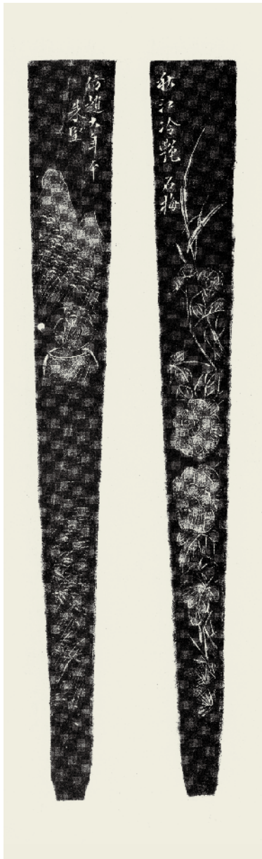
圖二三 朱堅刻 扇骨拓本 西泠印社藏品

朱堅交遊以江浙一帶文化圈子為主。其中南京博物院藏柱形方壺乃道光己酉（一八四九）由行有恆堂主人戴銓（一七九四—一八五四）訂燒，鈐「定郡清賞」印，為滿洲貴族方家定製之作。而北京故宮博物院藏朱堅鑲椰殼錫