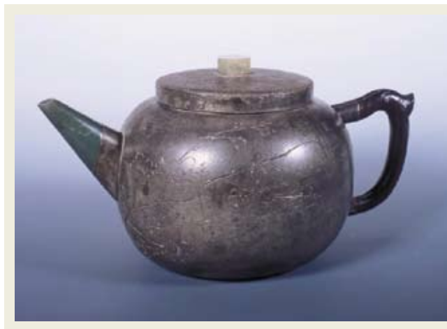
圖十五 朱堅製 錫包砂胎扁燈壺 私人收藏 高：12公分 寬：21公分