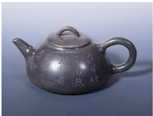
圖八 朱堅製 石瓢錫壺 私人收藏 高：7公分 寬：15公分