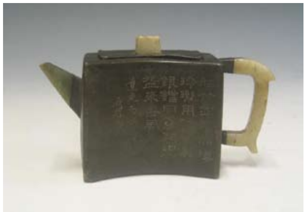
圖十一 朱堅製 夾錫環竹壺 香港中文大學文物館藏，聽泉山館舊藏 高：9.8公分 寬：16.7公分

壺身一面刻磐石，有隸書題款：「癸未孟春樸道人製」。按紀年癸未（一八二三），此壺是朱堅三十四歲時製作。另一面刻行楷銘文：「石可袖，亦可漱，雲生滿瓢，嚙者壽。」刻款「老某」。內底有「石某作」隸書