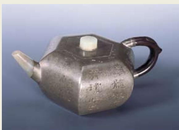
圖十九 朱堅製 錫包砂胎六瓣壺 私人收藏 高：7公分 寬：16公分