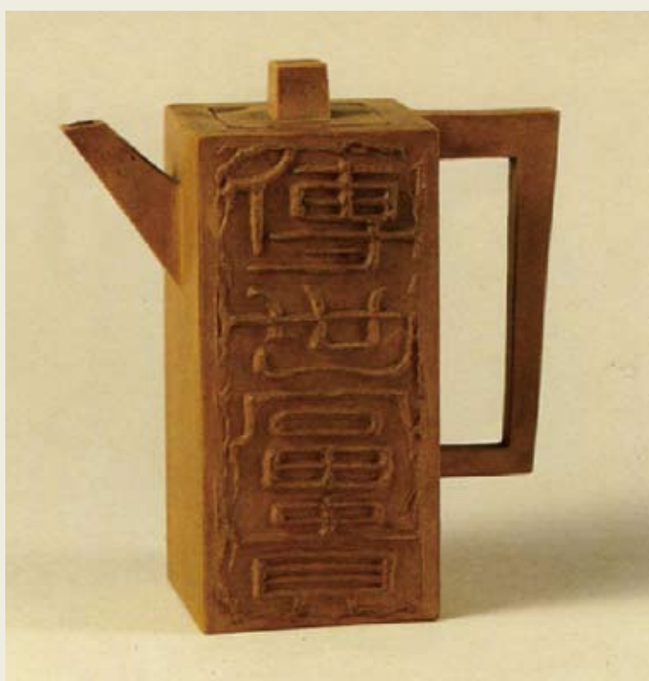
圖四 朱堅製 柱形段泥紫砂壺 南京博物院藏 高：13.5公分 寬：6.5公分 底徑：6.6公分