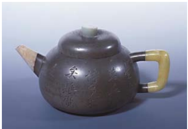
圖十二 朱堅與楊彭年合製 錫包砂胎扁圓壺 私人收藏 高：8公分 寬：16公分

這個仿曼生以飛鴻延年瓦當為壺底的權形錫壺，配有翡翠鑲柄、白玉流、綠玉蓋鈕，是朱堅創製的器形。壺內底有「品泉」款，可知為品茶用器。壺身一側刻梅枝，有行書款識：「得梅之清，奮泉如醴；兩腋生風，快如飲醒。」題款：「芳泉先生」署