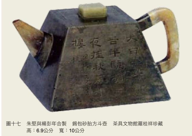
圖十七 朱堅與楊彭年合製 錫包砂胎方斗壺 茶具文物館羅桂祥珍藏 高：6.9公分 寬：10公分