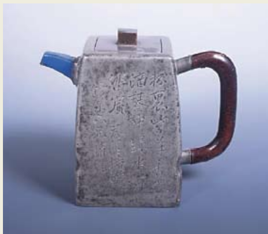
圖十八 朱堅製 錫包砂胎琴形壺 私人收藏 高：11公分 寬：13公分