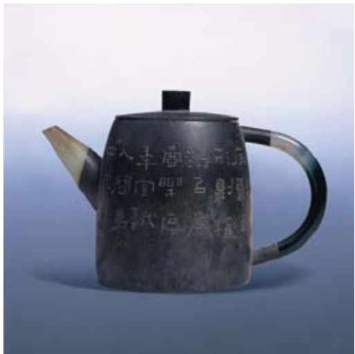
圖九 朱堅製 權形錫壺 私人收藏 高：10.5公分

望世，餐之長生」十六字銘，署款「石棧」。壺底有「茶熟香溫」印（圖六 a），把柄下有「申錫」長方印（圖六 b），可知是朱石棧與活躍於道光至咸豐年間壺家申錫合作的茗壺。