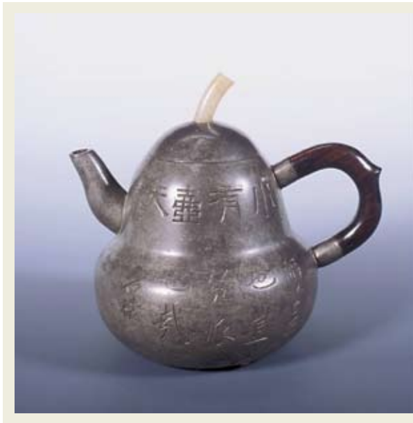
圖十 朱堅製 匏瓜錫壺 私人收藏 高：12公分 寬：13公分