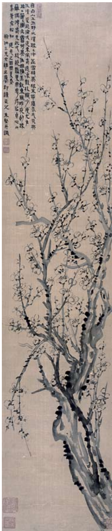
圖二二 朱堅 墨梅 私人收藏 94x19.5公分