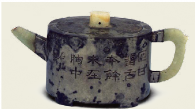
圖十六 朱堅與楊彭年合製 錫包砂胎圓卵壺 茶具文物館羅桂祥珍藏 高：8公分 寬：8.6公分