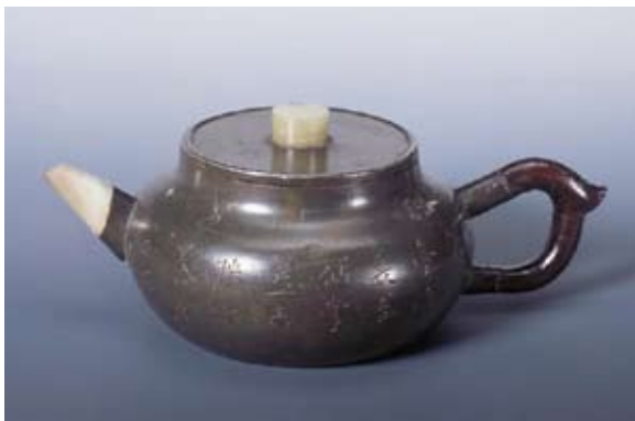
圖十三 朱堅與潘大和合製 錫包砂胎扁圓壺 私人收藏 高：7公分 寬：18公分