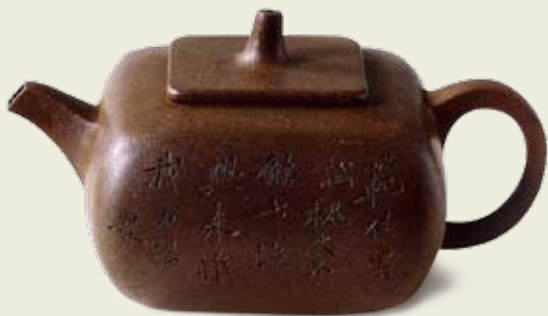
圖一 朱堅製 圓角方礎紫砂壺 唐雲舊藏 高：8公分 口徑：4.2公分

朱堅（約一七九〇—一八五七後），字石梅、石棣，號鶴道人、棣道人，又署楚棣、老某、壺史，齋名博雅齋、博雅居、綠蔭舫、鍊壺廬等，山陰（今浙江紹興）人，晚年僑寓袁浦（今江蘇松江）。朱石棣一生製造了大量的紫砂、錫器和錫包砂胎器，內容包括茶壺、酒壺、酒杯、茶葉罐，以及文房用品如水盃、印泥盒和錫鐙等。此文將集中介紹他的製壺藝術，從而窺見朱石棣將壺藝融合詩、書、畫、鐫刻和鑲嵌裝飾的巧思與妙工。