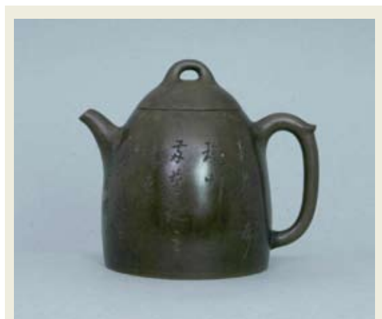
圖六 朱堅製 秦權紫砂壺 南京博物院藏 高：12.5公分 口徑：6.4公分 底徑：9.8公分