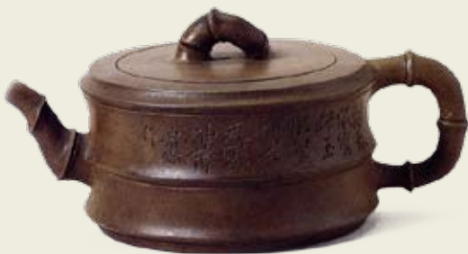
圖二 朱堅製 竹段紫砂壺 上海博物館藏 高：7.8公分 口徑：7.8公分