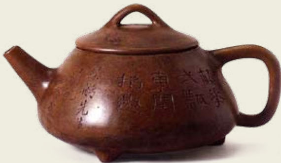
圖三 朱堅製 虛蓋石瓢壺 上海博物館藏 高：8.4公分 口徑：8.1公分