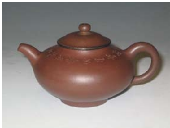
圖五 朱堅製 扁圓紫砂壺（蓋後配） 香港中文大學文物館藏品，碧山壺館舊藏 高：8.6公分 寬：15.3公分