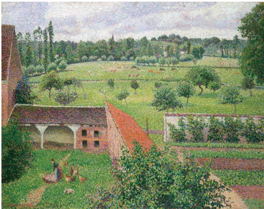
圖五 厄哈格尼，我窗外的景緻 (View from my Window, Éragny-sur-Epte) 卡密爾·畢沙羅 (1830-1903) 1888 油彩、畫布 65×81公分