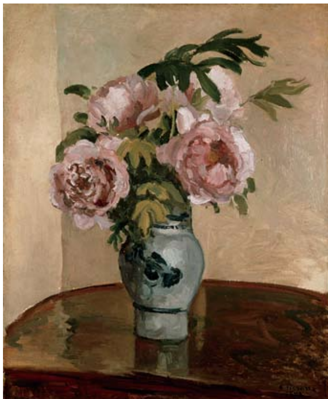
圖四 粉牡丹 (Bouquet of pink Peonies) 卡密爾·畢沙羅 (Camille Pissarro, 1830-1903) 1873 油彩、畫布 73×60公分