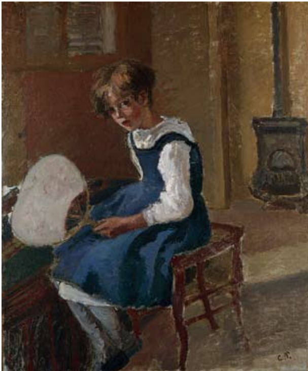
圖十四 手握扇子的珍娜 (Jeanne holding a Fan) 卡密爾·畢沙羅 (1830-1903) 1873 油彩、畫布 56×46.5公分