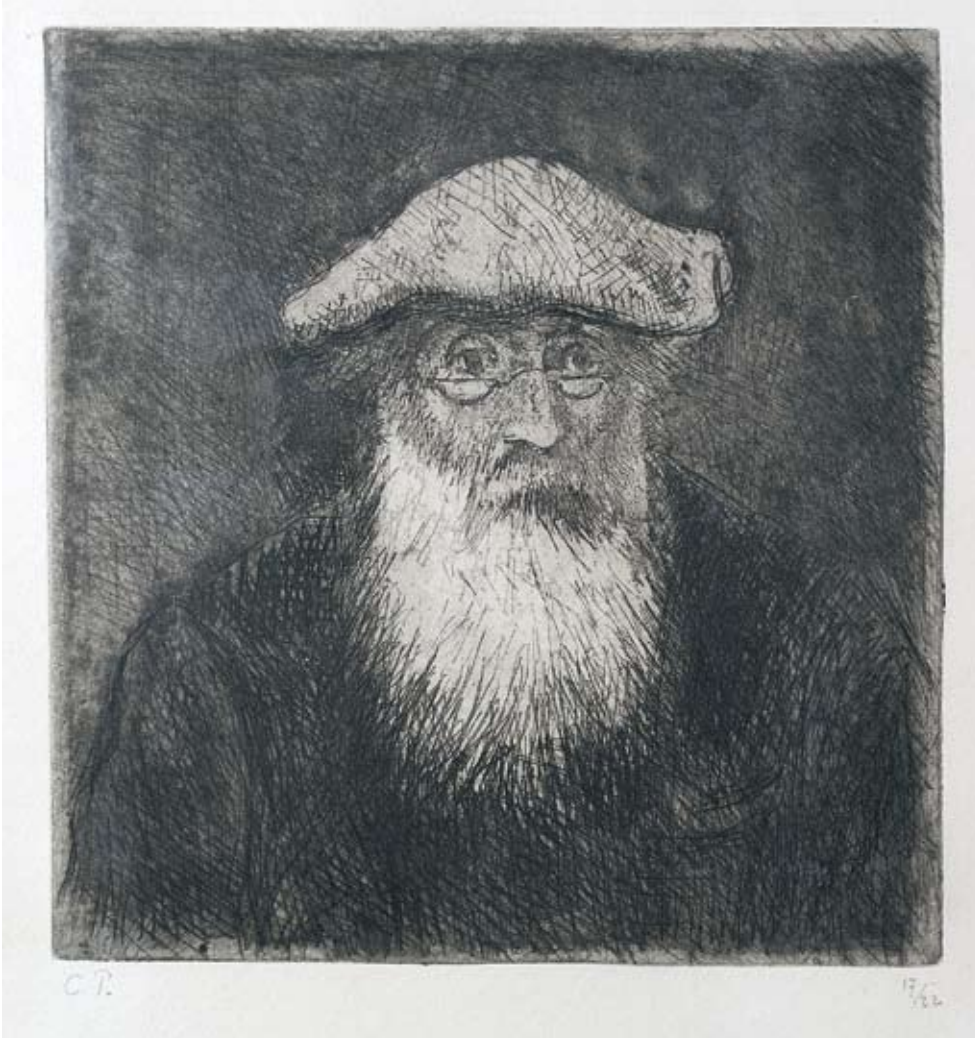
圖十三 卡密爾·畢沙羅自畫像 (Camille Pissarro, par lui-même) 卡密爾·畢沙羅 (1830-1903) 1890 蝕刻版、鋅版 18.8×17.8公分