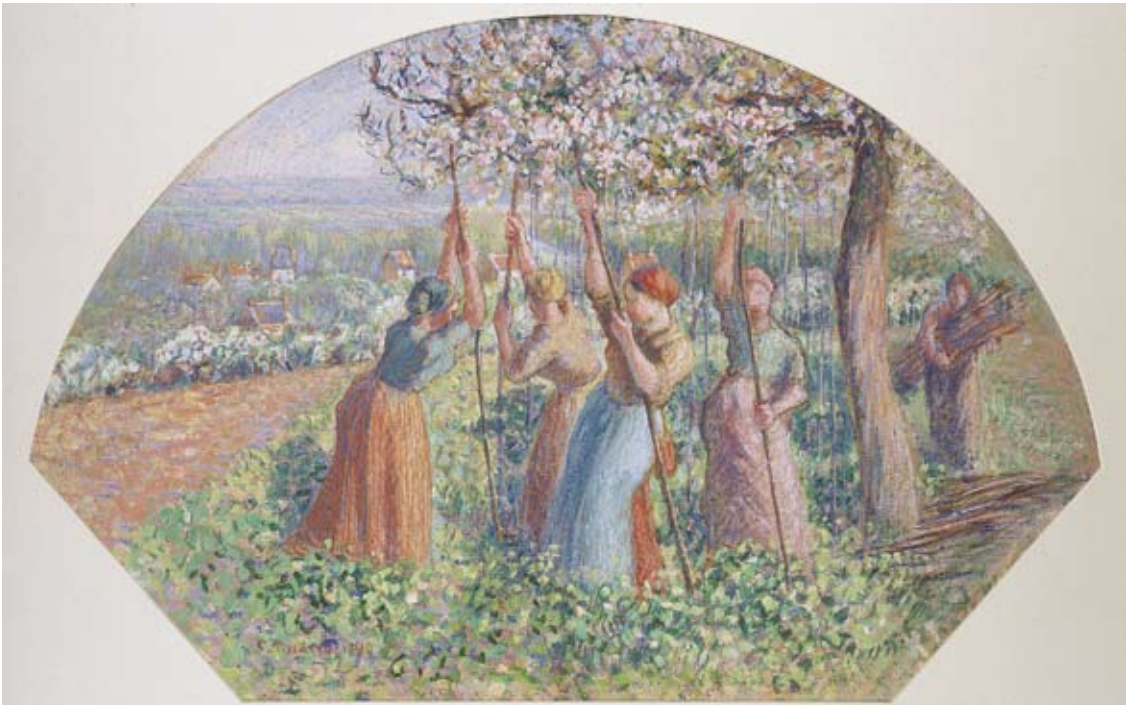
圖十一 搭豌豆棚架的農婦們 (Rameuses de pois) 卡密爾·畢沙羅 (1830-1903) 1890 黑粉筆、不透明水彩、粗的褐色紙 40.7×64.1公分