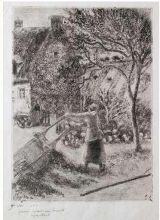
圖十二 正在清理手推車的婦女 (Femme vidant une brouette) 卡密爾·畢沙羅 (1830-1903) 1880 蝕刻版 32×23公分