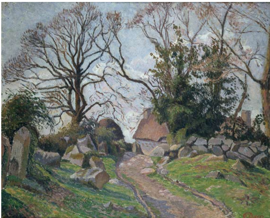
圖十七 在列克的普爾楓 (Pouffenc à Riec) 路西安·畢沙羅 (1863-1944) 1910 油彩、畫布 54×65公分