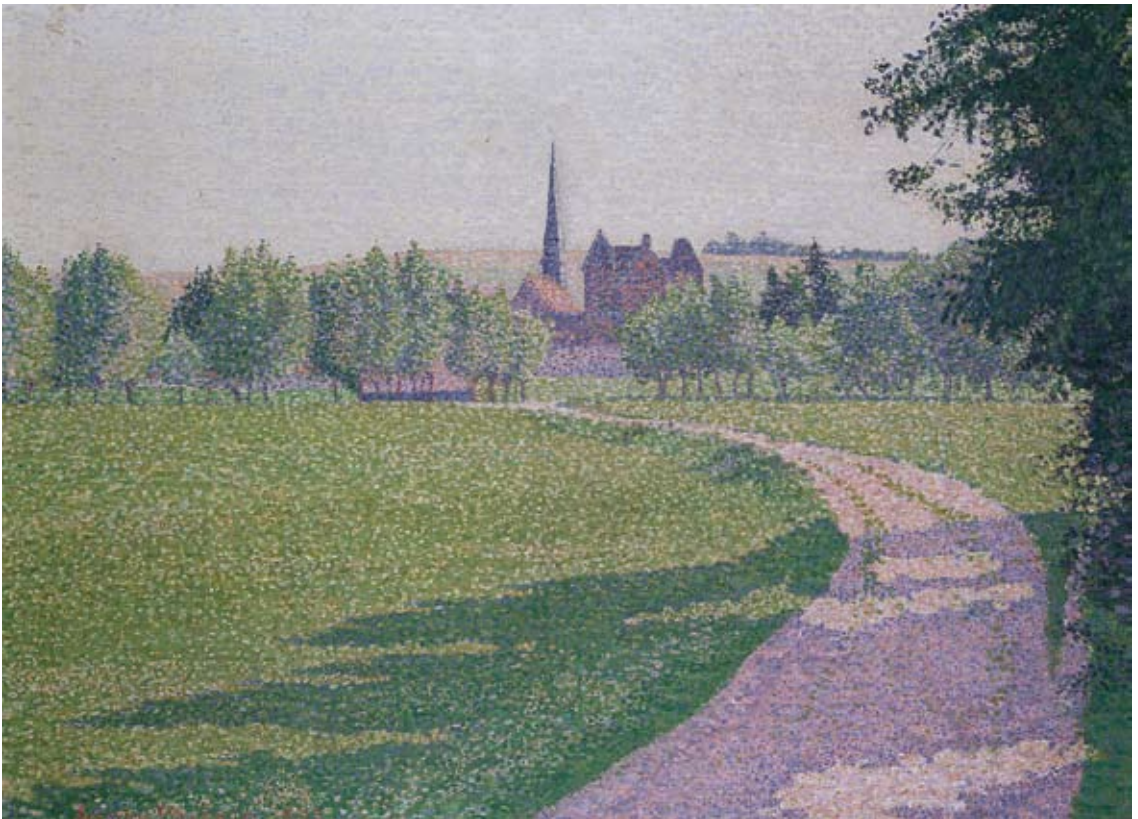
圖十六 厄哈格尼教堂 (Éragny Church) 路西安·畢沙羅 (Lucien Pissarro, 1863-1944) 1886 油彩、畫布 53.2×72.2公分