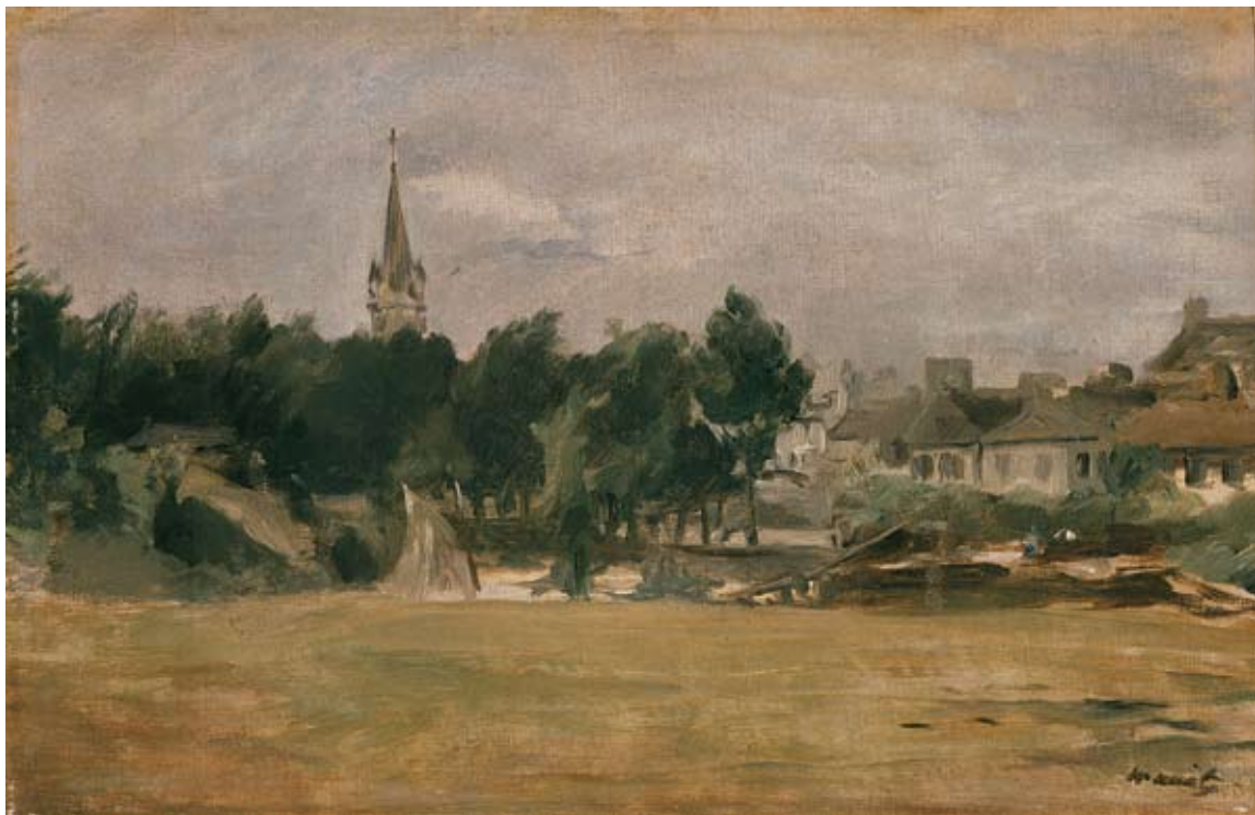
圖二 村莊教堂風景畫 (Landscape with a Village Church) 艾杜瓦·馬內 (Édouard Manet, 1832-1883) 約1870s 油彩、畫布 30×44公分