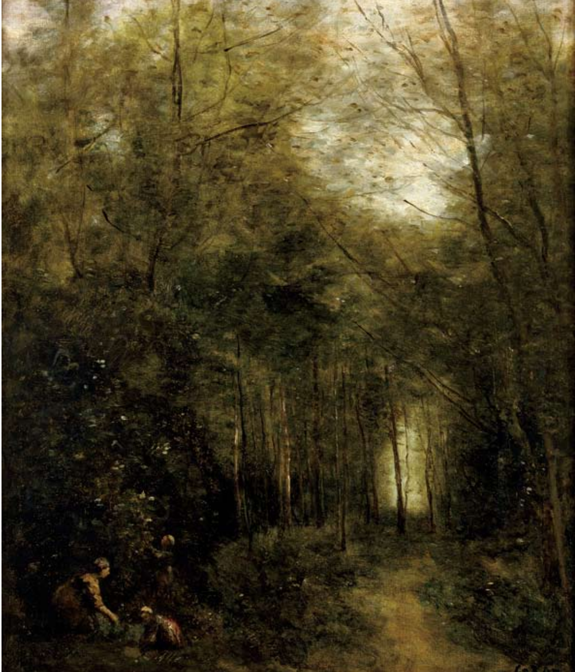
圖一 森林裡的小溪，蒙菲赫美（Montfermeuil, the Brook in the Wood） 尚一巴蒂斯特—卡密爾·柯洛（Jean-Baptiste-Camille Corot, 1796-1875） 約1867 油彩、畫布 58×49公分

響；二是畢沙羅藝術成就與他的藝術家族；以「風景·畢沙羅」、「農村·畢沙羅」、「家人·畢沙羅」三大主題，再延伸為六大展區：影響畢沙羅的先驅風景藝術家（圖一、圖二、圖三）、畢沙羅的印象派時期（圖四、圖五、圖六、圖七）、農村生活繪畫先驅藝術家（圖八、圖九、圖十）、畢沙羅的農村生活繪畫（圖十一、圖十二）、畢沙羅的家人畫像（圖十三、圖十四、圖十五）、畢沙羅家族藝術家（圖十六、圖十七、圖十八）等呈現畢沙羅一生中多樣的創作風格與同時期印象派畫作的特色。