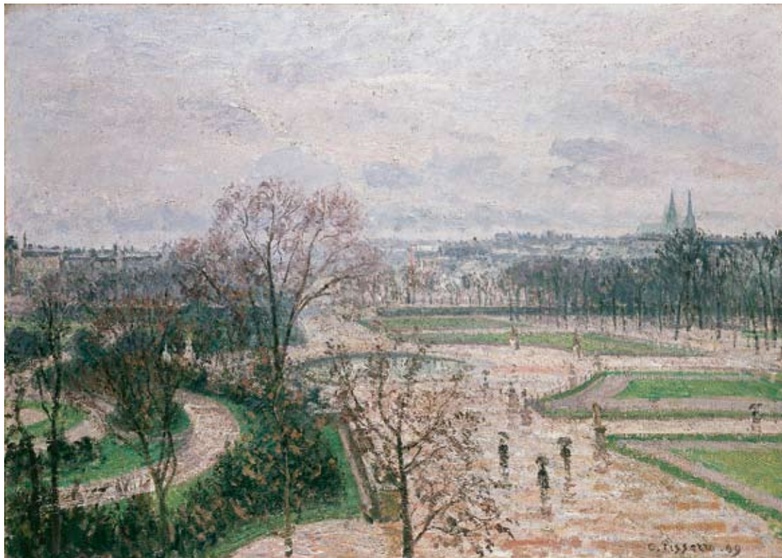
圖六 雨天的杜樂麗花園 (The Tuileries Gardens, Rainy Weather) 卡密爾·畢沙羅 (1830-1903) 1899 油彩、畫布 65×92公分