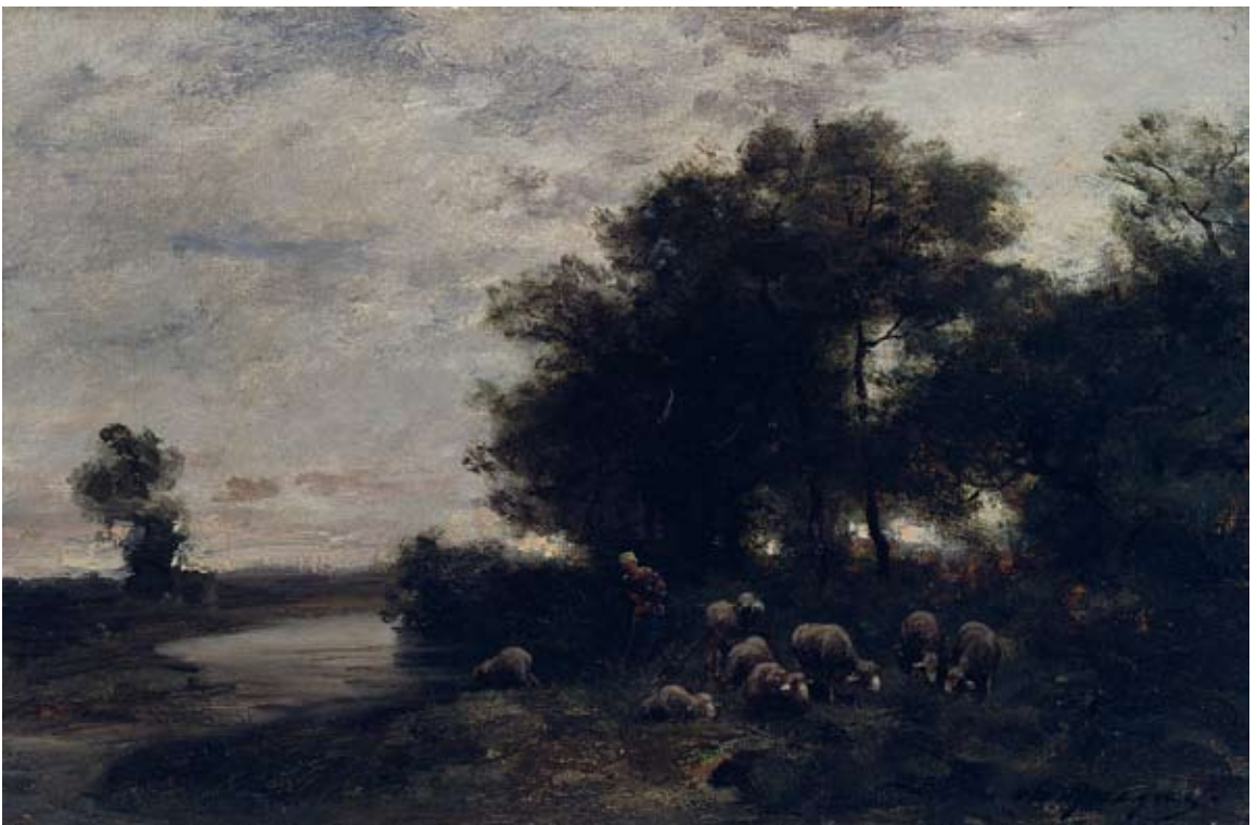
圖九 牧羊女讓羊群飲水 (Shepherdess watering her Flocks) 查理一愛彌爾·賈克 (Charles-Émile Jacque, 1813-1894) 約1850 油彩、畫布 25×38公分