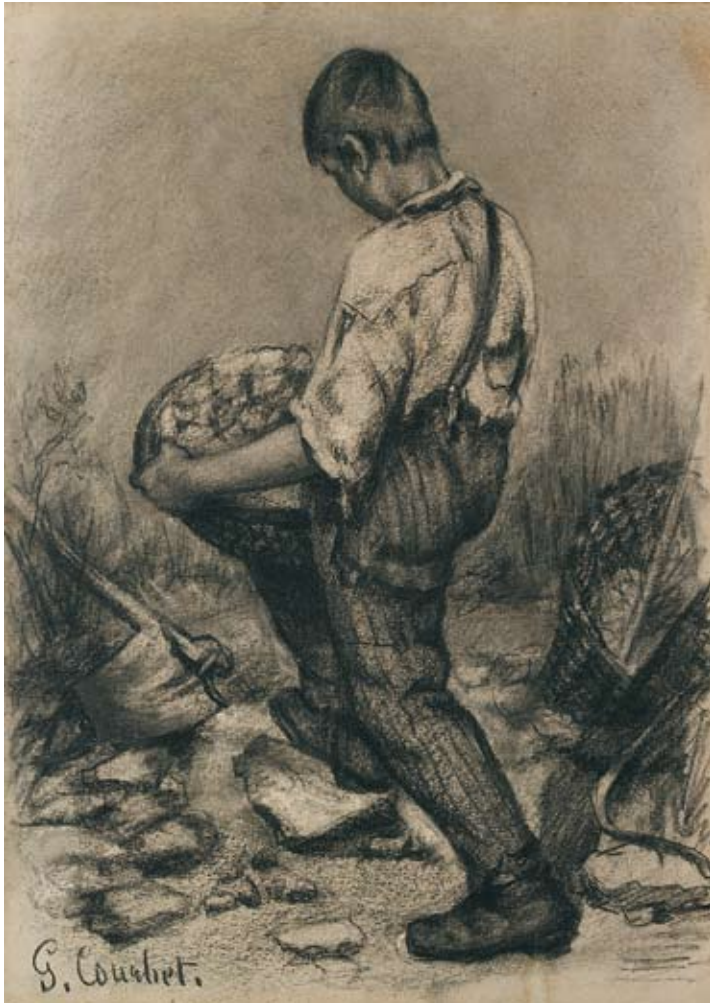
圖十 採石少年 (Young Boy, holding a Basket of Stones, seen from behind) 居斯塔夫·庫爾貝 (Gustave Courbet, 1819-1877) 約1865 黑蠟筆、稀疏的灰白色布紋紙 (覆蓋在稀疏且嚴重褪色的布紋紙上) 29.5×21.1公分