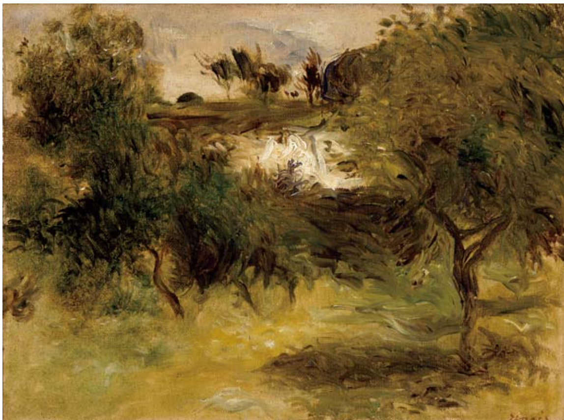
圖三 樹木風景畫 (Landscape with Trees) 皮耶一奧古斯特·雷諾瓦 (Pierre-Auguste Renoir, 1841-1919) 約1891-1900 油彩、畫布 27.5×31.5公分