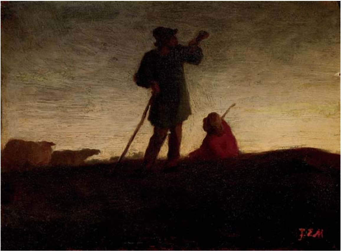
圖八 召回羊群 (Recalling the Flock) 尚一法蘭斯瓦·米勒 (Jean-François Millet, 1814-1875) 約1865-1870 油彩、畫板 11.5×15.5公分