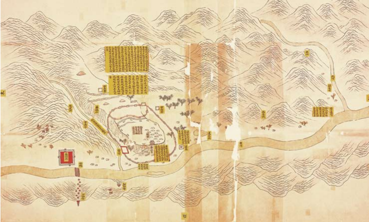
圖五 蘭州方面現在圍攻賊營情形圖

道壕溝，又有土黃色籤條註明：「賊營」在中央，四面都有一「賊卡」，而「賊營前溝壕兩道，上俱有賊卡」。圖四對閏五月中旬雙方的態勢有很清楚的描繪和說明。