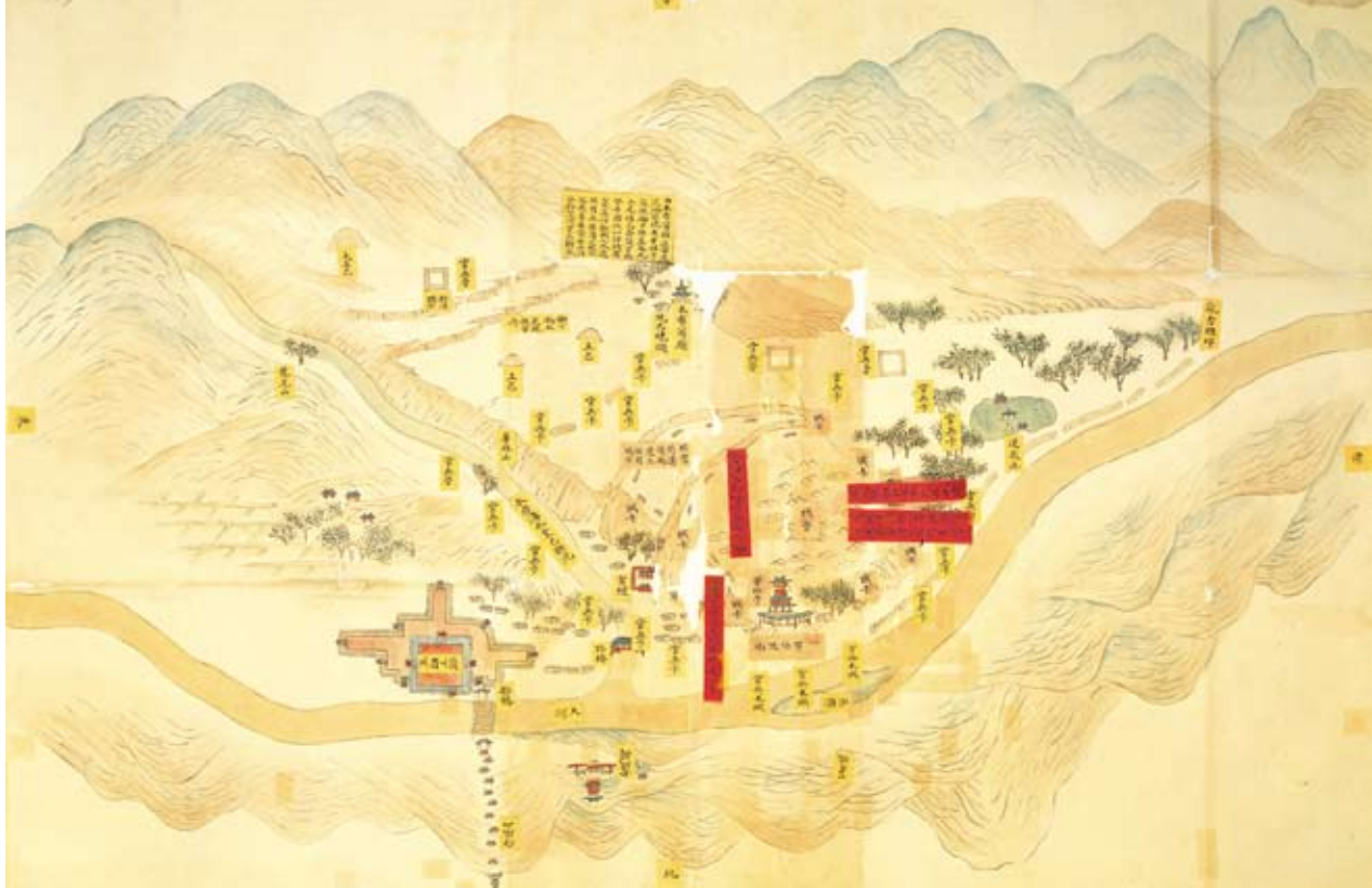
圖四 蘭州華林山一帶情勢圖

（十一—十三）時，清軍慢慢撤回龍尾山，部分清軍則退到山下埋伏。守卡的回兵陸續撤回後方，卡內只剩下數十人。海蘭察突然率領騎兵從東南山溝飛奔而出，一直衝向大卡。清軍屯練、降番同時衝到壕溝旁邊。回兵驚慌失措。清兵衝進大卡，將數十名回兵全部殺死。營內回兵出來拼死衝鋒，企圖奪回大卡。清軍鎗箭齊發，回兵撤退到兩座山包後。是日，清軍攻佔大卡，居高臨下，控制了戰場上的制高點。 十六日黎明，海蘭察等又攻佔了回兵的兩座山包；又派兵攻佔回軍據點本布爾廟，並予以燒毀。這時，回軍陣地已經被壓迫的非常狹小，清軍將回軍四面圍困。