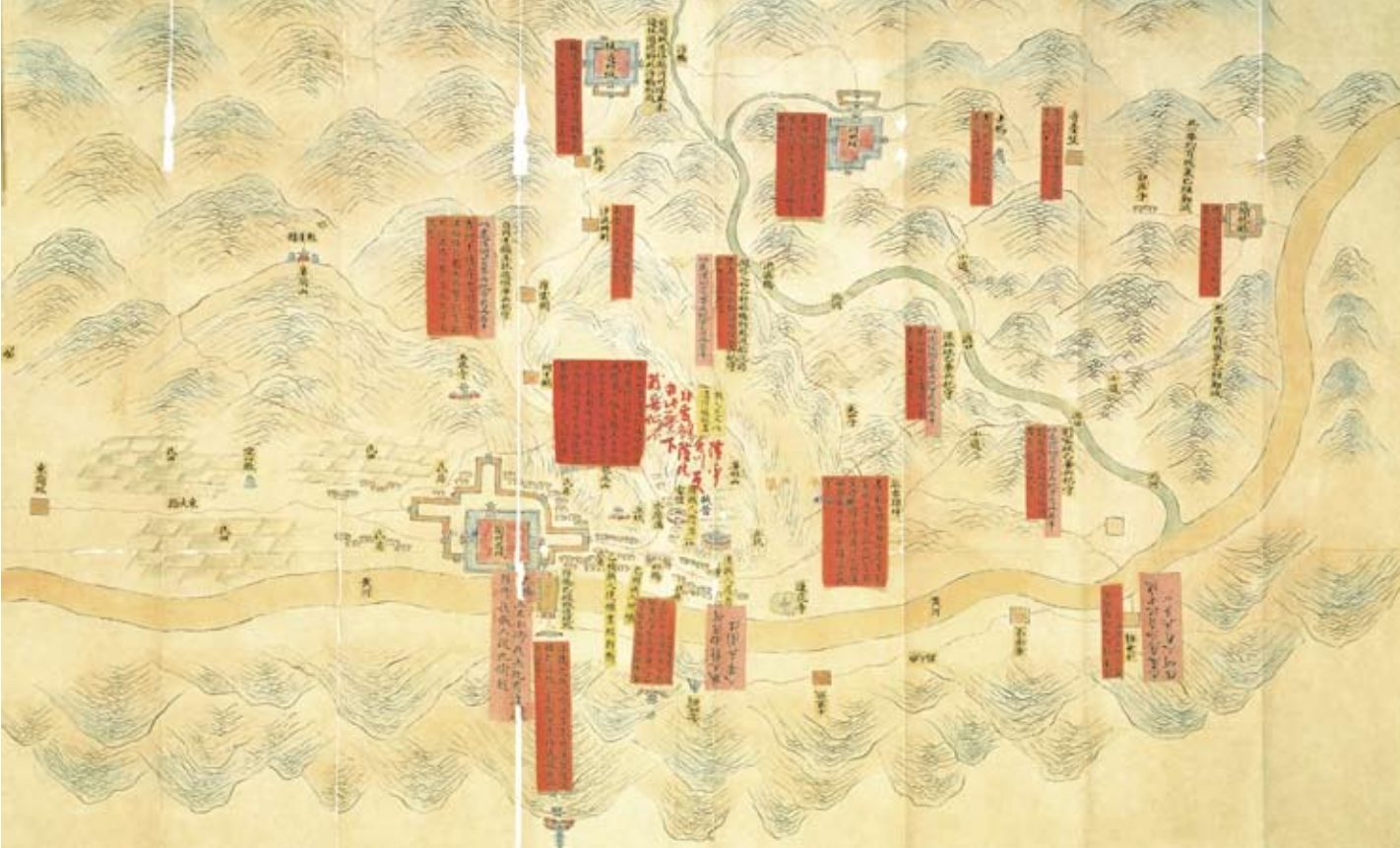
圖二 蘭州城外華林山一帶形勢全圖，圖中央紅字為清高宗硃批。

恐慌後退，只有第三排的滿兵齊立不動。和坤帶領隨從用刀、鞭砍打綠營兵，綠營兵才穩住陣腳。海蘭察騎馬率領舊教士兵向回兵直衝過去。最後回兵被擊敗，退回華林山。和坤跟蹤追擊，但被立坎（直立的峭壁）所阻。是日，總兵圖欽保陣亡。（參閱圖二）