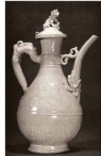
圖十四 芝加哥藝術研究所典藏飛鳳紋龍把執壺

品，復原其器形，並推定年代與產地。(註十七)在日本，這類「清香壺」是重要的茶道具，屬於所謂的「南蠻島物」，謝明良教授因此推定臺灣可能是日本前往東南亞貿易航線上的一個據點。藉由比對分析日本、中國與