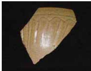
圖四 淡水鎮下圭柔H遺址出土細線蓮瓣紋青瓷碗殘件（國立歷史博物館歷史考古小組調查）