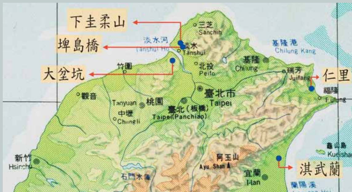
圖一a 臺灣北海岸發現宋、元、明前期龍泉青瓷遺址分佈圖(林美智女士改繪)