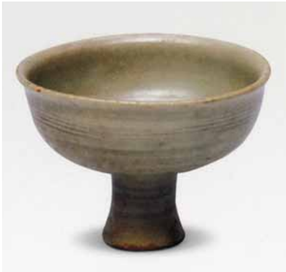
圖十一 四川省彭州市慶元鎮出土青瓷高足杯，彭州博物館藏

達格蘭、噶瑪蘭族群與外界貿易活動往來的證據之一。究竟這些陶瓷器為何來到此地？歷史學者與陶瓷史學者，大都連繫到中琉航線的興盛，促使北台灣成為中琉航線間的航行指標與淡水補給之地。因此，這些陶瓷器可能是間接自琉球流入，也可能是途經該航路臨時泊岸的貿易之物。 (註十四) 承前所述，從龍泉青瓷盤、高足杯與伴隨的景德鎮影青釉執壺標本，顯示臺灣北海岸遺址出土早期青瓷遺物，