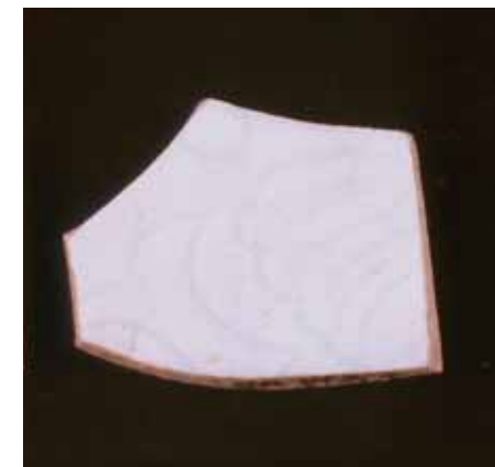
圖十七 八里鄉大坵坑遺址採集青白瓷殘件