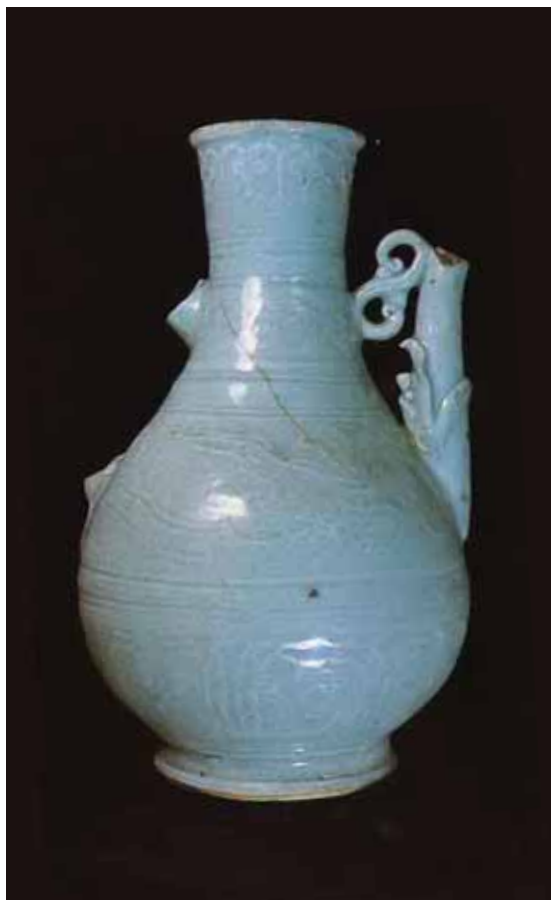
圖十二 八里坌大空坑遺址採集元代景德鎮青白瓷執壺殘件