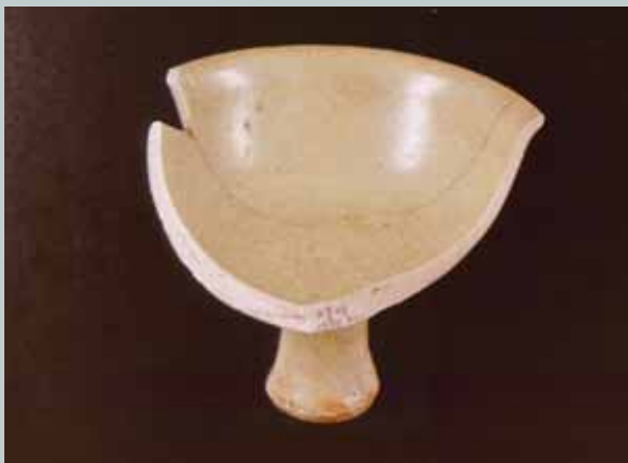
圖十 大空坑遺址採集青瓷高足杯(陳得仁先生調查)

表作，可以英國學者Margaret Medley所介紹，典藏於芝加哥藝術研究所(The Art Institute, Chicago)的飛鳳紋龍把執壺(圖十四)為例，另一件精品則見於日本收藏品(圖十五)。雖然與執壺這類作品具有相似分層佈局與裝飾母題，可見於元代杭州朝暉路窖藏與江西萬年縣石鎮街泰定元年(一二三四)墓出土品，但是此兩例子為刻花技法。同樣的蓮瓣紋線形浮