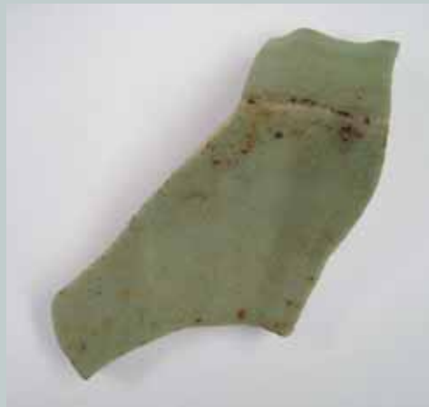
圖七 埤島橋遺址採集龍泉青瓷盤殘件（台大藝研所調查）

上述埤島橋遺址的龍泉青瓷盤與大坵坑遺址的龍泉青瓷高足杯兩件標本，顯示北海岸地區的龍泉青瓷類型，可上溯到元代中、後期，約自十四世紀第二四半期至十四世紀後半期左右。筆者基本上相信這些遺物是原生堆積層的遺物，亦即並非晚近才被帶進臺灣遺留在現場者。無獨有偶地是，這兩個遺址分別採集到有一類編年約集中在元代中期的景德鎮影青釉執壺殘件。其中埤島橋遺址採集標本，僅存執壺流嘴殘件，而大坵坑遺址採集者為保留較為完整（圖十二）。（註十二）後者執壺器身上下接合呈玉壺春瓶式，器身從上而下約三分之二之器腹處置柱狀曲流，流上裝飾仰頭張口的龍首貼花，口中銜一柱狀管流，流口部分殘失，流嘴尾端與瓶頸