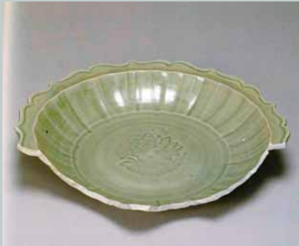
圖九 中國平潭大練島1號沈船出水青瓷盤

之間以斜向S形繫耳連接，把手已殘缺。壺器身以模印技術施作線形浮雕裝飾帶，由上而下分別是變形蓮瓣蓮瓣紋、雲紋、飛鳳紋、變形蓮瓣紋。相似風格製品，可見於內蒙古集寧路古城遺址窖藏青白瓷執壺(圖十三)，龍口貼飾與器身線形浮雕裝飾帶與大空坑遺址出土者幾乎一致，不過集寧路出土標本頸身部位有一圈突稜，形式稍有不同。該類型的精品代