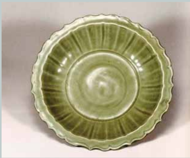
圖八 韓國新安沈船(1323年左右沈沒)出水青瓷盤