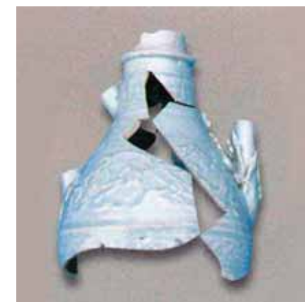
圖十三 元代內蒙古集寧路古城遺址宮藏青白瓷執壺