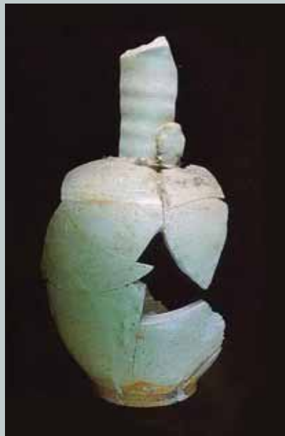
圖十六 八里鄉大坵坑遺址採集北宋時期長頸鼓腹壺