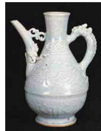
圖十五 《世界陶瓷全集13 遼金元》圖42 青白瓷飛鳳紋水注