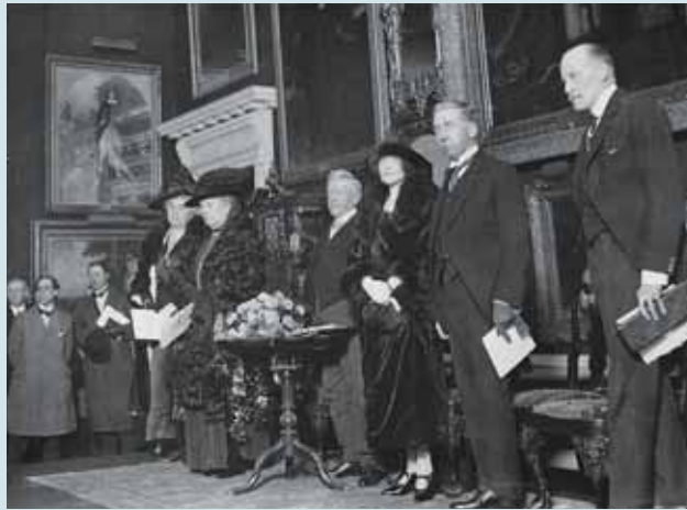
圖二四 1922年12月16日，利華邀請英國皇室比阿特麗絲公主主持開幕典禮。利華的左側是公主，右側是他的兒子與媳婦。