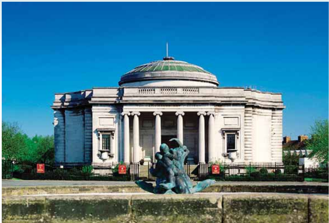
圖二六 利華夫人藝術館外觀 National Museums Liverpool