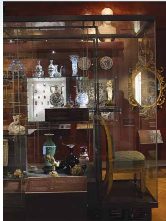
圖二八 運用玻璃透光性與鏡面的反射性，給觀眾帶來空間感。National Museums Liverpool

英國藝術外，他鍾愛中國瓷器、羅馬雕塑以及希臘陶器。他從沒有買過任何一件藝術品送給妻子，也不鼓勵妻子收藏以及參與藝術館的規劃，諷刺的是，他竟以紀念死去的妻子為由，命名為「利華夫人藝術館」(Lady Lever Art Gallery)，一九二二年十二月十六日，邀請英國皇室比阿特麗絲公主主持隆重的開幕典禮，正式向民