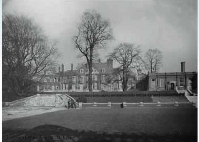
圖十 利華在倫敦漢普斯特希夫 (Hampstead Heath) 的豪宅 The Hill。