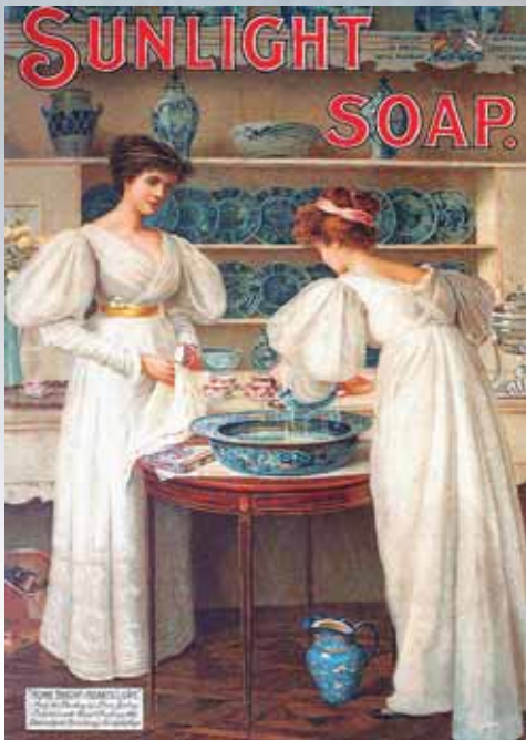
圖二 Sunlight Soap 廣告海報

（James McNeill Whistler, 1834-1903）有意在畫布上留下「China」的想像，帶動了中國家飾時尚。他們的作品受到中產階級的喜愛，如此新貴競相購買畫作，並模仿藝術家的生活品味，頓時，中國瓷器的市場價格再度攀升。利華的中國熱的確是受到這場唯美運動的影響。