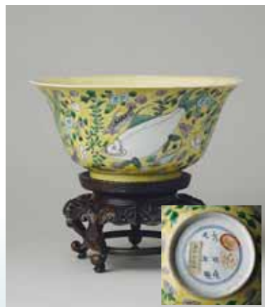
圖十四 清康熙黃地素三彩魚紋碗，盤底落有大明成化款 高19公分 (Inv. No. LL 6198) National Museums Liverpool

十九世紀下半葉，許多成功的英國大亨都有買地的慾望，以建立自己的王國。利華也不例外，他在二八八八年與妻兒搬進威盧半島上的豪宅桑頓莊園 (Thornton Manor)，在他的音樂室中，成對成套的中國瓷器盡入眼簾 (圖九)。一九〇〇年，他請畫家沃夫蘭奧斯陸福德 (Wolfram Onslow-