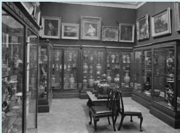
圖二五 1920年代，利華夫人藝術館藏的中国瓷器陳列在古董商艾德嘉·勾爾(Edgar Gorer)设计的展示櫃中。