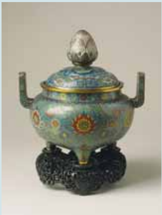
圖一七 清乾隆款招絲珐瑯番蓮紋香爐 高33.2公分 (Inv. No. LL 5916) National Museums Liverpool