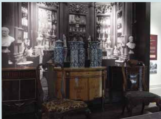
圖二七 運用舊照片與實物，營造利華的收藏記憶。