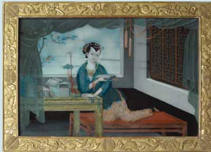
圖十五 十八世紀中期仕女肖像玻璃畫29 x 44公分 (Inv. No. LL 8818-8819) National Museums Liverpool