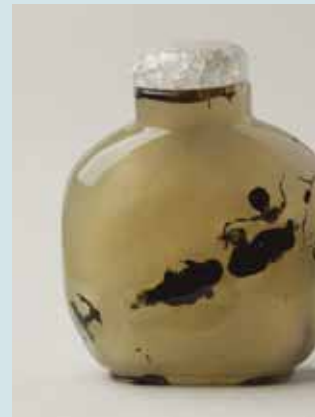
圖二一 清中期瑪瑙雁鴨戲水圖鼻煙壺高6.8公分 (Inv. No. LL 9323) National Museums Liverpool