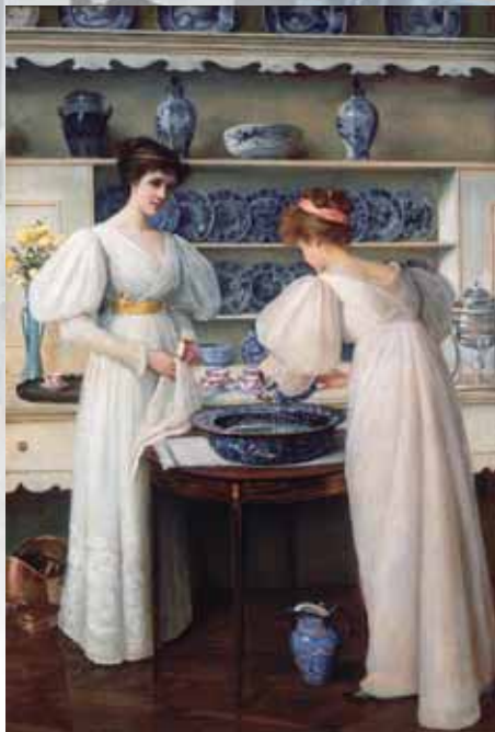
圖一 露易斯·賈普林（Louise Jopling, 1843-1933）油畫作品（Inv. No. LL 3414）

利華休姆爵士，本名威廉·赫斯基斯·利華（William Hesketh Lever，本文簡稱利華）對中國瓷器的迷戀，可以從女畫家露易斯·賈普林的作品約略看出。以「青花」為畫作標題，賈普林巧妙的運用白地青花瓷器的陳設做為背景，映入眼簾的是維多利亞時期悠閒貴婦，身著薄紗蕾絲花邊，手持亞麻布擦拭瑠璃彩瓷，意在營造唯美氣氛（圖一）。一八九六年，利華