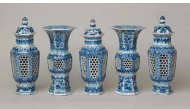
圖六 利華偏愛的Garniture，高約：23-28公分（Inv. No. LL 6313, LL 6314, LL 6315, LL 6790 & LL 6791）National Museums Liverpool

此外，利華受到朋友詹姆士（James Orrock, 1829-1913）的影響，藝文界給詹姆士取了個雅名「甲骨文」（The Oracle）。生於愛丁堡的牙醫世家，詹姆士是一名牙醫師、藝術家、藝術贊助者、收藏家、古董商、策展人、鑑賞家、仿造者及宣傳者。他特別喜歡康熙年間青花的鮮藍青翠色調，以及那線條流暢如行雲流水般的飄逸，正如同他對英國水彩畫呈現出一種獨特韻味的著迷。他們在一八九六年第一次見面，相談甚歡之後，在詹姆士的鼓舞下，利華持續收藏中國瓷器。利華還模仿詹姆士陳列中國瓷器的方式（圖三），甚至在一九〇四、一九一〇、一九一一年和一九二