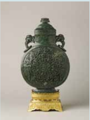
圖一六 清乾隆碧玉八吉祥花紋雙耳壺 高35.6公分 (Inv. No. LL 70) National Museums Liverpool