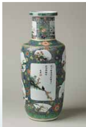
圖十三 清康熙五彩開光花鳥圖瓶 高45.7公分 (Inv. No. LL 94) National Museums Liverpool