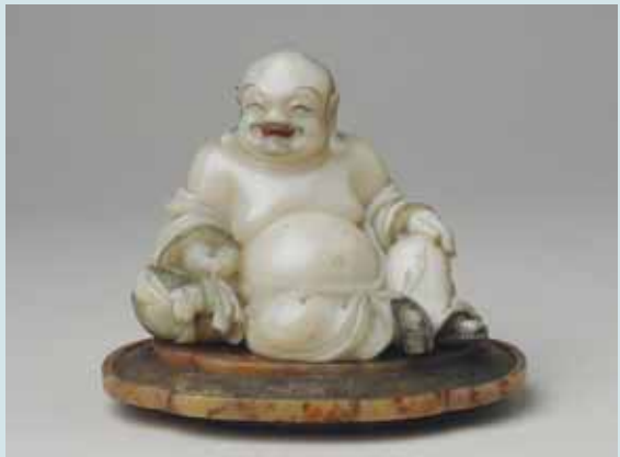
圖一九 清乾隆晚期皂石雕布袋和尚 高9.7公分 (Inv. No. LL 34) National Museums Liverpool