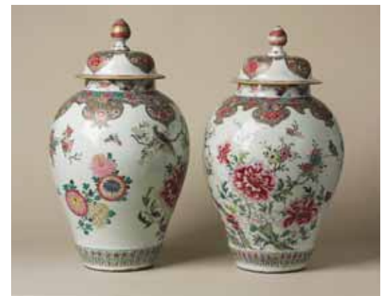
圖七 十八世紀粉彩牡丹花鳥紋將軍罐，高約：68公分 (Inv. No. LL 6177-LL 6178) National Museums Liverpool

逐漸取代釉下青花，famille vert 中的藍彩是釉上彩。在famille vert 中則又有famille noire和famille jaune的區別，前者是指墨地五彩，後者是者黃地五彩。十八世紀初期，歐洲貴族對famille rose (以粉紅色為主的釉上彩系列) 的喜愛日增，形成另一股新的潮流，大量取代famille vert 的需求。一對十八世紀粉彩牡丹花鳥紋將軍罐 (圖七)，是利華在一九二三年佳士得拍賣會上購得，這對將軍罐曾是溫柏恩爵士 (Lord Wimborne) 祖母詩雷