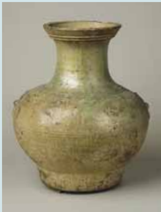
圖二二 東漢綠釉雙環壺高42.8公分 (Inv. No. LL 6575) National Museums Liverpool