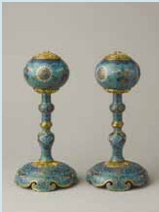
圖一八 清乾隆招絲珐瑯官帽架高約：29.5公分 (Inv. No. LL 5910-LL 5911) National Museums Liverpool