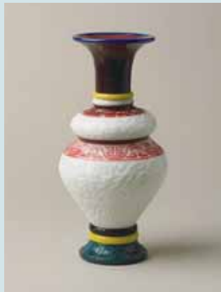
圖二〇 清乾隆款造辦處玻璃器 高29.1公分 (Inv. No. LL 9301) National Museums Liverpool