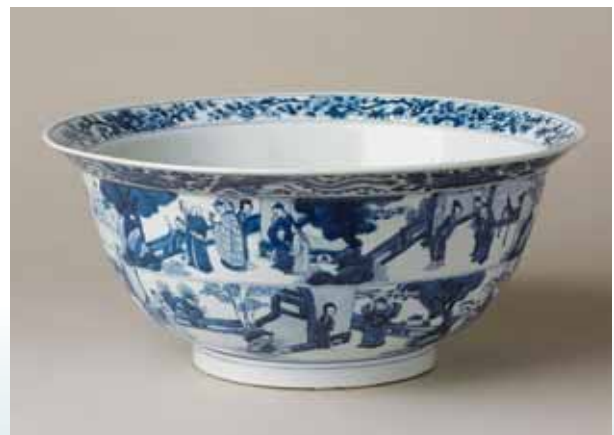
圖十二 清康熙青花西廂人物故事圖大碗 高19.1公分 口徑36.9公分 (Inv. No. LL 6158) National Museums Liverpool

其是一套五件的組合，一般稱為飾品組 (Garniture) (圖六)。對利華來說收藏中國瓷器是一種貴族的生活方式，也是一種進入中國藝術市場的遊戲。 新貴的秀場 中國瓷器進入西方貴族室內，導因於法國仕女對東方奢華的一種嚮往，她們喜歡清代前期景德鎮彩瓷，於是透過傳教士向中國大量訂製。出現了法文的專用術語，例如：famille vert (以綠色為主的釉上彩系列)，主要是對清代康熙年間部分五彩瓷和素三彩的統稱。康熙時期以釉上藍彩