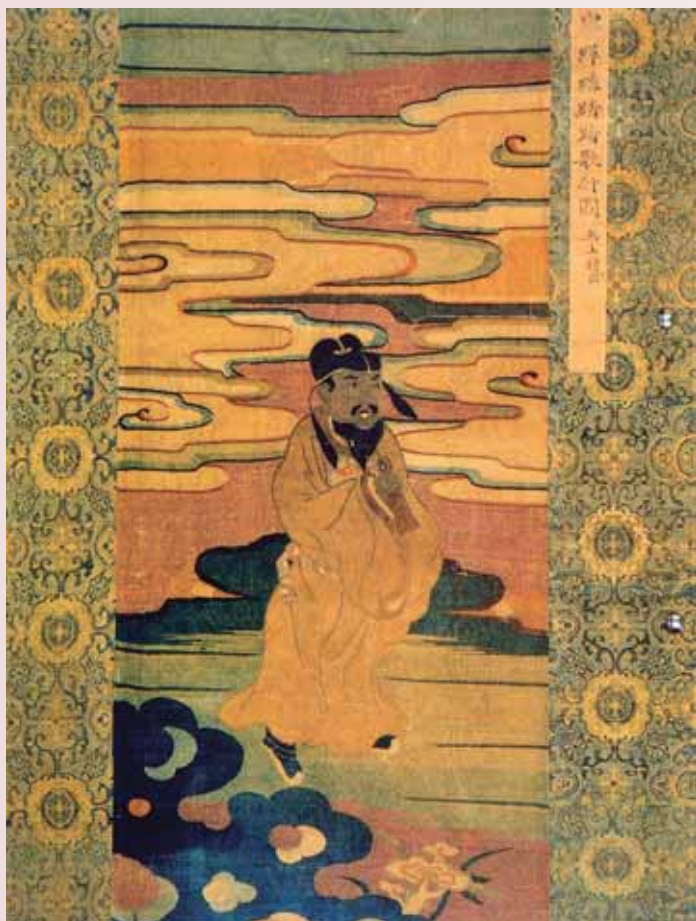
圖四 南宋 緯絲《踏歌行圖》南京博物院藏