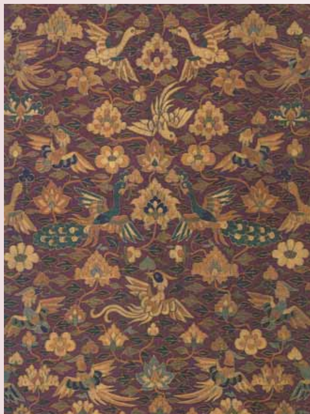
圖七 北宋 繅絲〈紫鸞鳴譜〉遼寧省博物館藏