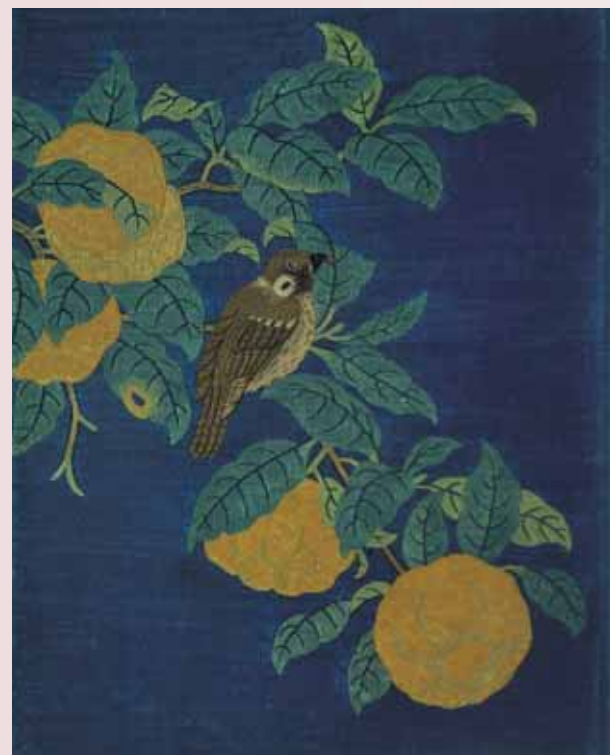
圖一 宋 緙絲《山果寒禽》《繡繪集錦》第七幅 國立故宮博物院藏