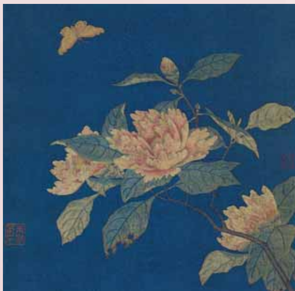
圖三 南宋 朱克柔緙絲《山茶蛭蝶圖》北京故宮博物院藏