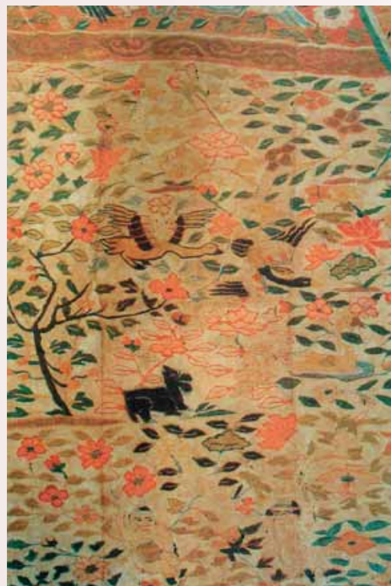
圖六 宋 繅絲〈花樹飛雁〉英國倫敦Spink&Son公司藏

態有細緻的觀察和有一定的藝術理解和藝術修養。 從現存繅絲實物考察，北宋的繅絲基本上繼承了唐代的繅織技法，主要有攢、勾緯、搭梭和刻鱗等，但繅工比唐代更加精細秀麗，藝術表現力更強和更富於變化。北宋時創造了「結」的戲色技法，即用相近的二色或三色絲線按退暈的色階層次，逐層減退繅織，從而使圖案花紋的色彩增加明度的變化，更富於立體感和裝飾性，多用於繅織雲紋、水紋和山石等。北宋繅絲的紋樣內容多為圖案化的裝飾，技法比較簡單，風格樸實。 北宋的繅絲多用作書畫包首或經卷封面的裝裱。如北京故宮博物院藏北宋繅絲〈紅花樹〉、繅絲〈紫天鹿〉，遼寧省博物館藏繅絲〈紫鸞鳴譜〉（圖七）、繅絲〈紫湯荷花〉、繅絲〈宋徽宗趙佶木槿花圖〉，紐約大都會博物館藏繅絲畫軸包首等，都是如此。這些作品是北宋極有代表性的繅絲精品，堪稱稀世之寶。其中繅絲〈紫鸞鳴譜〉採用攢、結、勾緯、搭梭、參和戲等繅織技法，在有限的空間內表現了鸞鵲、鸚鵡、鷓鴣、黃鸝、孔雀、鴛鴦、鳩鳥、錦雞和荷