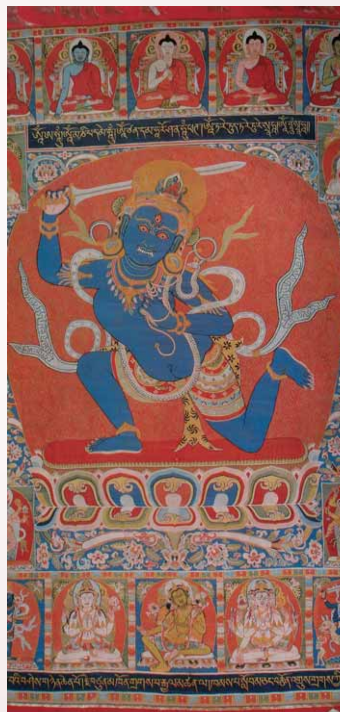
圖五 南宋 繅絲〈珀瑪頓月珠巴像〉唐卡西藏拉薩布達拉宮藏

態有細緻的觀察和有一定的藝術理解和藝術修養。 從現存繅絲實物考察，北宋的繅絲基本上繼承了唐代的繅織技法，主要有攢、勾緯、搭梭和刻鱗等，但繅工比唐代更加精細秀麗，藝術表現力更強和更富於變化。北宋時創造了「結」的戲色技法，即用相近的二色或三色絲線按退暈的色階層次，逐層減退繅織，從而使圖案花紋的色彩增加明度的變化，更富於立體感和裝飾性，多用於繅織雲紋、水紋和山石等。北宋繅絲的紋樣內容多為圖案化的裝飾，技法比較簡單，風格樸實。 北宋的繅絲多用作書畫包首或經卷封面的裝裱。如北京故宮博物院藏北宋繅絲〈紅花樹〉、繅絲〈紫天鹿〉，遼寧省博物館藏繅絲〈紫鸞鳴譜〉（圖七）、繅絲〈紫湯荷花〉、繅絲〈宋徽宗趙佶木槿花圖〉，紐約大都會博物館藏繅絲畫軸包首等，都是如此。這些作品是北宋極有代表性的繅絲精品，堪稱稀世之寶。其中繅絲〈紫鸞鳴譜〉採用攢、結、勾緯、搭梭、參和戲等繅織技法，在有限的空間內表現了鸞鵲、鸚鵡、鷓鴣、黃鸝、孔雀、鴛鴦、鳩鳥、錦雞和荷