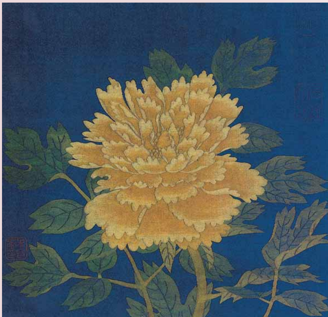
圖三 宋 繡絲〈牡丹〉遼寧省博物館藏