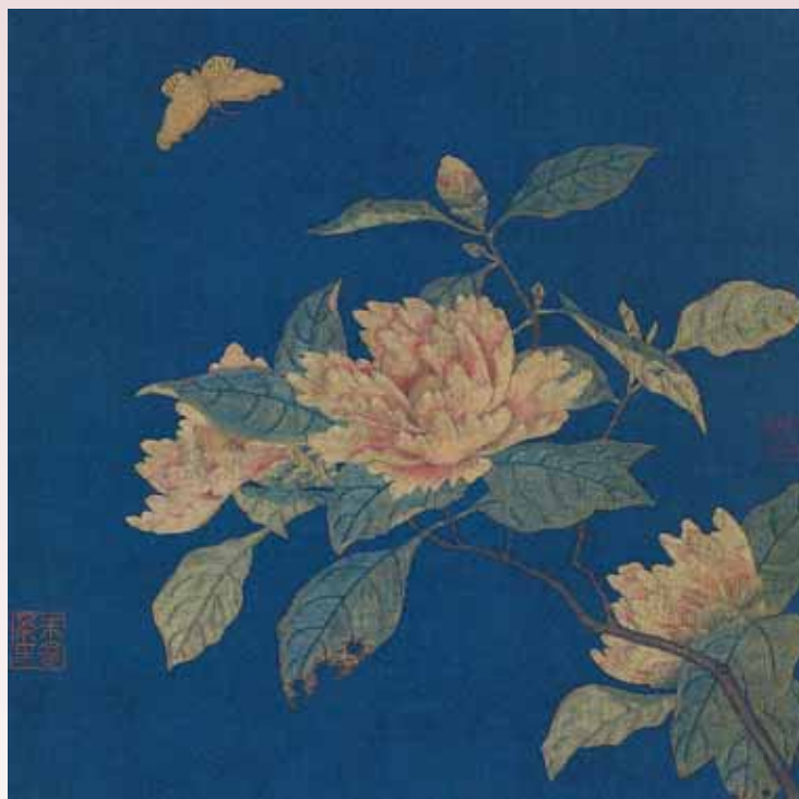
圖四 宋 繡絲〈山茶蛺蝶〉遼寧省博物館藏