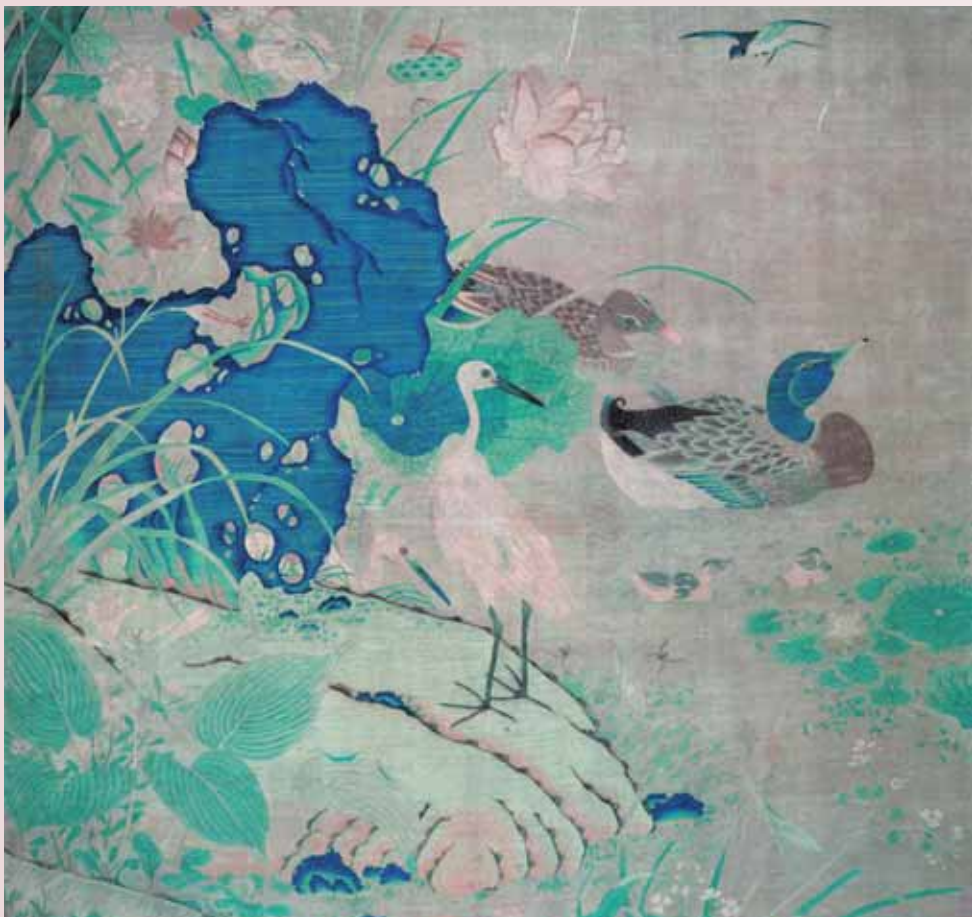
圖五 宋 繡絲〈蓮塘乳鴨圖〉上海博物館藏

稿本，即院體花鳥畫有所不同，推測是某件作品的局部或是朱氏自己設計的稿本。作品的特點是長短戛技法的