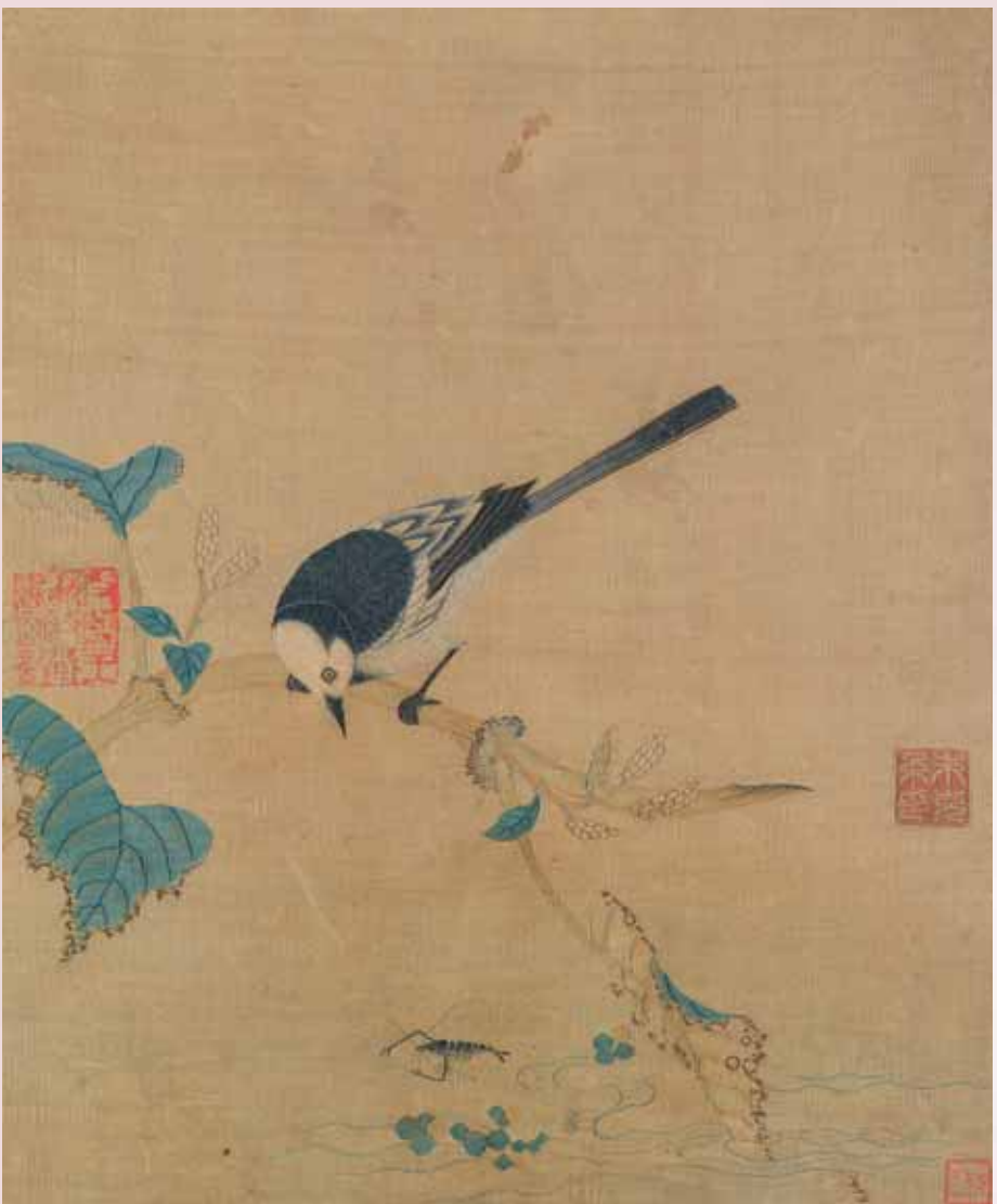
圖一 宋 繡絲〈鵝鴿紅蓮〉《繡繪集錦》第六幅 國立故宮博物院藏