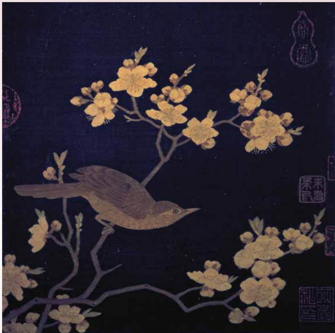
圖二 宋 繡絲〈桃花畫眉〉《繡繪集錦》第十幅 國立故宮博物院藏