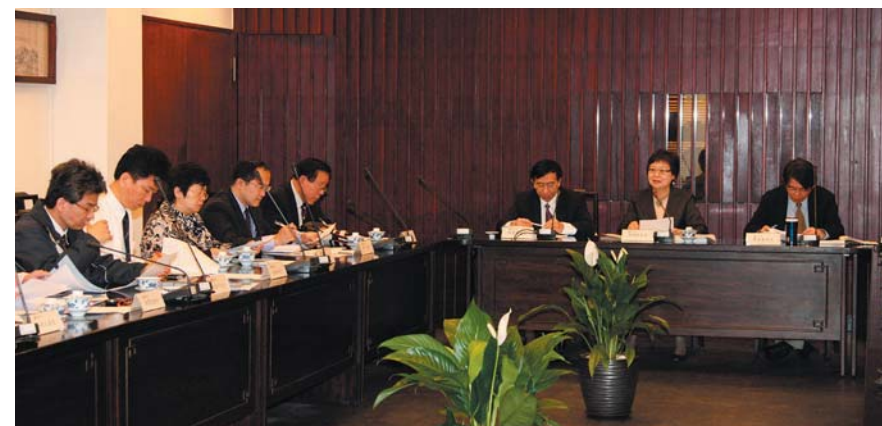
圖十 2009年2月27日在本院大會議室兩院館進行交流，達成之九點共識。