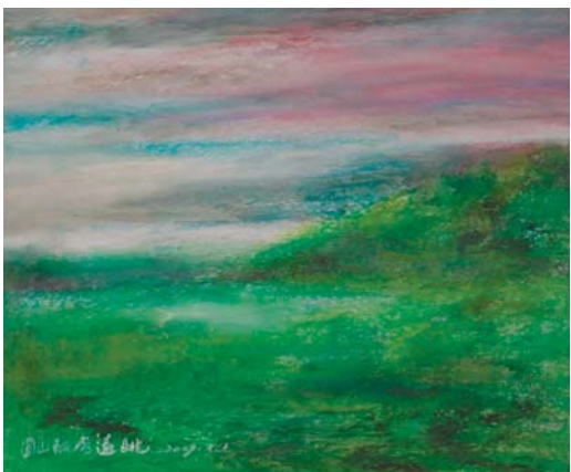
圖十九 圓山大飯店遠眺，陳燮君館長作於2009年3月1日

馬英九總統的「擱置爭議，製造雙贏」施政方針與行政院的「重大興利政策」，促成兩岸故宮隔絕六十年後進行交流；上海博物館則搭世博會便車，讓周功鑫院長也走訪了上海，促成了兩院館交流。當周院長甫抵上博，副館長陳克倫先生主動表示館藏