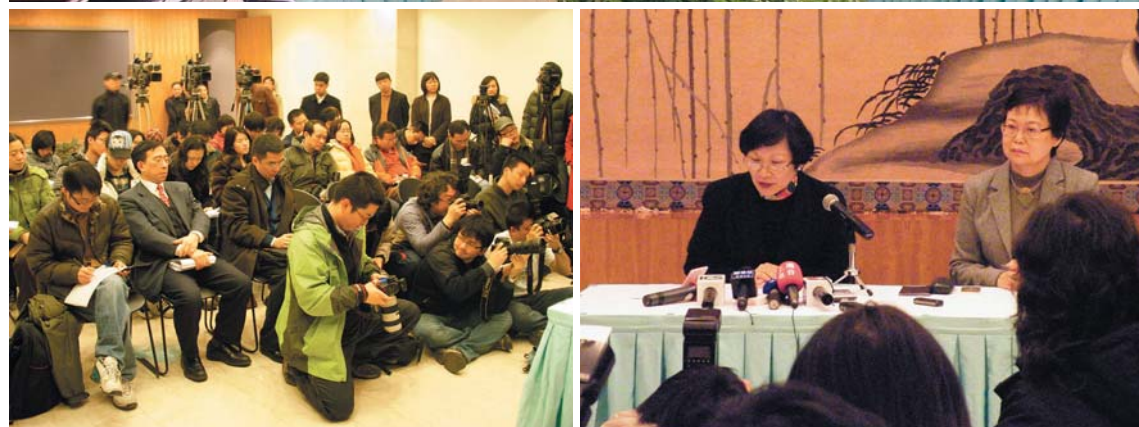
圖三 2009年2月18日兩院館同仁在周功鑫院長與陳燮君館長帶領下在上海博物館進行會談，達成九項共識(上)；會談後隨即召開記者會(下)。