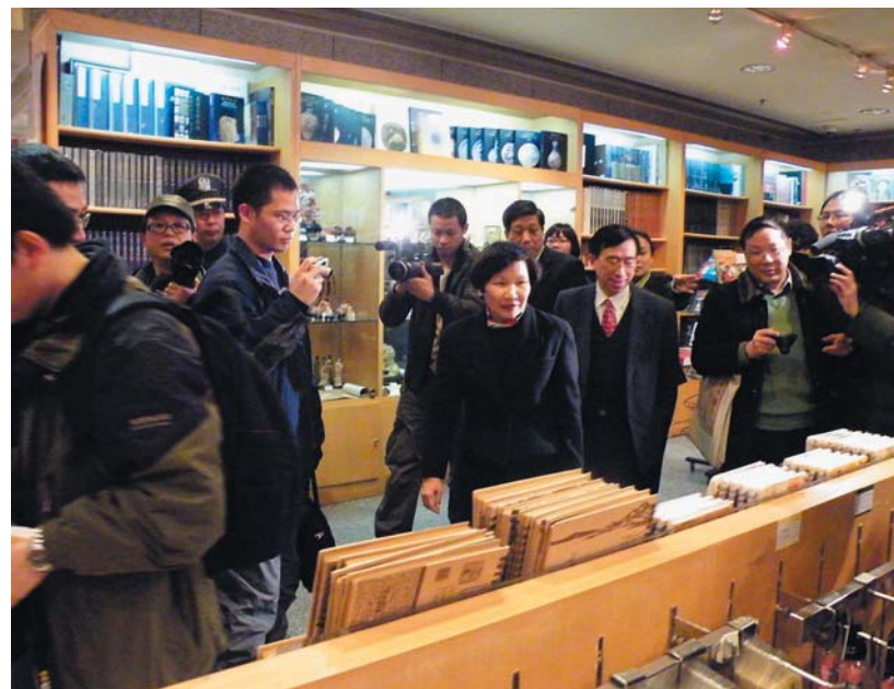
圖四 周功鑫院長在陳燮君館長陪同下參觀上海博物館禮品店