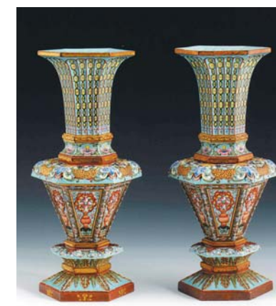
圖十一 清雍正綠地粉彩描金堆花紋六角形瓶 高37.7、口徑14.5、底徑14.5、腰徑16.9公分 上海博物館藏