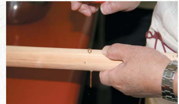
圖十二 打眼後安裝銅環