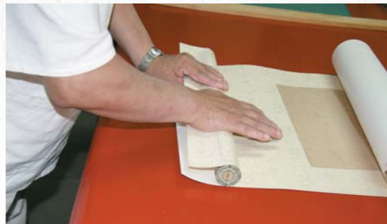
圖二一 粘接夾口與地杆的另一側

小結 月牙杆式橫批是裝裱形式中的一種很特殊的形式，能夠解決橫幅作品的收藏與懸掛的問題，但現在的書畫多裝進鏡框懸掛，這種傳統的方式已經棄之不用，況且使用這種方法裝裱的古舊書畫數量正在逐步減少，見到的機會也越來越少，因此只有抓住機會掌握，才能使這種特殊的裝裱形式流傳下去，使我們傳統修復技術完整的流傳下去！