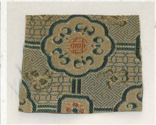
圖十 封天地杆兩頭所用的仿宋錦