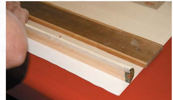
圖十四 粘接天杆與夾口紙