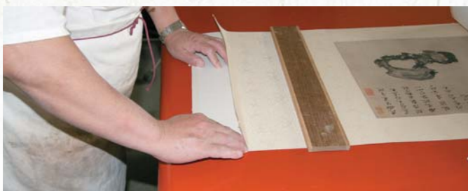
圖六 安裝天杆時把夾口與夾口紙之間的連接處取直