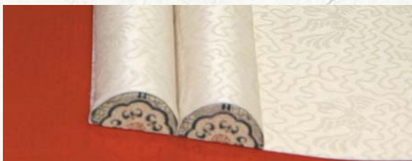
圖五 月牙杆地杆向畫心內側凸起