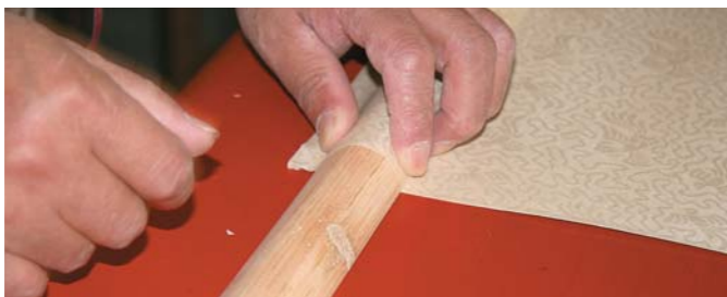
圖九 確定天杆截取長度

叫「夾口紙」，與所裝天（地）杆底的長度要相等，而夾口紙則要留出與杆的周長相等，為的是能把天（地）杆整個包裹住，不露出木質的顏色，製作好的掛軸或手卷會保證畫心正面是一個平面（圖四）。而月牙杆式橫批的特點就在於可以平整地懸掛在牆上，所以，它的天地杆都是向畫心一側凸起的，也就是說整個背面是一個平面，可以完全平整的釘在牆面上