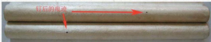
圖二 固定在牆面上時地杆上錯位釘兩個釘子

而月牙杆橫批的地杆是用一根普通立軸的地杆劈開成兩個半圓柱體，在卷起時合成一個圓柱體，可以與畫心緊密貼合，沒有縫隙，打開時兩個半圓柱體並排向畫心一側凸起，使背面平整，便於懸掛於牆面。它既可以與手