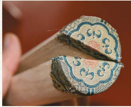
圖十八 用仿宋錦封頭後要能拼出一個完整的花紋