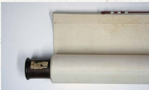
圖四 一般立軸的天杆，內側與畫心為一個平面