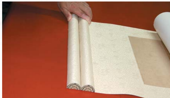
圖二二 粘接完成後地杆向畫心一側凸起