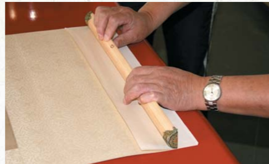
圖十三 粘接天杆與夾口