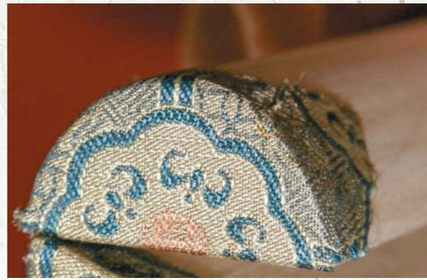
圖十一 封好頭的天杆一側，按完整花紋的一半包裹半個圓柱體截面

和夾口紙，也用仿宋錦把地杆的兩頭封好，在封的時候要分別把兩個半圓形截面各包半個花紋，拼合後形成一個完整的花紋（圖十八）。封好後要用一條高麗紙或皮紙把兩根杆的一邊相連，以增加強度，使得裝好後的杆更加結實（圖十九）。接下來在地杆的圓弧面塗上漿糊，把夾口按圓弧狀與地杆粘接，再把夾口紙與地杆粘接即可（圖二十一、二）。 這樣，一張月牙杆式橫批就完成了。