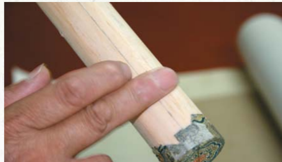
圖十九 用高麗紙或皮紙連接兩根地杆