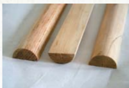
圖三 月牙杆橫批所需的三根半圓柱體杆