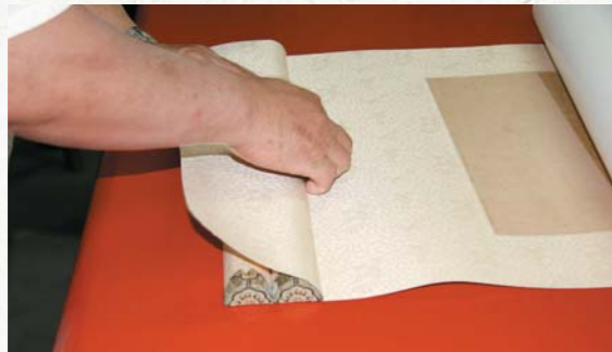
圖二十 粘接夾口與地杆的一側