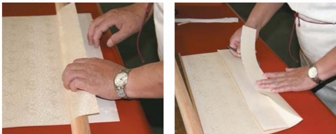
圖七 用天杆來確定夾口長度