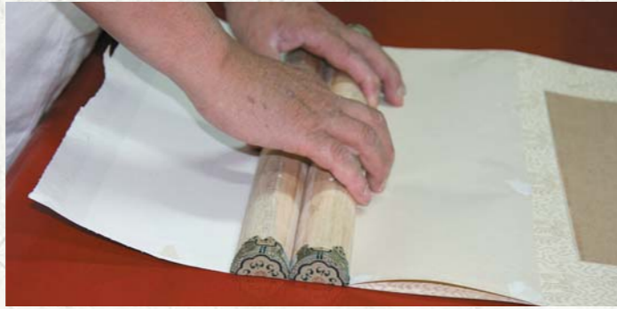
圖十七 用並排的兩根地杆確定夾口及夾口紙的長度