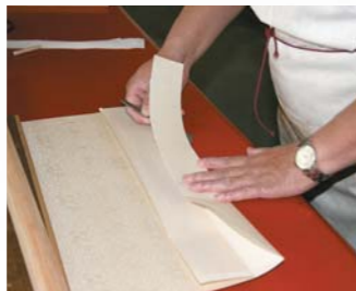
圖八 確定夾口紙長度後去除多餘部分