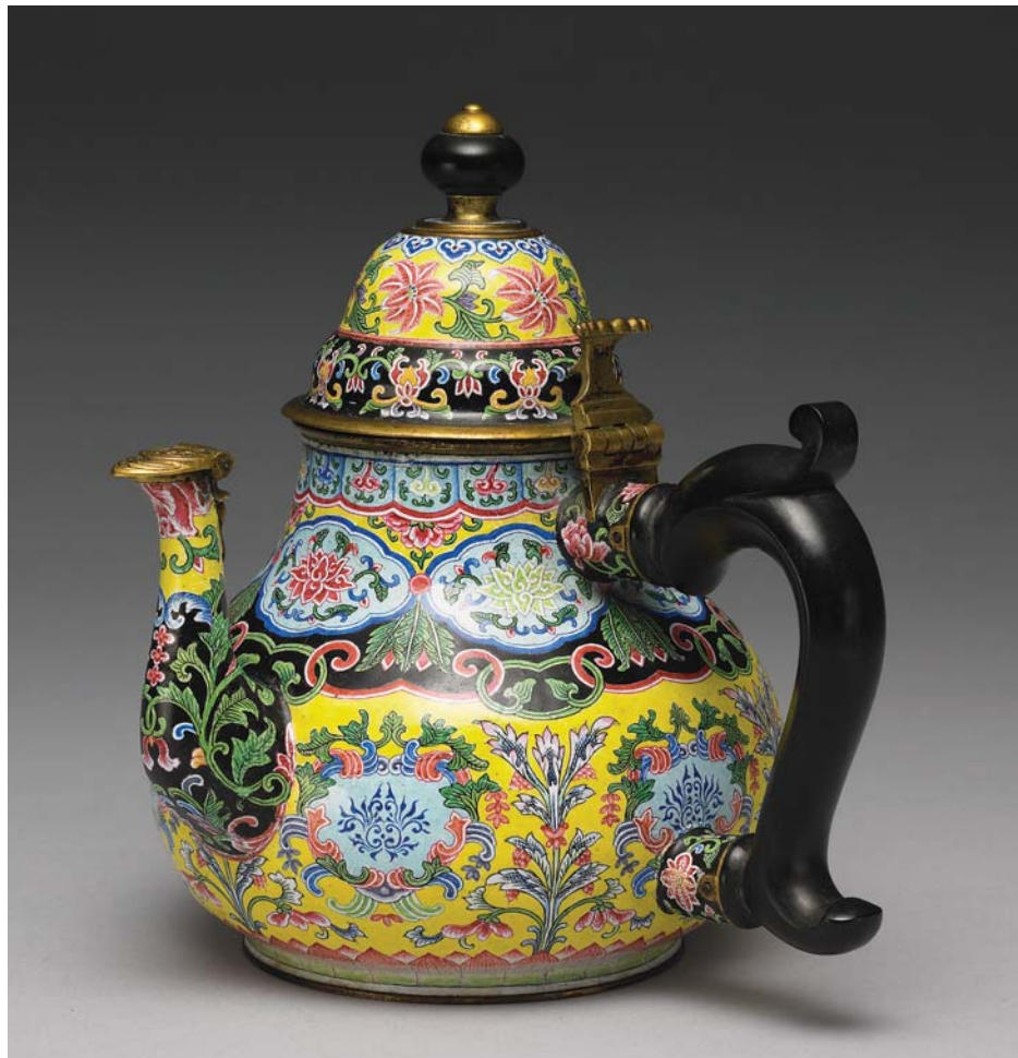
清 雍正 畫珐瑯烏木把手執壺 國立故宮博物院藏

第二部分：雍正朝的文化與藝術 雍正時期的文化與藝術，一如這 十三年中的政治與經濟，有著承先啓 後的特色與功能。展覽的第二部分，