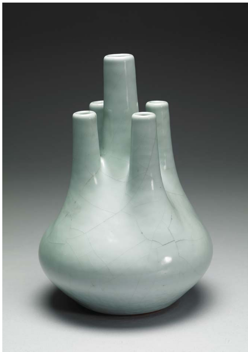
清 雍正 汝釉瓷五孔瓶 國立故宮博物院藏

雍正皇帝從登基到死亡傳聞不 斷，留下許多話題，至今仍為天津津 樂道，史學家未有定論，是一位極複 雜的歷史人物。他為鞏固皇權，打擊 對手，六親不認，極為殘酷，留下罵 名；然而做為統治者，他剛毅果決，