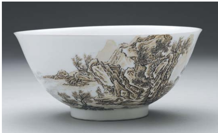
清 雍正 瓷胎畫珐瑯墨山水碗 國立故宮博物院藏