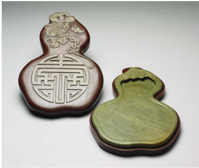
清 雍正 松花石硯 國立故宮博物院藏