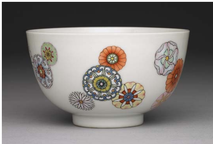
清 雍正 粉彩團花紋碗 國立故宮博物院藏

他留下了洋洋灑灑不下數十萬言的手書硃批，這空前絕後的帝業，為他贏得最勤政的皇帝歷史評價；他授意創作的各式《胤禛行樂圖》，至今撲朔迷離，讓人弄不清何者是真實生活，何者是理想境界；他親自監製的雍正款用器，豐富而多元，充分顯示出他極高的藝術品味。總之，隨著各種史