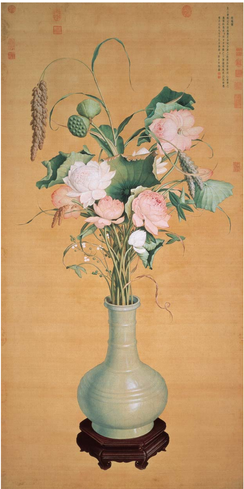
清 郎世寧 聚瑞圖 國立故宮博物院藏