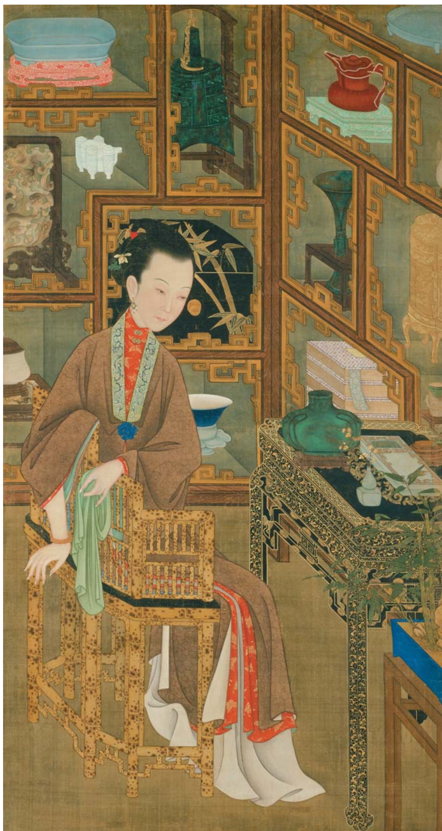
清人畫美人圖·鑒古 北京故宮博物院藏