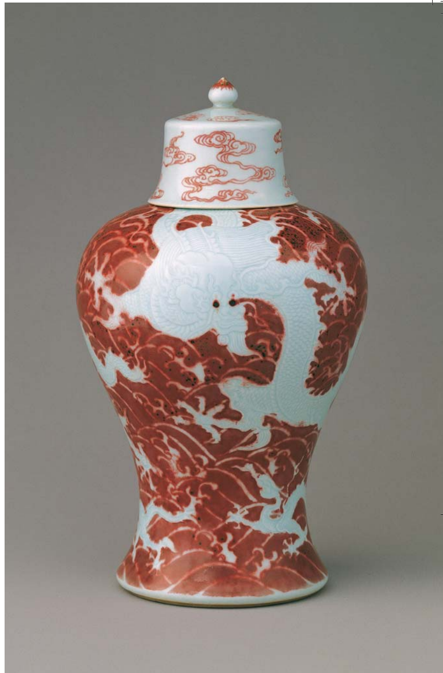
清 雍正 紅地白龍海水紋蓋罐 國立故宮博物院藏

清世宗雍正皇帝，可以說是歷史上最具爭議的皇帝。從登基到實天，傳言不斷，民間稗官野史與官方歷史檔案，兩極評價，南轅北轍。傳說中的雍正帝，是一位生性多疑、手段殘酷、刻薄寡恩、酗酒好色、擅弄權術、喜怒無常，陰狠毒辣的統治者；歷史上的清世宗，則是一位剛毅果決、勤於理政、勇於革新、賞罰分明、講求實際，品味極高、承先啓後的英明君主。 他究竟是怎樣的一位皇帝，傳說與歷史記載中有幾分接近事實真相，在展覽第一部分「雍正皇帝的一生」中，分胤禛其人、與父皇關係、與弘曆關係、君臣關係、治理天下、宮廷生活、宗教信仰、傳位實天等八單元，藉由史書檔案、書畫器物等珍貴文物，鋪陳解讀雍正其人、其事、其政及其高品味的宮廷生活。以文物細說雍正皇帝的故事，釐清歷史與傳說，為觀眾解惑，也保留了詮釋空間。 雍正是一位充滿傳奇色彩君王，