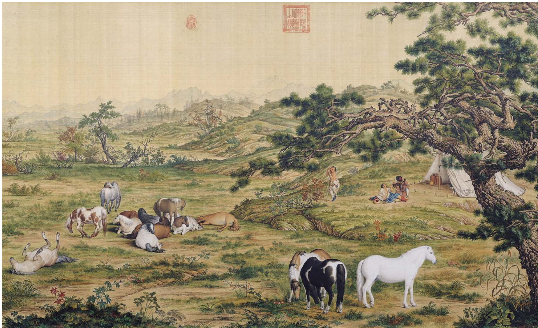
清 郎世寧 百駿圖 卷 局部 國立故宮博物院藏

的交流項目展開討論：「雍正—清世宗文物大展」於十月七日正式揭幕，「兩岸故宮第一屆學術研討會」為君難—雍正其人其事及其時代」也將於十一月四至六日在臺北召開。