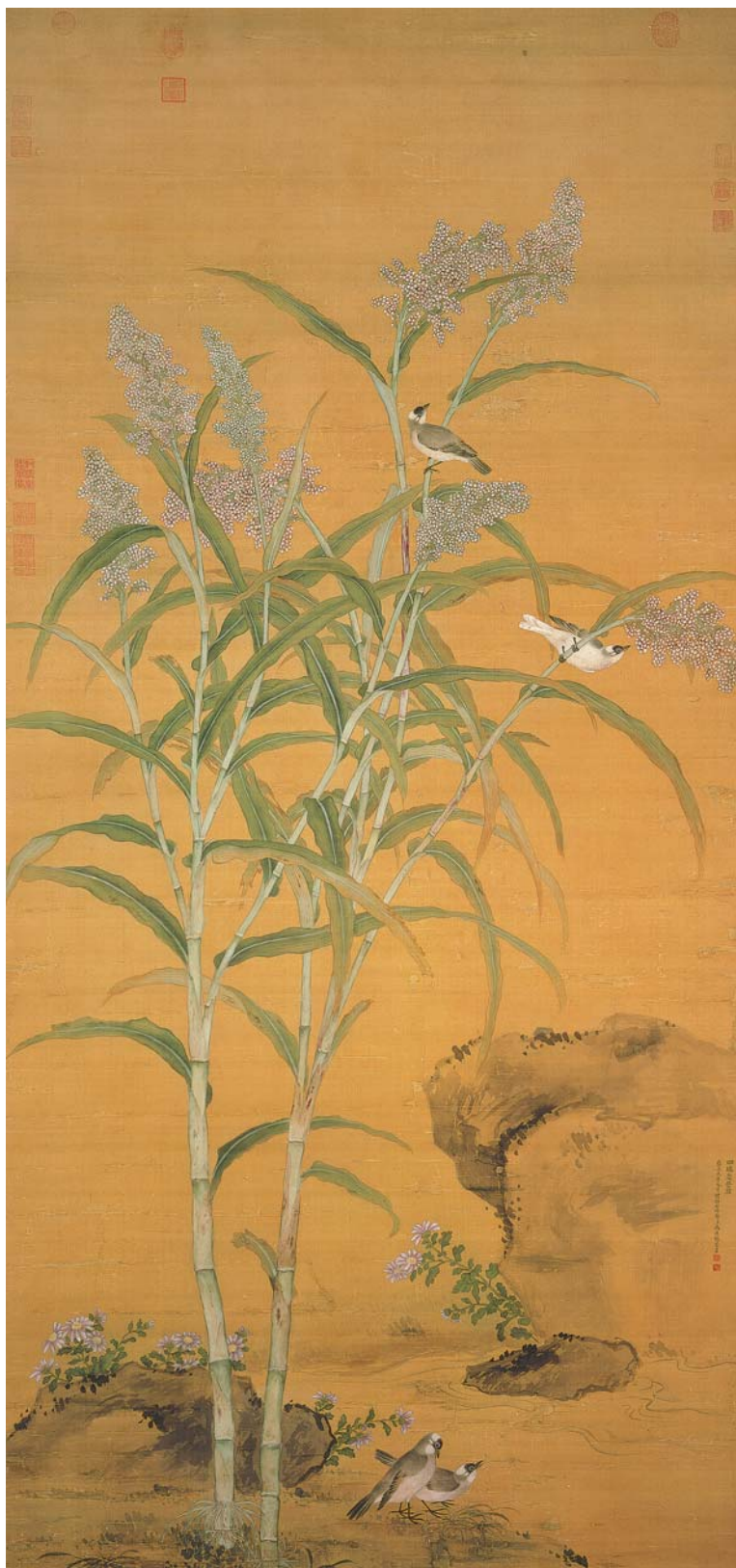
清 蔣廷錫 畫四瑞慶登圖 軸 國立故宮博物院藏

勇於革新、勤於理政、肅貪養廉、澄 清吏治、掃除頹風、政局穩定、國庫 充盈、人民負擔減輕，上承康熙，下 啓乾隆，是奠定「康乾盛世」的關鍵 人物，一位出色的皇帝。在文化事業 上，他講究皇家氣勢，完成《古今圖